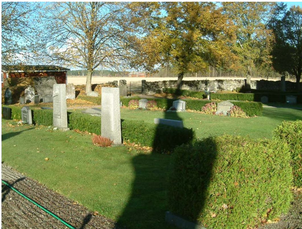
Kvarter B, inre delen.

Kvarteret består av alla gravvårdar längs med norra muren samt av två gräsmattor norr om kyrkan. Inom kvarteret finns dels avställningsplatsen för borttagna gravvårdar längs med kyrkogårdsmuren i nordväst och dels minneslunden som avbryter gravraden längs med norra kyrkogårdsmuren.