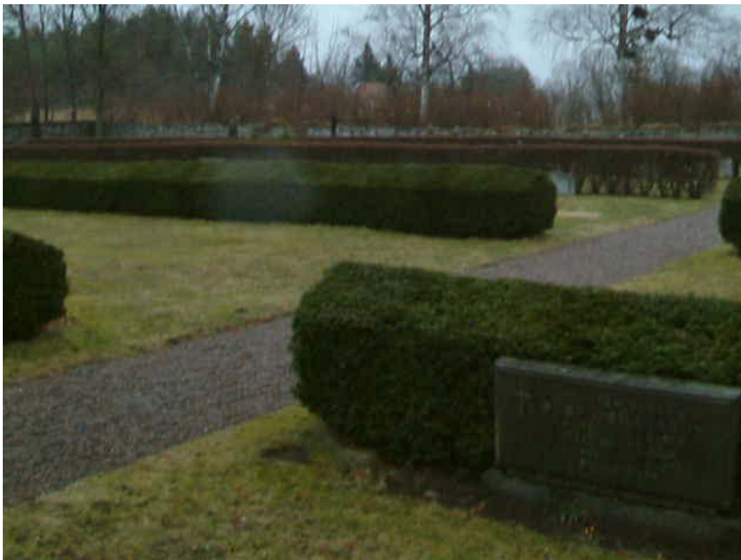
Kvarter C till vänster och D till höger.

Kvarteret består av alla gravvårdar längs med östra muren och en större gräsmatta öster och nordöst om kyrkan.