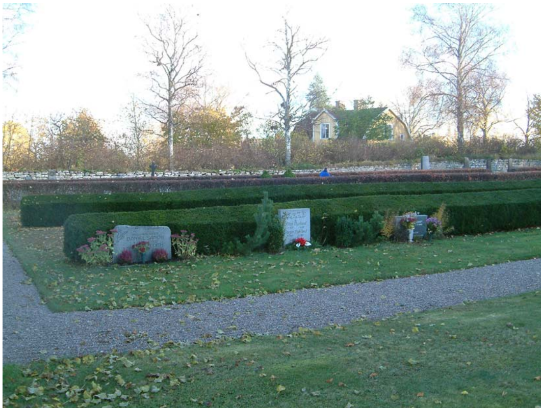
Kvarter D, inre delen.

Kvarteret består av alla gravvårdar längs med södra muren, sträckan fram till huvudgrinden, samt av två gräsmattor söder och sydöst om kyrkan.