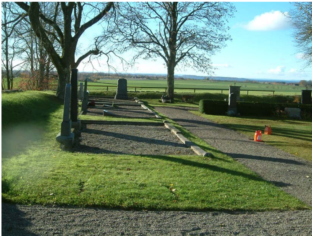
Kvarter A norra sidan.

Kvarteret består av gravar placerade längs med kyrkogårdens yttersida från huvudgrinden till sydvästra hörnet och längs västra kyrkogårdsmuren fram till nordvästra hörnet. Till detta kommer den västligaste av de tre gräsmattor som bildas av gångarna framför kyrkan.