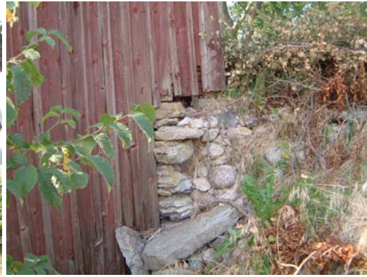
Bodens anslutning till kyrkogårdsmuren.