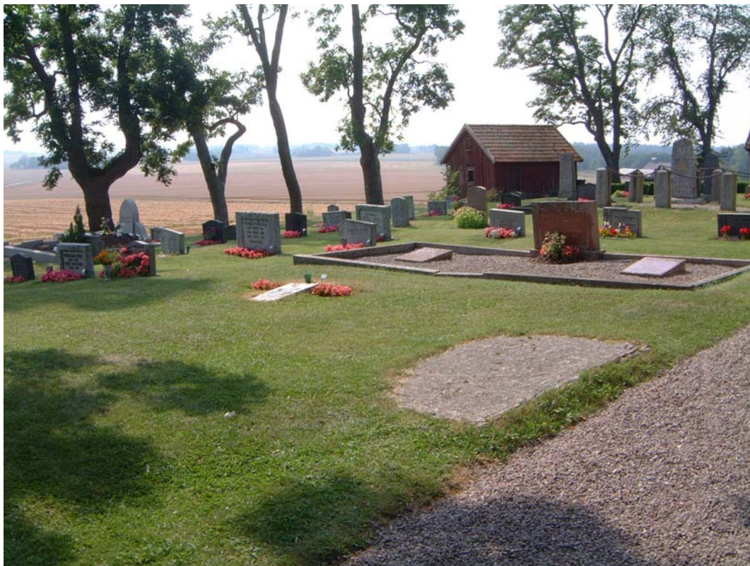
Kvarter I från nordöst. I bakgrunden syns boden/uthuset som delvis vilar på kyrkogårdsmuren.

En öppen karaktär med alla vårdar vända åt öster, utom utmed östra muren.