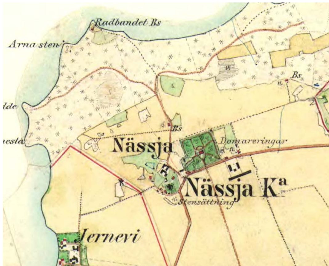
Utsnitt ur häradsökonomiska kartan 1868-77, Nässja. Fattigstugan ligger i anslutning till västra kyrkogårdsmuren.

Kyrkan och kyrkogården är belägen i kyrkbyns sydvästra utkant på en lövträdsbevuxen kulle. På storskifteskartan från 1780 finns sex gårdar markerade nordväst, norr och nordöst om kyrkan.