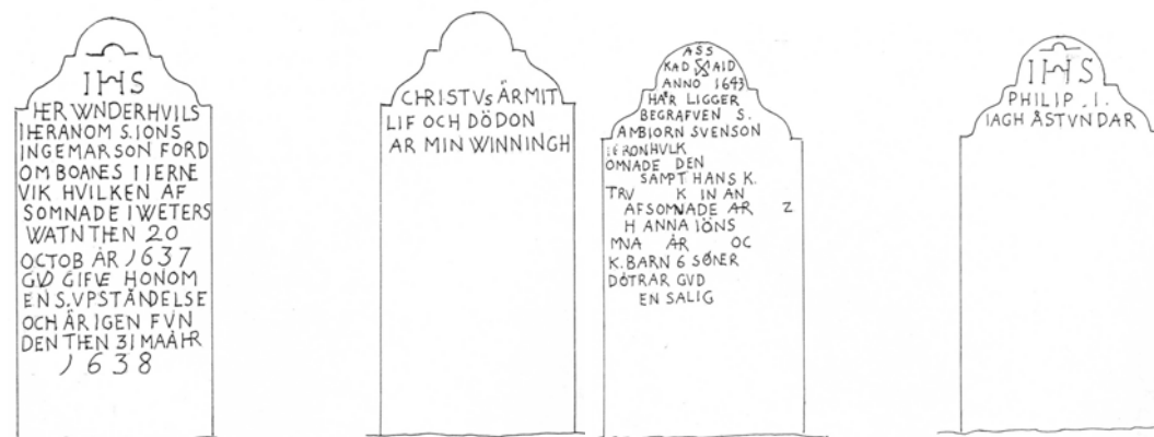
Två gravvårdar i kalksten från 1600-talet. De står söder om kyrkan tillsammans med en gravvård från 1597 (se den allmänna beskrivningen). Teckning av Sune Ljungstedt.

Det finns sex grusgravar omgivna med stenram och en med kätting. Vårdar och omramning är enhetliga. Dessutom finns två grusgravar omgivna av buxbomshäckar. Vid mittgången i öster ligger en ålderdomlig gravhäll i kalksten från tidigt 1600-tal och i kvarteret finns tre resta ålderdomliga kalkstenvårdar, varav en i gott skick från 1500-talet. Några gravvårdar från 1800-talets andra hälft och tidigt 1900-tal är höga och de mer sentida vårdarna är i allmänhet låga och breda, en del från 1930-50-talet i svart granit. Gravläggningarna är från 1866-2002, flertalet från 1900-talet. Ett odaterat träkors i öster. (Osäkert om någon av de äldsta stenarna står på ursprunglig plats). Vanligast förekommande material är grå, svart och röd granit, samt kalksten.