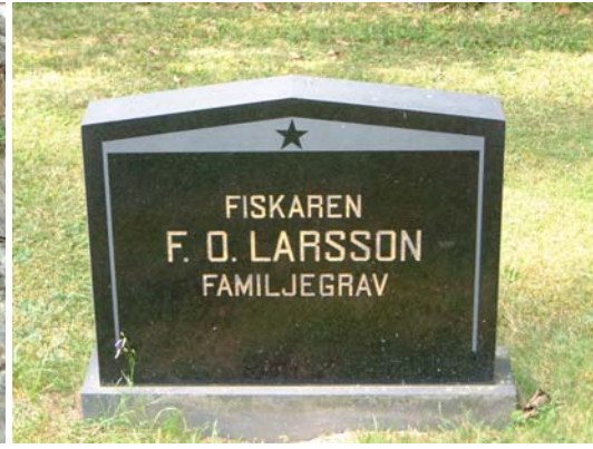
Undanställd kalkstensvård, omkr år 1600. Familjegrav i svart granit.