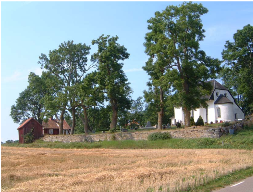
Nässja kyrkogård från sydöst.

Kyrkogården består av två kvarter: I och II.