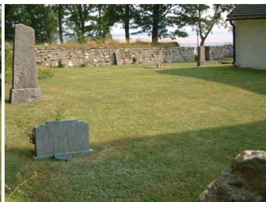
Kvarter II, östra delen från nordväst.