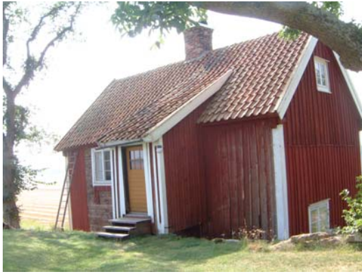
Fattigstugan från nordöst.