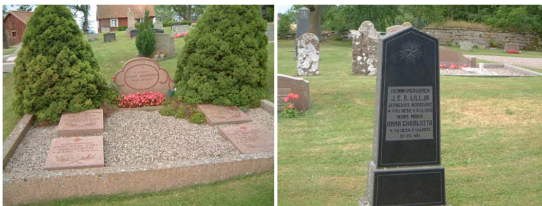
Grusgrav med enhetlig stenram och vård. Gravvård i svart granit, 1916.