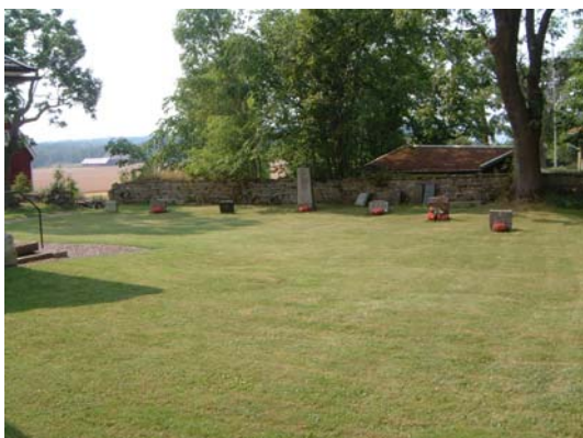
Kvarter II, västra delen från nordöst.

Kvarteret omfattar gravplats nr 1-34 och ligger på kyrkogårdens norra del. Utanför kyrkogården i väster, norr och öster ligger trädgårdar, i söder kvarter I och kyrkan.