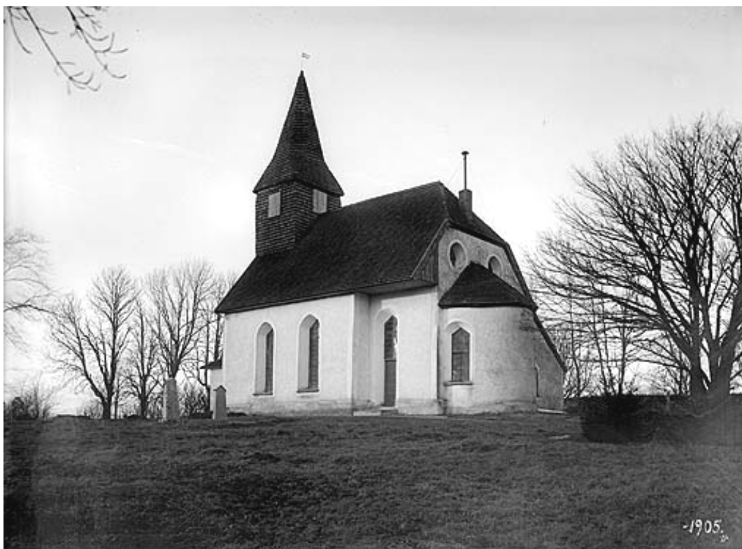
Fotografi av Nässja kyrka 1905. Kyrkogårdens sydöstra del uppvisar inga gravvårdar. Kan man ana gräskullar utan markering?

Uppgifter om kyrkogårdens historik har i huvudsak hämtats från Östergötlands läns museums topografiska arkiv och bibliotek. Uppgifter om äldre lantmäterikartor är hämtade från Lantmäteriets websida.