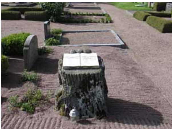
Kvarter 5, en av de mer anmärkningsvärda vårdarna. Stubben är av sandsten och bär ekbladsornamentik, boken är av vit marmor. Vården tillhör Carl Lundqvist d. 1873. (KI Vimmerby kyrkog. 075)