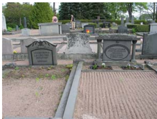
Kvarter 12 med många grusade gravplatser som är tätt placerade. Grå granit dominerar som material. Klassicerande motiv är vanligt. Här syns vårdarna över en hemmansägare och en lägenhetsägare. (KI Vimmerby kyrkog 180)