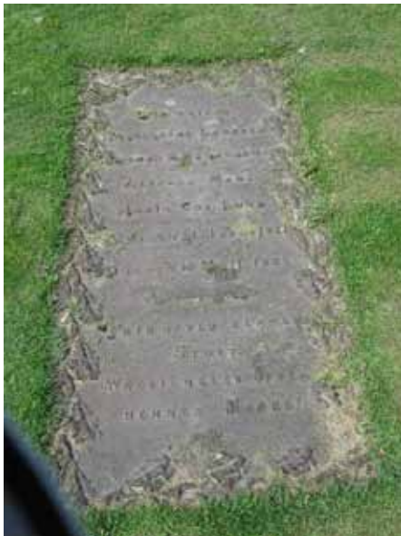
Kyrkogårdens äldsta gravvård finns i kvarter 8, en ekbladsornerad gjutjärnsvård från 1829, hittflyttad från den gamla kyrkogården. (KI Vimmerby kyrkog 117)