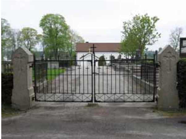
Kyrkogårdsingången i höjd med S:t Johannes kapell. (KI Vimmerby kyrkog 024)

Se vidare i de enskilda kvartersbeskrivningarna.