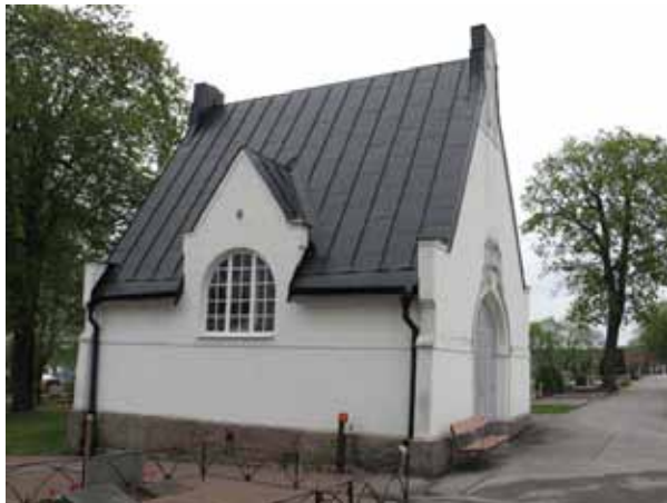
Gamla kapellet mot norr. (KI Vimmerby kyrkog 012)

rektangulär yta med två kapellbyggnader och stora, mestadels grusade områden med många stora gravplatser och gravvårdar. I nordost finns ett i det närmaste trekantigt område som tillkom på 1920-30-talen, men som togs i bruk först på 1960-talet. Här är gravplatserna anlagda i gräsmatta. I området finns många olika typer av vegetation. Nedanför den äldsta kyrkogårdsdelen, mot väster finns den yngsta kyrkogårdsdelen, med anslutning via trappor. Även här präglas området av grönska. Bara två av kvarteren är hittills i bruk.