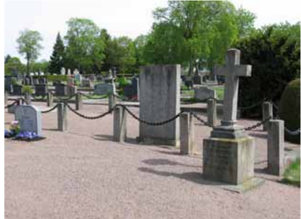
Vy över kvarter 8 mot nordost med olika typer av vårdar. (KI Vimmerby kyrkog 112)