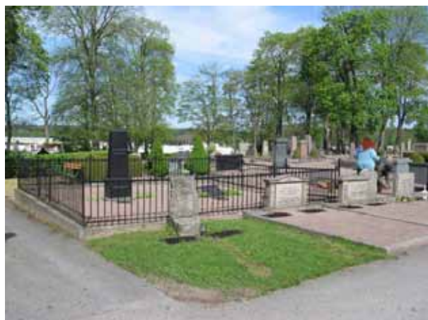
Kvarter 6 mot nordväst med stora gravplatser och fonden av träd i bakgrunden. (KI Vimmerby kyrkog 079)