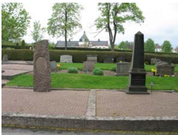
Kvarter 1 mot öster. Här syns strukturen med grusade gravplatser längs gången och en inre del med lägre vårdar i gräs, i partier mot rygghäck av tuja, (KI Vimmerby kyrkog 036) struktur

Häckmaterialet i området består av tuja, måbär och buxbom. Mot områdets östra, södra och västra utkanter finns den granhäck som omgärdar kyrkogården. Denna fungerar här som rygghäck för de yttersta gravraderna. Några få gravplatser är dekorerade med formklippta tujor. Även annan vegetation förekommer, dock i liten omfattning, exempelvis sockertoppsgranar.