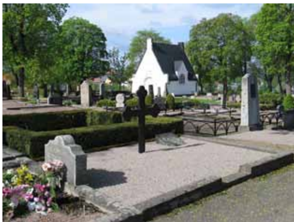
Kvarter 5 mot sydväst. Stora, omgärdade, grusade gravplatser med varierande vårdar. (KI Vimmerby 068)

I kvarteren finns en stor variation när det gäller gravvårdstyper, många mycket påkostade och ovanliga. I blickfånget hamnar gärna riktigt höga vårdar av grå eller svart granit som är formade som obelisker, eller höga vårdar med vinkelställda eller asymmetriska krön. Många av de stora vårdarna är också mycket kraftiga och har rustik yta. Några vårdar är i formen av kors eller är låga och riktigt breda. Ovanliga material märker också ut sig såsom kors av gjutjärn (8st), hällar av samma material (2 st), ett antal vårdar av sandsten och/eller marmor samt någon av kalksten. Av dessa senare är flera mycket fina hantverksmässigt utförda arbeten, såsom en stubbe av sandsten med en uppslagen bok av marmor eller en vård av sandsten med huggen murgrönsdekoration och kors av marmor. En av de riktigt höga vårdarna har ett porträtt av den döde utförd i brons, monterad på stenen. Många av vårdarna i området är också mer modesta till storlek och utformning. En vanlig form är en rektangulär sten med vinkelställt krön. Många av denna typ är från 1930-talet och framåt. Sammanlagt finns i de fyra kvarteren omkring ett 50-tal vårdar från 1800-talet, främst från seklets mitt och senare del. Den äldsta vårdan från 1829, är enligt uppgift flyttad från den gamla kyrkogården kring kyrkan. Gravvårdarna i området är i övrigt från samtliga decennier av 1900-talet. Många gravplatser har brukats av samma familj under lång tid vilket resulterat i flera gravvårdar från olika tider.