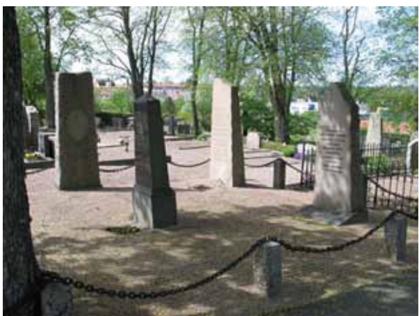
Kvarter 6 med en av de riktigt stora gravplatserna. Här syns några vårdar från 1890-talet samt 1910- och 20-talet. (KI Vimmerby kyrkog 088)