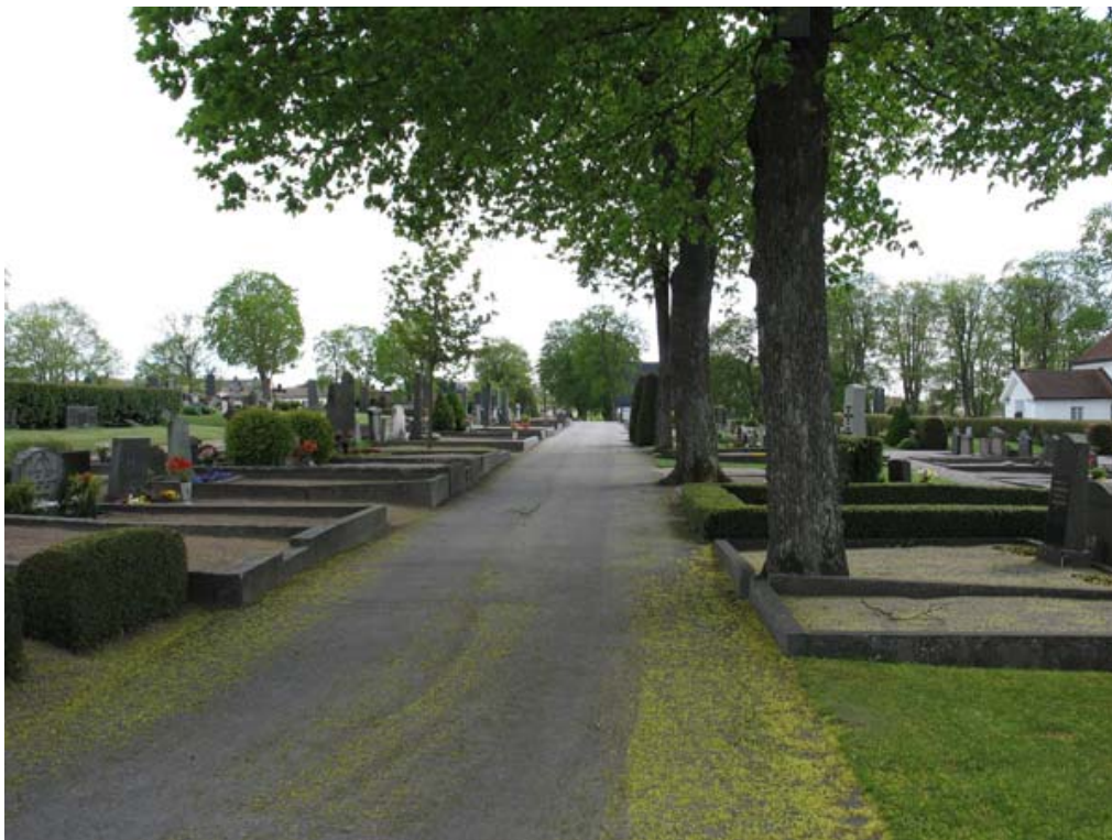
Huvudgången mellan kvarter 11 och 12. Notera grusgravarna med stenramar som följer längs med hela gången samt lönnarna. (KI Vimmerby kyrkogård 173)

Kvarter 9-12 utgörs av ett nästan rektangulärt område i kyrkogårdens norra del. Området lades till kyrkogårdens yta i slutet av 1800-talet och togs successivt i bruk från 1890-talet och framåt. Sannolikt har hela området brukats för köpegravar. Grusgravar är utmärkande för området, men gräs har såtts in i delar av kvarterens inre. Kvarteren har brukats kontinuerligt vilket gjort att vårdarna är av varierande åldrar och utförande. De fyra kvarteren är uppdelade av två gångar som korsar varandra i en rät vinkel. En gång finns också väster om området. Huvudgången i nord-sydlig riktning, gången fram till kapellet och den nordligaste gången är asfalterade, övriga grusade. Väster om området är lönnar planterade längs ytterligare en asfalterad gång. Norr om området finns en tät allé av lönnar. Några få lönnar finns också längs den östra kanten av kvarter 11 samt någon formklippt tuja. I den sydvästra delen av området ligger det nya kapellet som byggdes på 1950-talet. Ekonomibyggnaden med kyrkogårdsförvaltningens expedition ligger norr om kvarter 11.