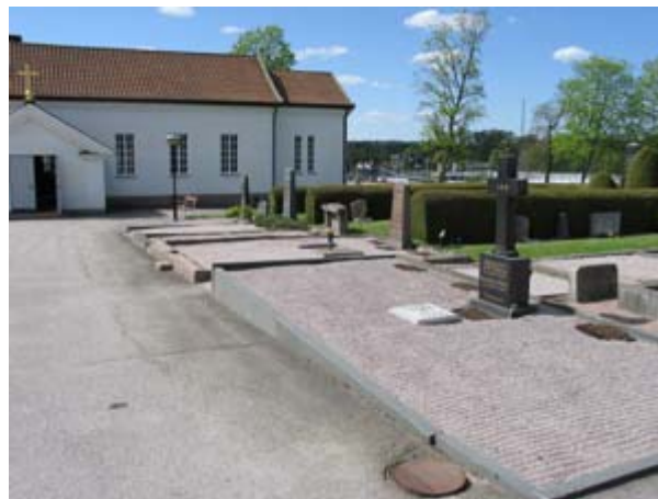
Kvarter 10 mot nordväst med nya kapellet. Raden närmast gången till kapellet kantas av högresta vårdar på stora gravplatser. Inne i kvarteret finns mindre vårdar och platser. (KI Vimmerby kyrkog 146)