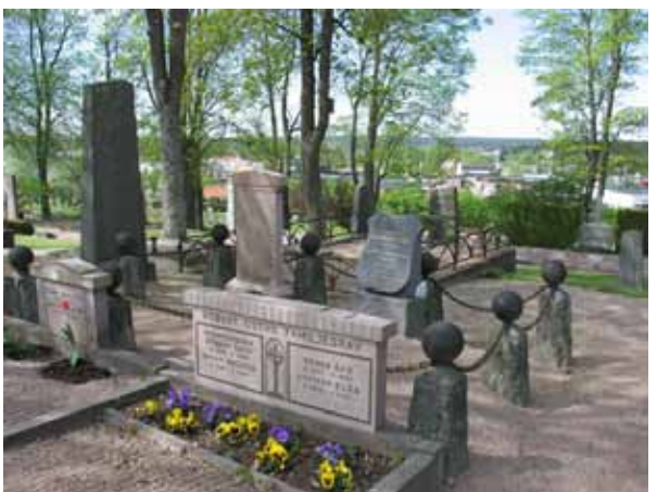
Kvarter 7 mot sydväst. Här syns familjen Hammar-skjölde gravplats i bildens mitt, med bl a en kalkstensvård från 1860-talet. (KI Vimmerby kyrkog 103)