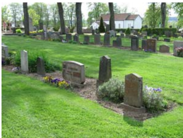
Kvarter 13 mot sydväst med rad på rad av ryggvända linjegravvårdar i jordremсор i gräsmattan. Träden i bakgrunden är allén av lindar som leder fram till ekonomibyggnaden. Det nya kapellet syns också i bild. (KI Vimmerby kyrkog 184)

Kvarter 13 utgörs av en nästan trapetsoid yta i den sydvästra delen av det område som lades till kyrkogården på 1920-talet. Kvarterets yta är gräsbesädd och gravvårdarna står tätt och ryggeställda i jordremсор som tagits upp i gräsmattan. Gravvårdarna är relativt små och jämnstora och åldersmässigt från 1930-talet och framåt. Området har brukats som linjegravsområde. I den norra delen av kvarteret längs gången mot kvarter 16 står några vitoxlar. Kring kvarteret finns i söder den allé av lönnar som leder till ekonomibyggnaden och i öster den allé av lönnar som markerar huvudstråket i kyrkogårdens nordliga, nästan trekantiga del. I väster går kvarterets rader nästan ända fram till ekonomibyggnaden.