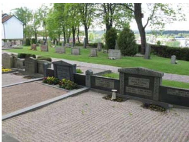
Kvarter 11 mot söder. Här finns både rader av grusade gravplatser och sådana i gräs. Vårdarna är mestadels låga och bär klassicerande drag. Närmast i bild syns några gravstenar från 1950-talet. (KI Vimmerby kyrkog 162)