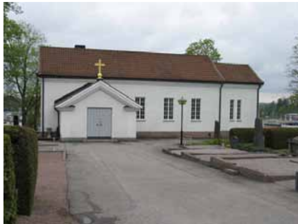
S:t Johannes kapell mot väster. (KI Vimmerby kyrkog 015)