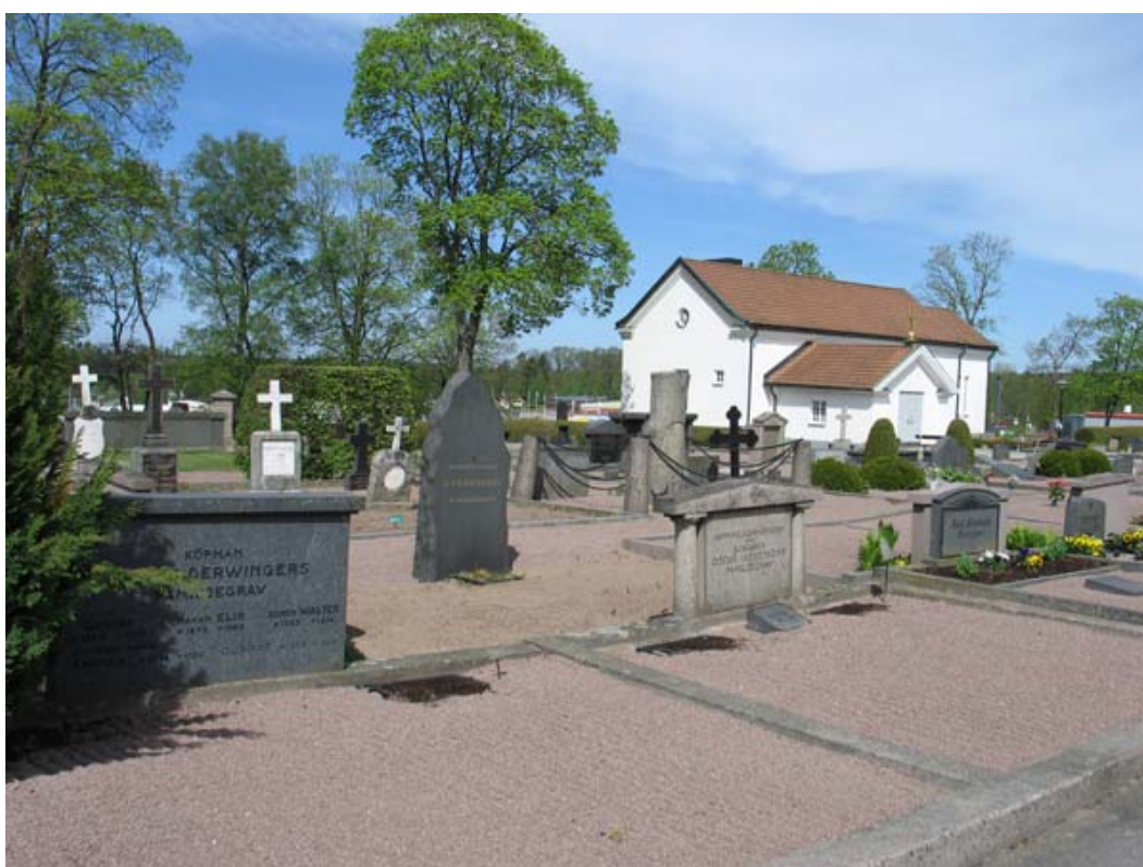
Vy över kvarter 7 mot nordväst. Här syns mångfalden av olika gravvårdstyper. Det nya kapellet finns i bakgrunden. (KI Vimmerby 096)

Kvarter 5, 6, 7 och 8 utgör kyrkogårdens äldsta del och rymmer familjegravplatser från 1800-talets mitt och framåt. De fyra rektangulära kvarteren är uppdelade av två gångar som korsar varandra i en rät vinkel. I den södra änden av området ligger det gamla kapellet som byggdes 1905. Karaktäristiskt för området är de många grusgravarna och mängden påkostade och stora gravmonument. Många gravplatser omgärdas av stenramar, järnstaket eller låga häckar. Rygghäck förekommer endast i en rad i kvarter 7. Gravplatserna varierar mycket i storlek. Längs mittgången som går i nord-sydlig riktning finns här ingen trädrad, så som är faller i kyrkogårdens södra och norra del. En enda lönn står kvar i höjd med kvarter 5 och 6. Däremot finns en rad stora lönnar längs gång och väg som finns väster om området. Kvarter 6 ligger i en liten sluttning, vilket gjort att området lätt terrasserats.