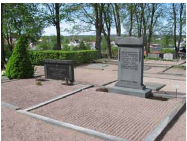
Kvarter 6, här med två gravplatser omgärdade av stenram. Vårdarna bär klassicerande drag och är daterade till 1930 respektive 1940-tal. Den högra vården är rest över Sadelmakaremästaren Oscar Johansson. (KI Vimmerby 093)