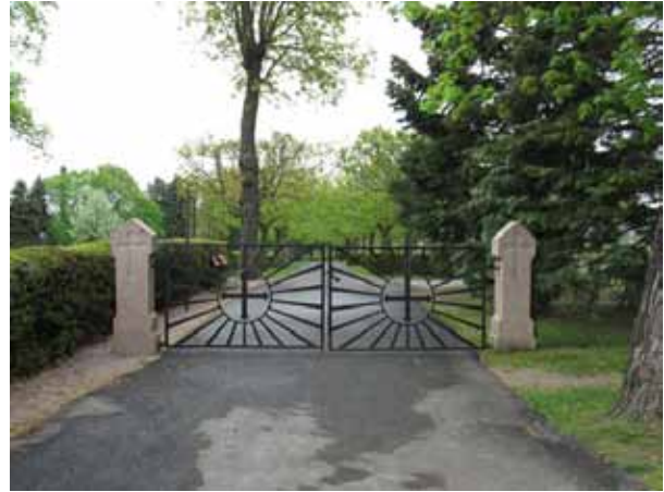
Kyrkogårdsingången mot området i nordost. (KI Vimmerby kyrkog 025)