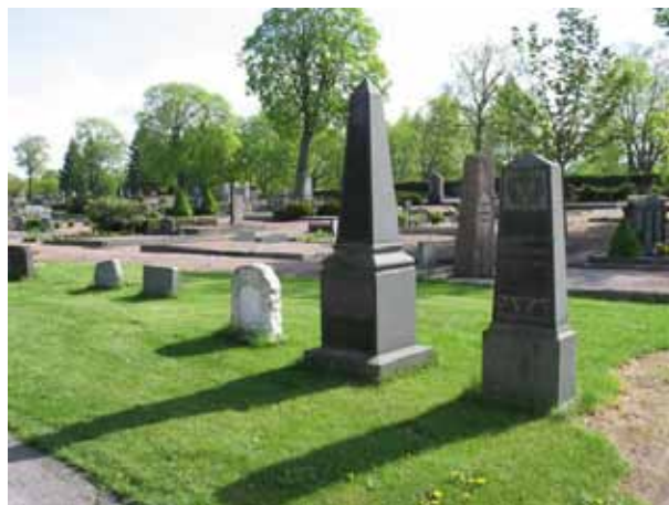
Kvarter 5 mot nordost. Här har gräs såtts in i på flera gamla gravplatser längs gången. Notera de olika typerna av vårdar. I bildens mitt syns en vård av sandsten och marmor. (KI Vimmerby kyrkog 070)