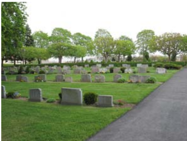
Strikt ordnade rader av vårdar i gräsmatta. Notera den omgivande trädkransen. (KI Vimmerby kyrkog 205)

Kvarteren 14-19 ligger i kyrkogårdens allra nordligaste del, i den del som nästan är trekantig till sin form. Området togs i bruk på 1960-talet. I kvarteren är gravvårdarna placerade i gräsmatta i strikta rader, med eller utan rygghäckar. Gravvårdarna är i nästan hela området mycket enhetliga både i storlek och utförande. I kvarter 19 och i norra kanterna av kvarteren 16 och 17 (kallat kvarter 6U) finns urngravsområden med mer fritt placerade vårdar mellan höga ädelgranar och annan blandad vegetation. Dominerande i området är den vältuktade allé av lönnar som finns längs områdets huvudgång och som i lövat tillstånd nästan blir som en tunnel för besökarna att passera genom. Området omges av ädelgranar mot norr och nordöst och ädelgran med inslag av lönn mot väster. Inne i kvarteren finns häckar av bl a oxbär och spirea. Minneslunden ligger i områdets nordöstra del. Kvarteren skiljs från varandra av gångsystemet. På många av gravplatserna där rygghäckar saknas finns annan vegetation såsom formklippta tujor, sockertoppsgran eller ölandstok.