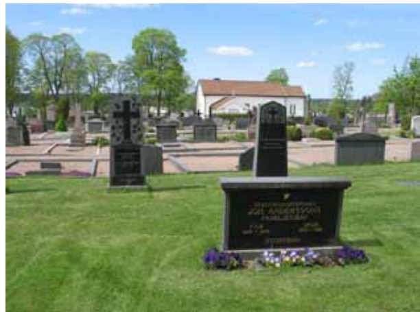
Vy över kvarter 8 mot väster med ett gräsinsått parti i förgrunden. (KI Vimmerby kyrkog 124)

På många av gravvårdarna anges den avlidnes yrkestitel vilket också berättar mycket om hur kvarteret brukats. Här finns mycket få lantbrukare och hemmansägare men desto fler titlar från andra verksamhetsfält som mer hör staden och de högre sociala skikten till. Några exempel på titlar är borgmästare, skorstensfejaremästare, stationsinspektör, magister, riksdagsman, stadssjuksköterska, rådman, stadsläkare, hovrättsnotarie, major, urfabrikör och häradshövding. Gårds-/by- eller ortnamn anges på relativt få vårdar.