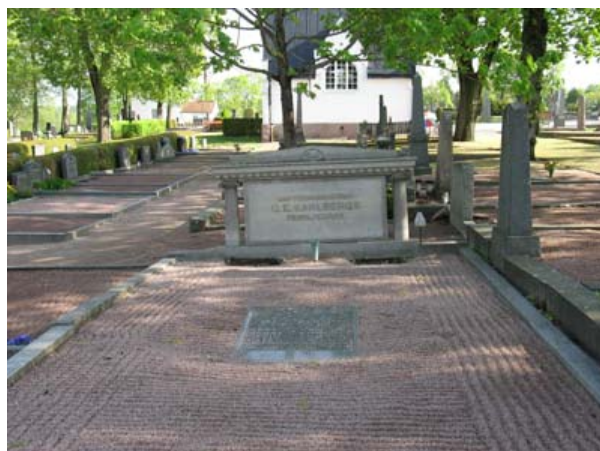
Kvarter 4 mot norr med det gamla kapellet i bakgrunden. Tydligast syns här en familjegravvård med klassicerande drag. Notera även de stora trädens rumsskapande verkan. (KI Vimmerby kyrkog 062)