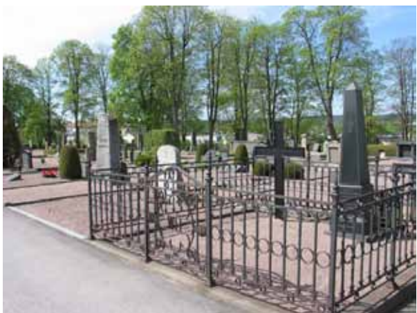
Kvarter 7 mot sydväst med ett påkostad gravplats i förgrunden med smidesstaket, obelisk och gutjärnskors. (KI Vimmerby kyrkog 097)