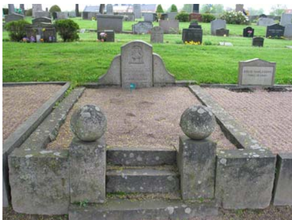
Kvarter 3 med en familjegravplats i förgrunden och rader av vårdar i bakgrunden. Här finns rester av linjegravssystem från 1930-50-talen, vilket bl a kännetecknas av de små vårdarna av svart granit. (KI Vimmerby kyrkog 056)

På många av gravvårdarna, framförallt längs gångarna och i kvarter 4 anges den avlidnes yrkestitel. Här finns uppgifter om många funktioner som funnits i Vimmerby socken. Exempel på titlar är häradsskrivare, typograf, källarmästare, köpman, droskbilägare, överläkare, stadsfiskal, stadsvaktmästare och kronojägare. Gårds-/by- eller ortnamn anges på relativt många vårdar.