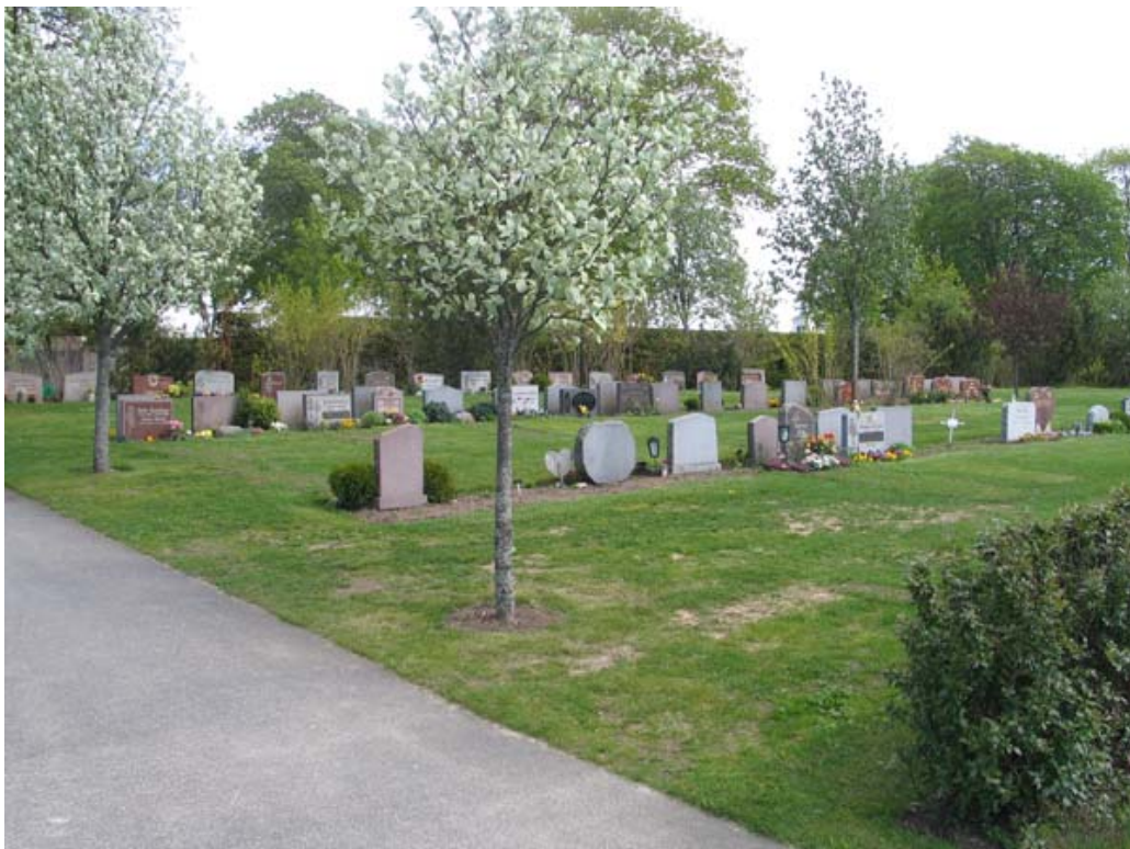
Ett parti av den nyaste delen av kyrkogården. (KI Vimmerby kyrkog 219 )

Kvarteren har en tidstypiskt anläggningsstil för det sena 1900-talet med blandad vegetation och enkla rader av vårdar. Vårdarna är här mindre variationsrika än i urngravsområdet i kyrkogårdens norra del, vilket kan förklaras av att det här rör sig om de traditionella kistgravarna.