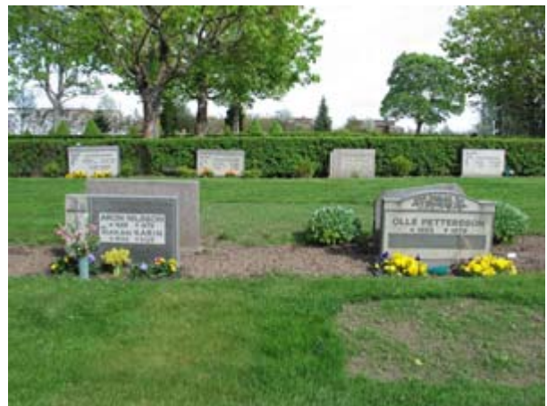
Rektangulära vårdar av grå granit dominerar och ger större delen av området ett enhetligt uttryck. Här vårdar från 1970-talet. (KI Vimmerby kyrkog 206)