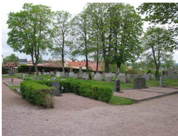
Kvarter 2 mot sydväst. Strukturen är även här tydlig med grusade större gravplatser längs gången och rader av vårdar i gräs i mitten. (KI Vimmerby kyrkog 042)