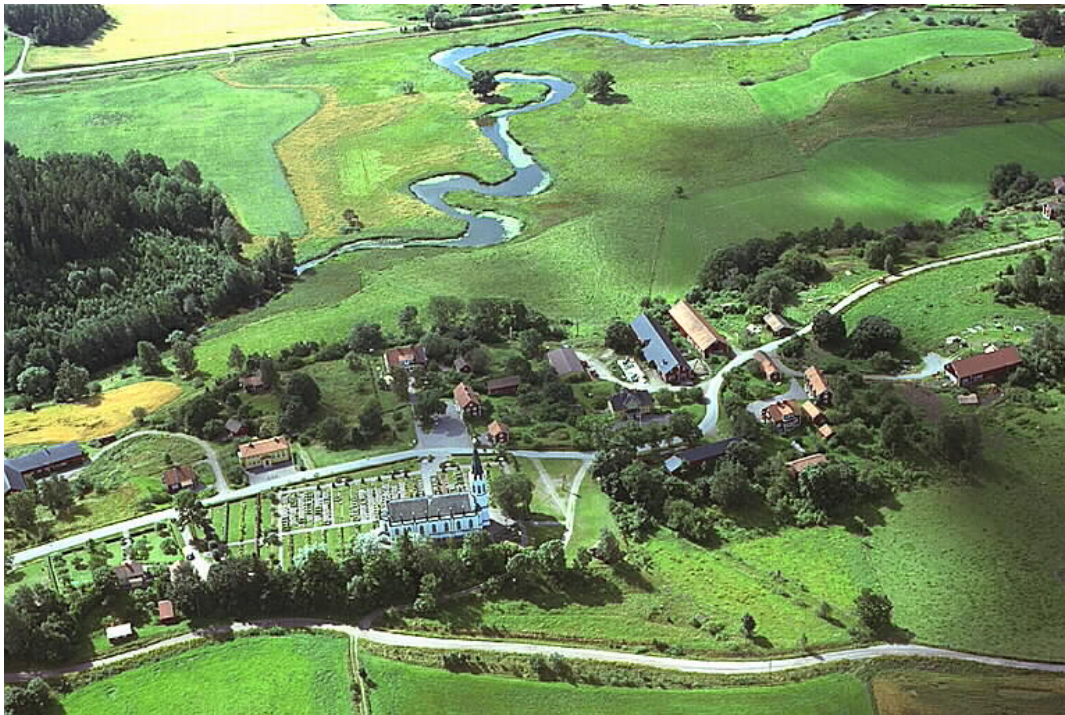
Flygbild över Gärdserums kyrka och kyrkogård tagen 1991. Framför kyrkan i norr syns trädridån som döljer stupet ned mot Könsumsvägen som löper längst ned i bild. Kyrkogårdens öppning mot söder, församlingshemmet, Prästgården och Bodsgården är betydligt öppnare.

Norr om kyrkogården stumar marken brant ned mot dalbotten och Könsumsvägen. Slutningen är skogbeväxt med blandskog. Skogsridån blockerar utsikten från kyrkogården åt detta håll.