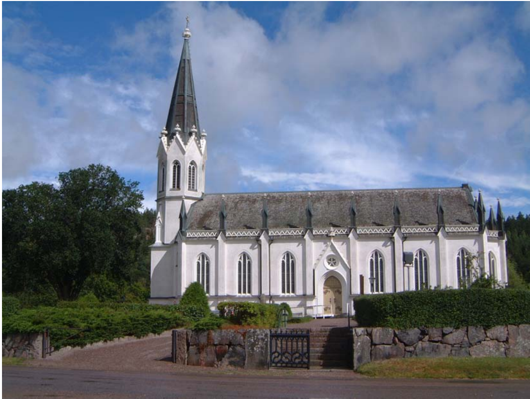
Gärdserums nya kyrka från söder.

Den gotiska stilen kommer bäst till sin rätt bland annat med de spetsbågiga dörr- och fönsteromfattningarna och de många strävpelarna som hos denna sena kyrka saknar funktion och endast är dekorativa.