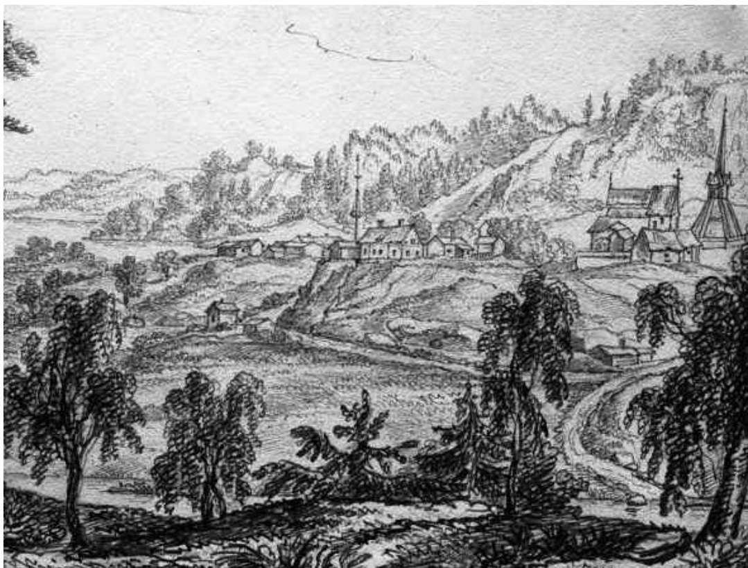
Gärdserums gamla kyrka, kyrkogård och klockstapel längst till vänster i bild på en teckning av C M Blom från 1829. Till vänster på kyrkåsen syns prästgården med en hög midsommarstång av gammalt slag. Till höger stavkyrkan med bebyggelse tätt in på.

Dessa syskon tillhörde sin tids förnämsta frälse. Filip Ulfsson var son till Ulf Karlsson, en av Magnus Ladulås förnämsta frälsemän och brorson till Ulf Fasi Jarl av Bjälboätten.