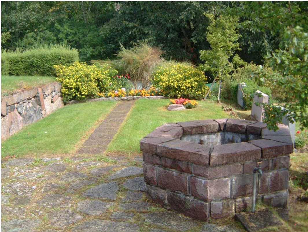
Minneslunden och brunnen från söder.

Brunnen är sexkantig och murad av natursten. Kring brunnen finns en stensättning av natursten.