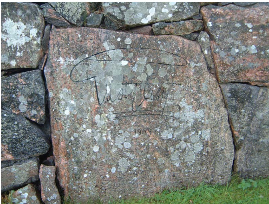
Gustav VI Adolfs namnskiffer från 1954 är inhugget i en sten i västra kyrkogårdsmuren, alldeles intill västra ingången.

Västra muren : är mellan 1 (i SV) och 3,2 m hög (i NV) på grund av åsens naturliga lutning. Längst i norr finns en garageport in i muren. Porten är dubbel och består av brunbetsade ribbor i fiskbensmönster. Över porten finns ett litet skyddstak av plåt och en modern järnarmatur.