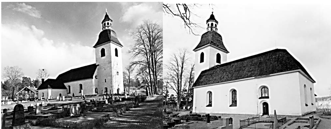
Kyrkan och kyrkogården i Grebo från N (tv) och söder (th) fotograferade 1957. Bilden visar i stort sett samma förhållanden som tidigare. Den högra bilden visar att också kvarter B haft ett antal stora grusgravar som numera är borttagna.

Närmast norr om tornet finns ett område där en del äldre vårdar bevarats. Här fanns 1935 ett par stora grusgravar som nu är borta. Bilder från 1947 som ligger ute på Östgötabilds hemsida visar i stort sett samma förhållanden.