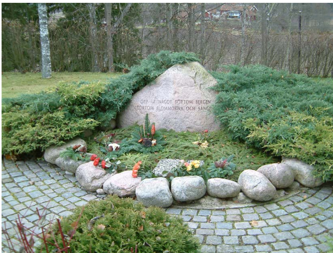
Mittstenen i minneslunden bär ett citat från Dan Anderssons "Omkring tiggarna från Luossa". "Det är något bortom bergen, bortom blommorna och sången"

1992 tillkom minneslunden i nya kyrkogårdens nordvästra hörn med utsikt över sjön.