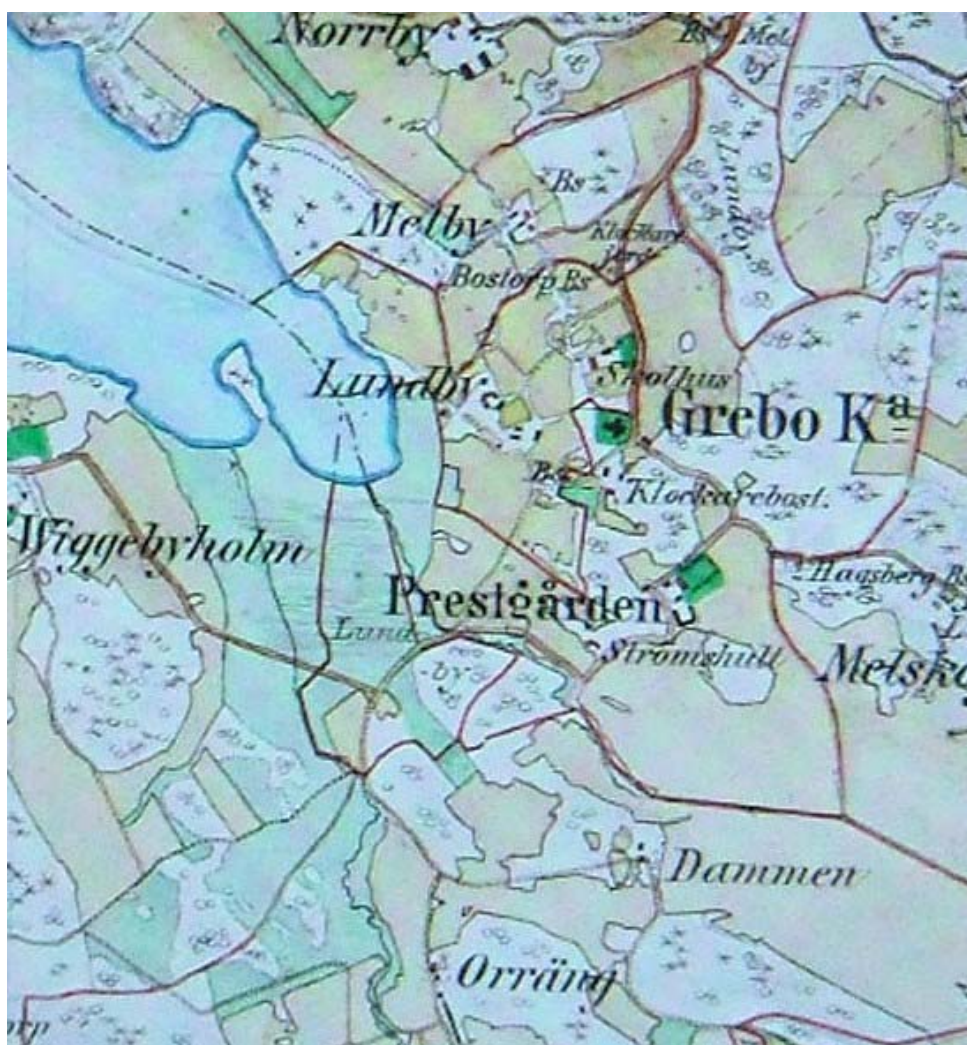
Grebo på häradskartan från 1870-talet. Observera kyrkogårdens utbredning mot norr som är betydligt mindre än idag då den sträcker sig nästan fram till skolan. Det moderna villasamhället saknas ännu.

Grebo ligger kommunikationsmässigt väl till längs de sjösystem som i äldre tider förband Linköpingsbygden med Åtvidabergsbygden och vidare mot kusten. Sjövägen har sedan kommit att ersättas av landsväg på andra sidan kyrkogården. Socknen ligger i brytbygden mellan det av öppen jordbruksmark och eklandskap präglade landskapet mot Landeryd, Vårdsberg och Linköping och bergslagsbygden mot Åtvid, Bersbo och Mormorsgruvan. En del grubbrytning har funnits inte mer än några hundra meter sydväst om kyrkan.