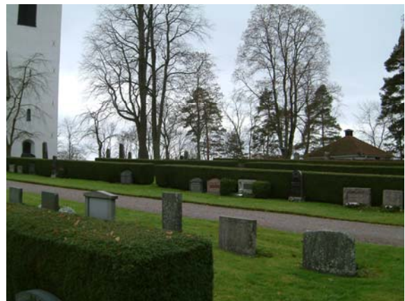
Kvarter D (bortom grusgången)