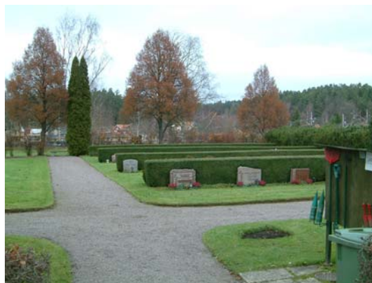
Nya kyrkogårdens västra del med minneslunden längst bort i bild. Nya kyrkogårdens östra använda del.