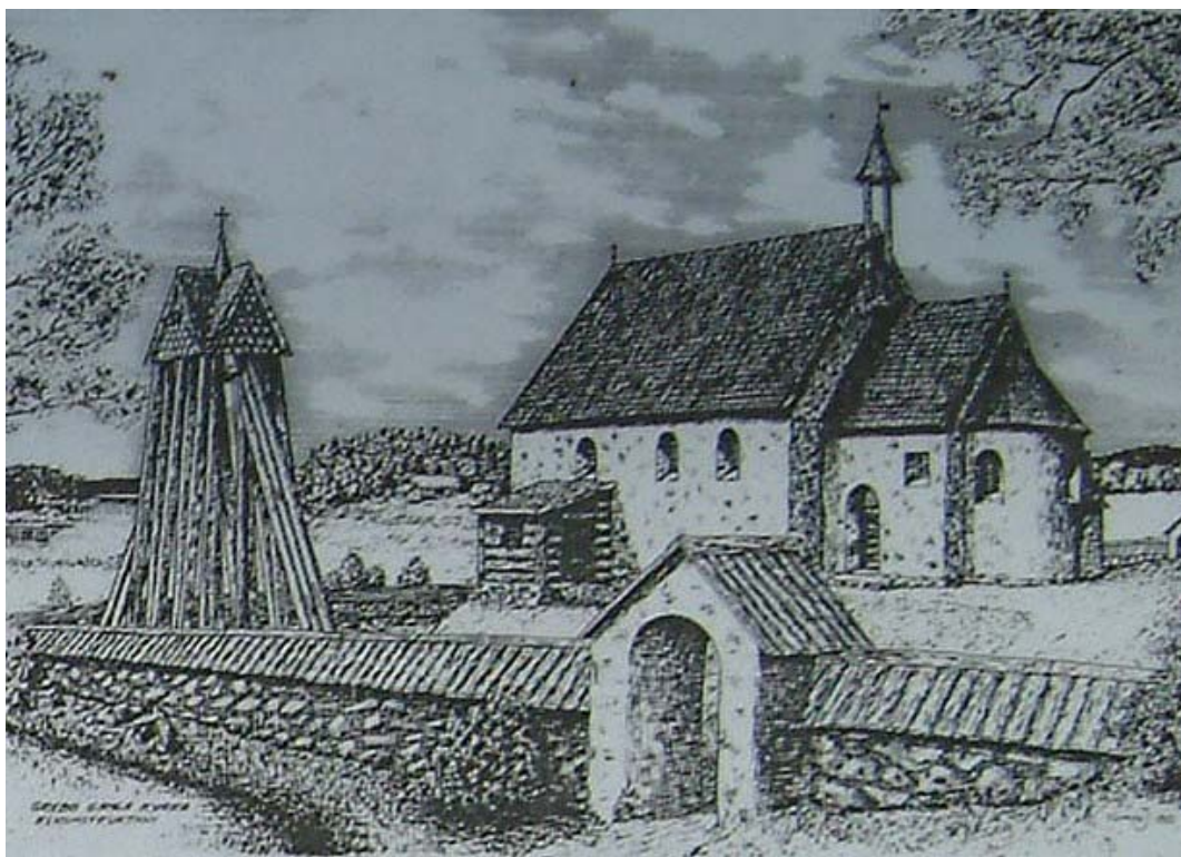
Rekonstruktion av den medeltida kyrkan i Grebo, Riksantikvarieämbetet.

Den äldsta kända kyrkan i Grebo var belägen ca 125 m SSV om den nuvarande i en kraftigt sluttande backe ned mot Erlången.