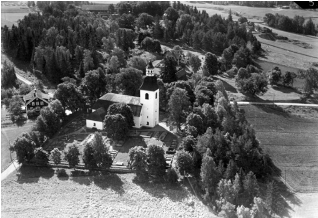
Flygbilden över Grebo kyrka 1935 visar kyrkogården före den sista utbyggnaden 1972. Trots att delar av den döljs av den numera borttagna trädkransen i norr syns större delen av den norra kyrkogården tydligt.

Bilden visar ett exempel på det tidiga 1900-talets mer ståndsuppdelade kyrkogårdar. I både kvarter C (till vänster) och kvarter D (till höger) finns större grusade gravar på rad i kvarterens utkanter medan dess inre består av gräsmattor där enklare gravar funnits.