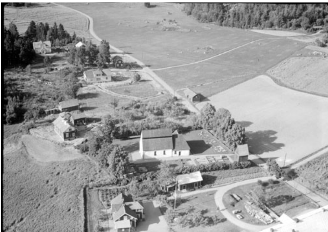
Värna kyrkogård på flygfoto från 1950. På bilden syns fortfarande en del av de äldre systemen med grus och häckgravar i södra delen av kyrkogården.