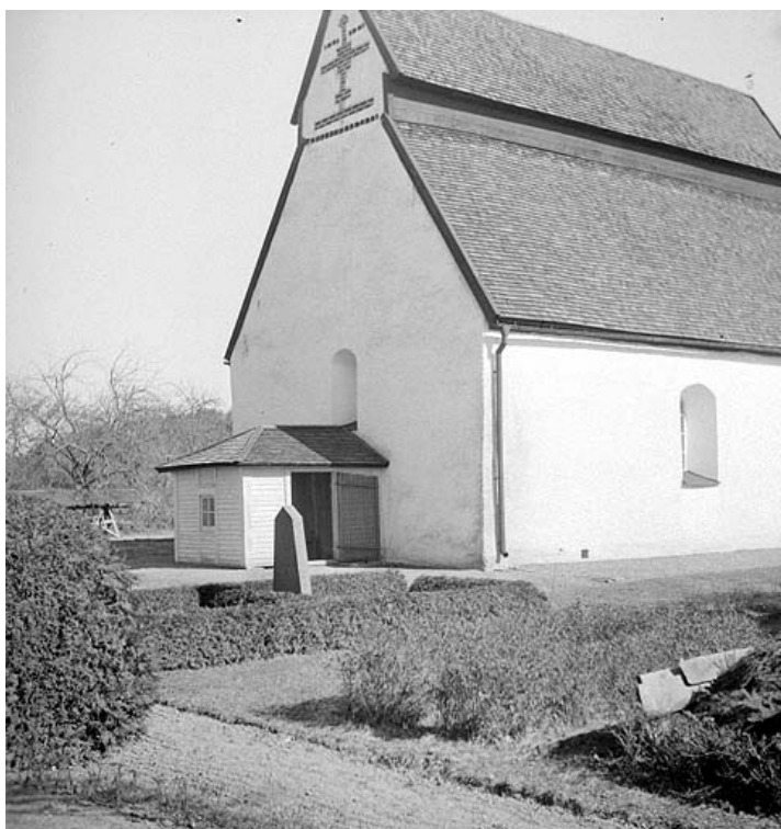
Värna kyrka 1935. Det lilla vapenhuset revs 1950. Sydväst om kyrkan syns flera av de häckomgärdade gravar som sedermera försvunnit.

Restaurering har skett bland annat 1810, 1893, 1927, 1952.