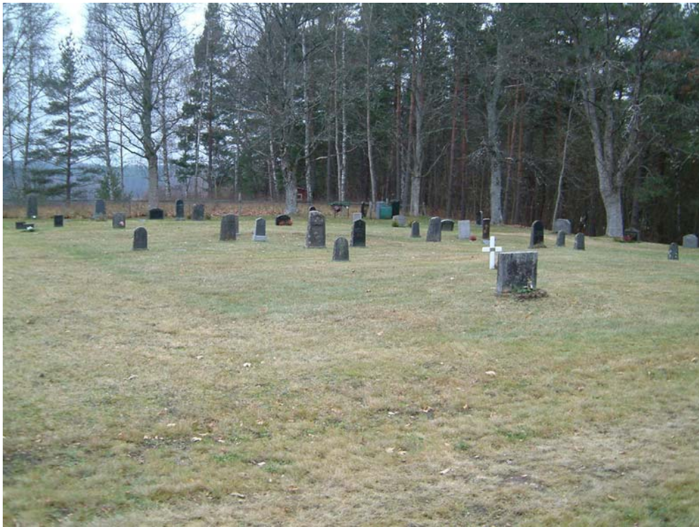
Det sydvästra hörnet av kyrkogården har störst antal originalvårdar på plats. Stenarnas ringa storlek och den glesa beläggningen gör ändå att det ser ganska tomt ut. Längst fram i bild den igensådda mittgången.