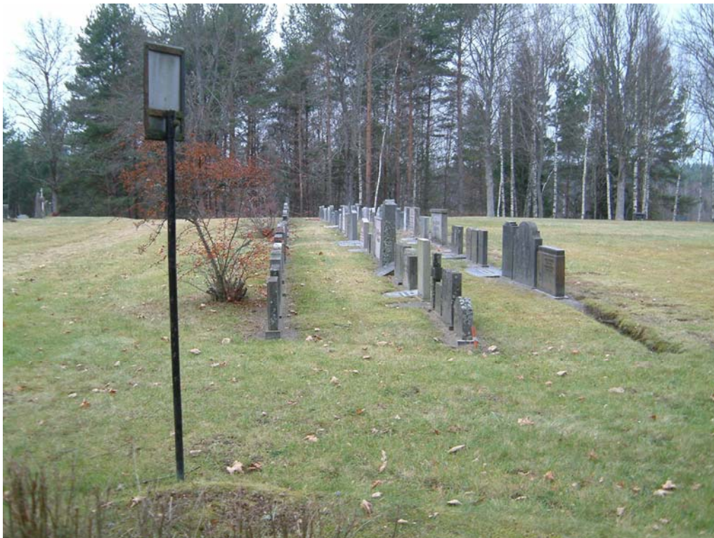
De hitflyttade gravvårdarna ställs upp på täta rader vid sidan av mittgången.