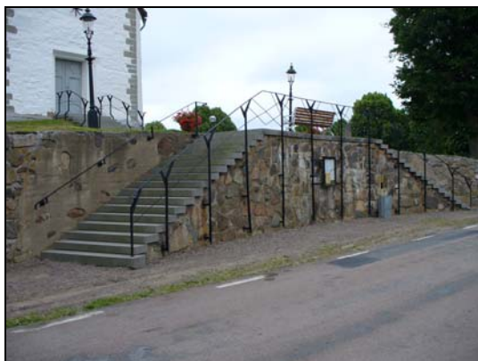
Trappa i väster.