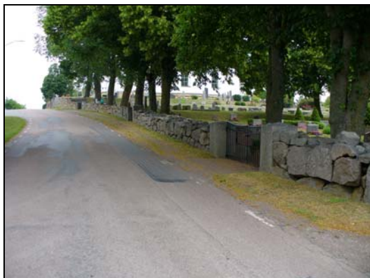
Fristående mur i väster.

Kyrkan ligger högt belägen med den omkringliggande kyrkogården delvis terrasserad i söder. Höjdskillnaderna och grusgångarna är tydliga markörer för de olika etapper kyrkogården har utvidgats. Kyrkogården omgärdas av en trädkrans utav lindar. Centralt placerad, söder om kyrkan står ett kravkapell som uppfördes 1932 efter ritningar av Erik Hahr.