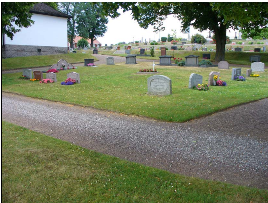
Östra delen av kvarter D, från sydöst.

Kvarteret omfattar gravplats nr D 1- 367 och ligger söder om kyrkan. Norr om kvarteret ligger kvarter C. Väster om kvarteret, utanför kyrkogårdsmuren ligger skolorna. Söder och öster om kvarteret ligger jordbruksmark, bortanför jordbruksmarken i söder löper E4;an.