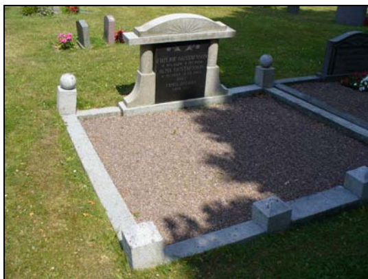
Omgärdad gravvård, gravvårdsnummer C 324,325.

I kvarteret västra och östra delar finns två områden med den så kallade allmänna linjen bevarad. I kvarterets västra del gäller detta gravvårdsnummer C 121-185. Där man bitvis kan följa gravläggningarna från 1952- 1966. I kvarterets östra del gäller detta gravvårdsnummer 247-310. Där man bitvis kan följa gravläggningarna från 1927-1948.