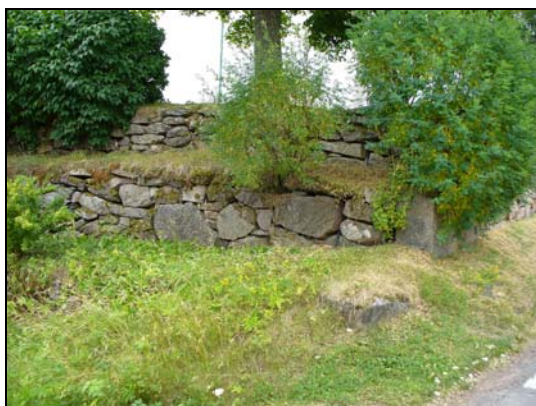
Stödmur i norr.