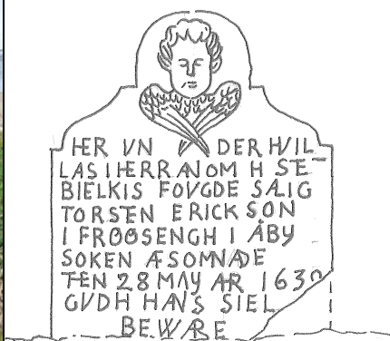
Skraffering av gravvården, Sune Ljungstet, ÖLM.