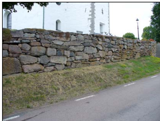
Stödmur i väster.