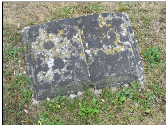
Öppen bok, gravvårdsnummer B 175, 176.