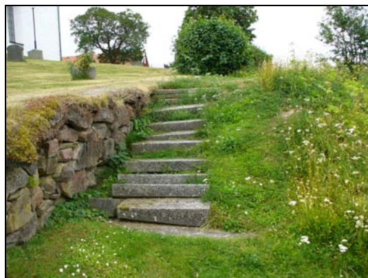
Trappa i norr.