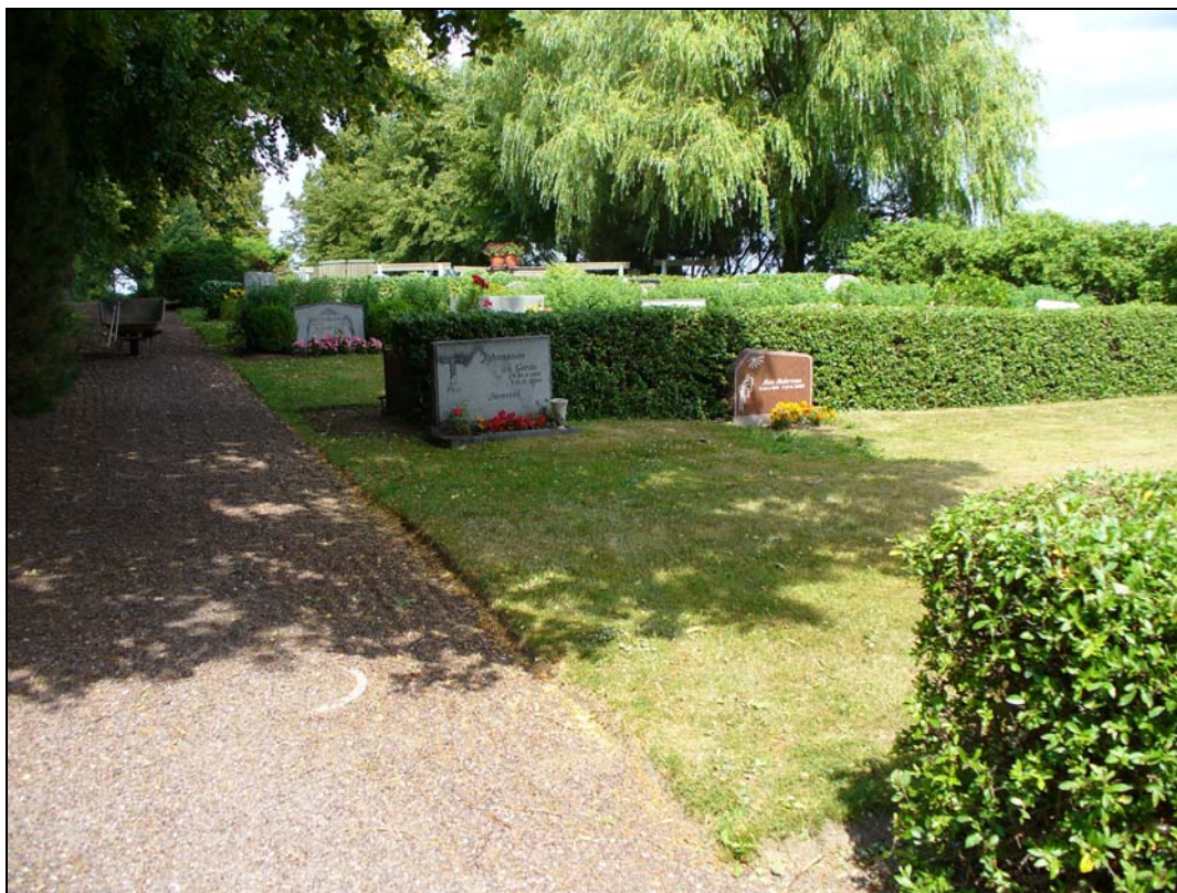
Kvarter E från söder.