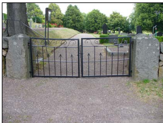
Dubbelgrind i väster, (norra).

Norr: trappa längsmed kyrkogårdsmuren. Sättsteg utav huggen granit. Trappan är tillsynes dåligt lagd och har skador.