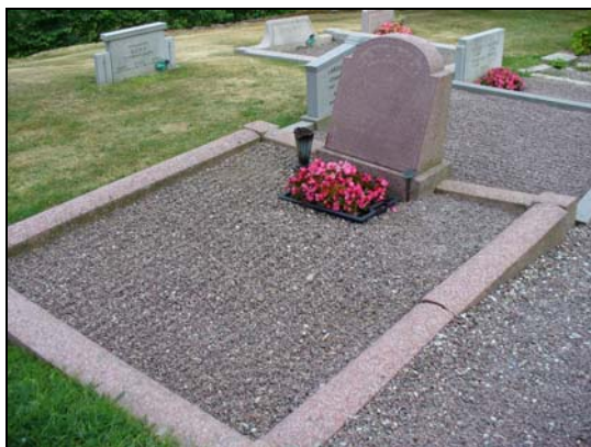
Omgärdad gravvård belagd med grus.