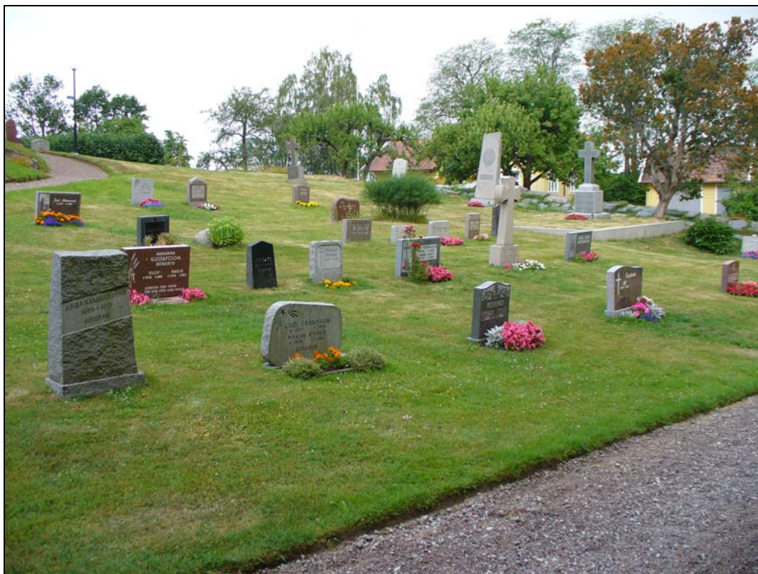
Östra delen av kvarter A.

Gravnumreringen börjar i kvarterets sydvästra del och löper sedan runt raderna av gravläggningar åt öster, den sista raden att numreras i kvarteret är den rad som ligger längsmed kyrkogårdens senaste utvidgning i öster.