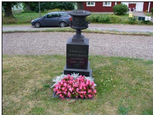
Urna i gjutjärn, gravvårdsnummer B 2,3.

I kvarteret finns flera omgärdade gravvårdar, flertalet är omgärdade med stenram belagda med grus. I kvarteret finns gravvårdar i form av kors i järn och sten, ytterligare kan nämnas de två gravvårdarna i form av öppna böcker samt en urna av gjutjärn på ett fundament av svart granit. Urnan är stämplad No 3. SKOGLUND & OLSON. GEFLE.