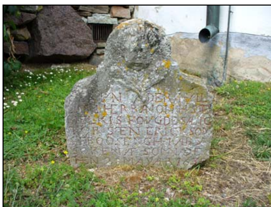
Gravvård från 163?.

Strax sydöst om kyrkan står en gravvård från 163?, gravvården är rest över Torsten Erickson. Vid kyrkogårdens nordöstra del ligger undanplockade gravvårdar.