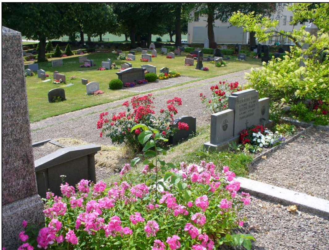
Kvarter C från nordöst, i förgrunden syns kvarter B.