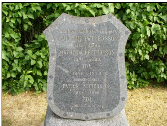
Tidstypisk gravvård från 1800-talets slut gravvårdsnummer A 14 & 32.