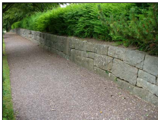
Stödmur i öster.