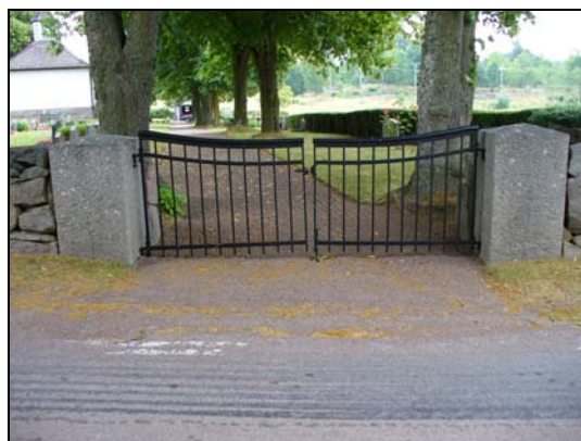
Dubbelgrind i väster, (södra).