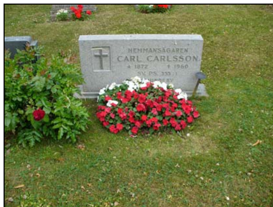
Gravvårdsnummer C 95.