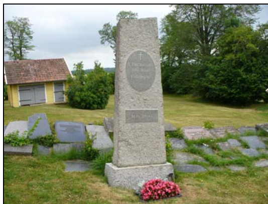
S k bautasten, gravvårdsnummer A 136.