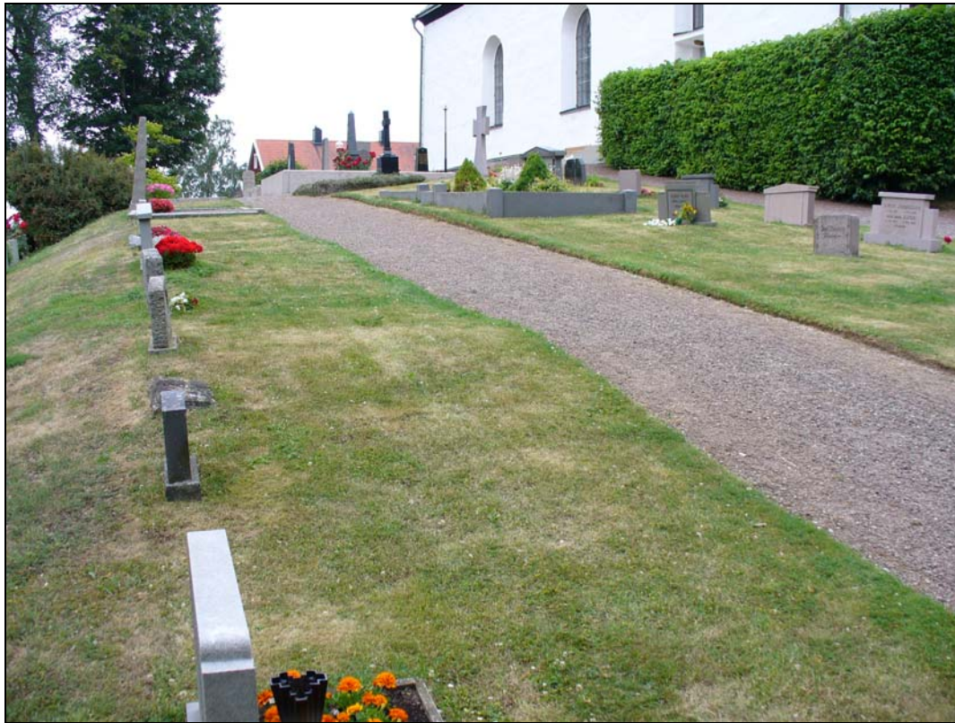
Del av kvarter B från väster.