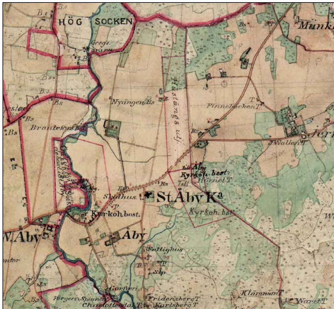
Utsnitt ur häradsekonomska kartan blad, 1868-1877.