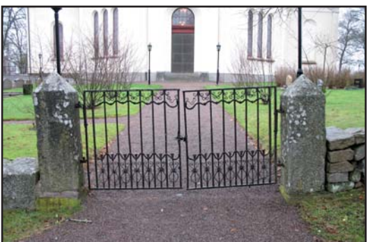
De två grindförsedda ingångarna på Öggestorps kyrkogård.