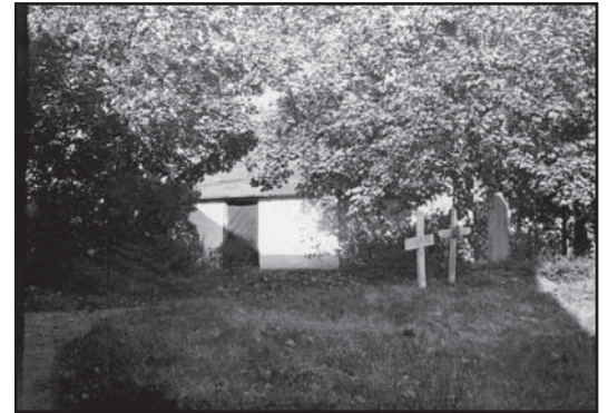
Det Ribbingska gravkoret anno 2006 och 1912.