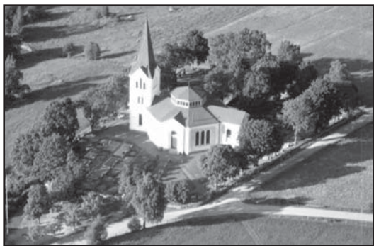
Flygfotot från 1951 visar kyrkogården omgärdad av en lummig trädkrans.

Kyrkan ligger centralt placerad på den rektangulära kyrkogården som är en relativt typisk landsortskyrkogård. Den är präglad av efterkrigstidens formspråk med stora gräsytor delade av grusgångar. Längs kyrkogårdsmuren och söder om kyrkan finns större och mer påkostade gravvårdar, i många fall i kombination med grusbädd och stenram. Norr om kyrkan finns flest moderna gravvårdar, här finns även ett fåtal gravvårdar som skulle kunna härledas till allmänna linjen. Intressant är att Ribbingska gravkoret finns på kyrkogårdens norra del. Historiskt sett har den norra sidan om kyrkan, på grund av vidskepelse, ansetts sämre än övriga.