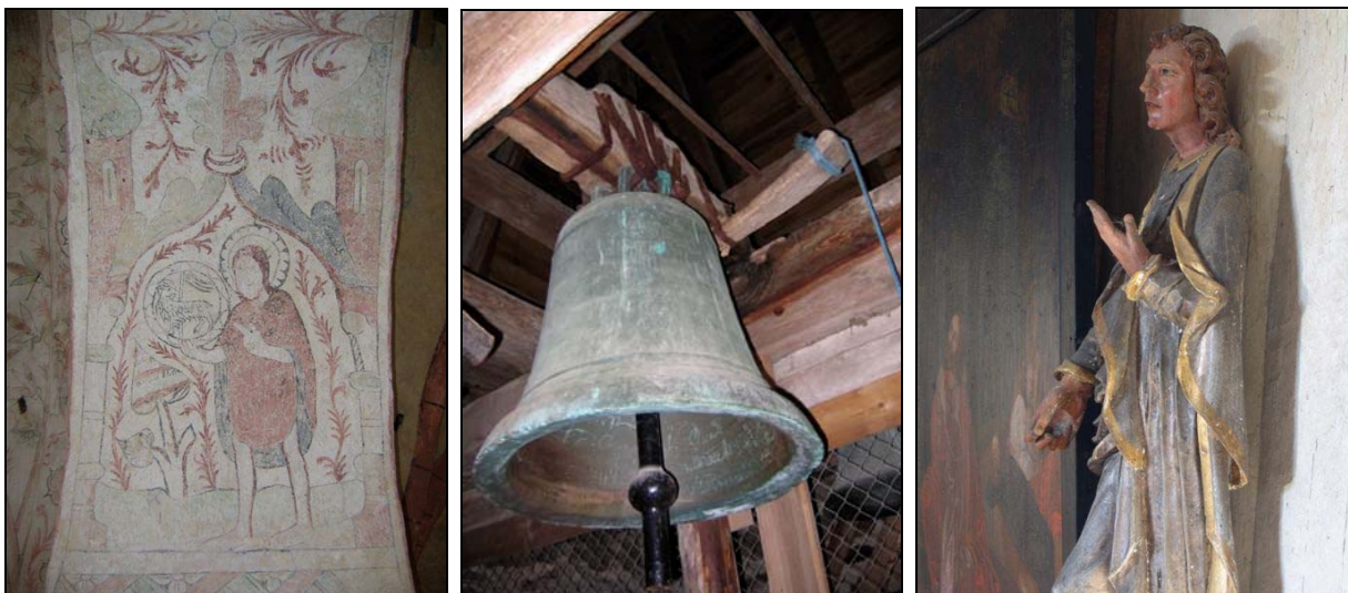
Kalkmålning i triumfbågen från 1400-talet, medeltida klocka och skulpterad Johannes från 1600-talet som ursprungligen stött i Brahekyrkan.

Kyrkan saknar bänkinredning samt orgel. Bänkinredningen har ersatts av lösa stolar som är stapelbara och som tas fram vid behov. En kororgel har funnits tidigare men klarade inte av kyrkans klimat och togs därför bort.