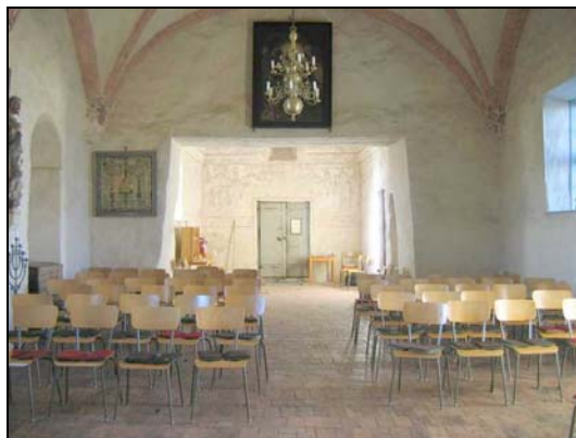
Det mekaniska urverket (numera ej i drift), altaret av Johan Werner d.y från 1600-talet, framtagna 1600-tals dekoration vid valvribbornas skärningspunkter i långhuset, samt vy av långhuset och tornrummet mot väster.