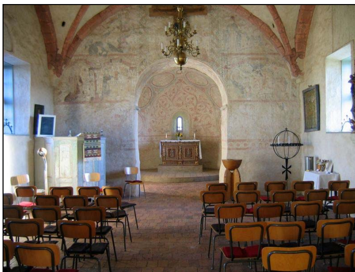
Interiör, vy mot koret i öster.

I interiören märks främst kalkmålningarna från 14- och 1600-talet. Tornkammaren är tunnvalvd med kalkmålningar från 1400-talet i valvet och på västra väggen. På östra väggen i gavelfältet ovanför öppningen mot långhuset finns bevarade dekorativa 1600-talsmålningar. Långhuset är uppdelat i två travéer med kryssvalv, i valvribbornas skärningspunkter finns målade 1600-tals dekorationer. I koret och i absiden är både väggar och valv täckta med 1400-tals målningar. Målningarna är i olika grad välbevarade men huvudsakligen framtagna och ifyllda vid restaureringen 1922.