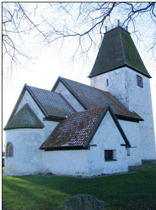
Kumlaby kyrka sedd från nordost.

Sadeltaket över långhus och kor och absid är lagt med tjärat träspån, likaså tornetaket. Tornspiran avslutas upptill av en altan, upptagen under 1600-talet då kyrkan togs i bruk som skolbyggnad. Sakristians tak är däremot lagt med tegel.