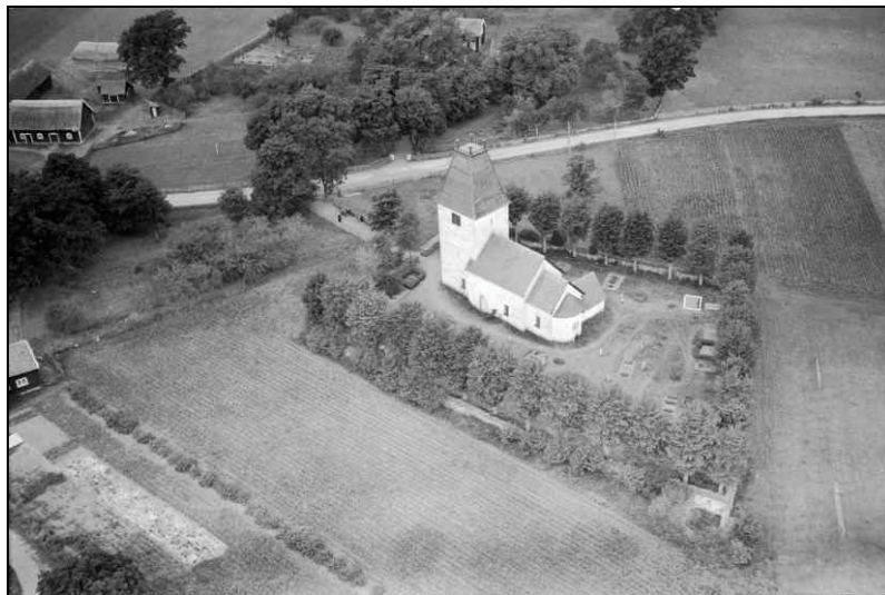
Kumlaby kyrka fotograferad från luften 1937 av Oscar Bladh. ATA.

Kumlaby kyrka ligger i Visingsö socken, vars huvudkyrka är Brahekyrkan från 1636. I nära anslutning till Brahekyrkan, (ursprungligen kallad Ströja kyrka) ligger grevarna Brahes Visingsborg, uppförd på 1500-talet och på öns södra spets ligger resterna av Näs, kungaborgen som idag är Sveriges äldsta profana byggnadsverk. Visingsö socken omfattar ön som ligger i Vätterns södra del.