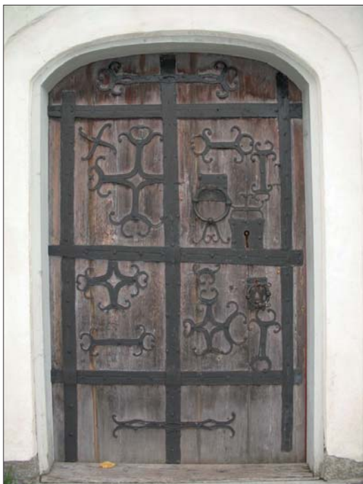
Dörr till kyrkan, vapenhuset, med medeltida smidda detaljer. Smidesdetaljerna är dock sekundärt ditsatta, troligen efter brand. .

Nästa stora renovering blir 1996 då bänkarna får ny färgsättning på rygg- och sittbräda, koret görs större genom att korbänkar tas bort, altaret skiljs från altartavlan genom att flyttas fram och boaseringen i koret tas bort. Även golvet förnyas i mittgång och kor. Vid denna rapportens färdigställande 2007 planeras en återgång till vapenhusets tidigare panelklädsel, mycket på grund av problem med putsens dåliga hållbarhet.