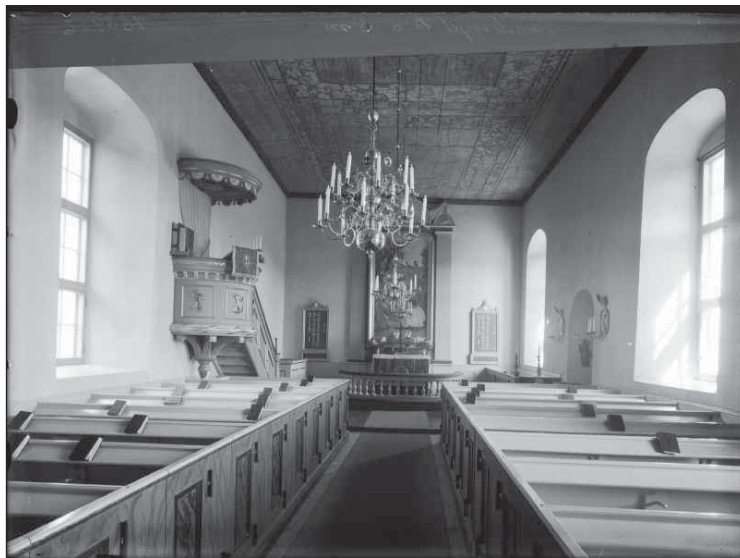
Sandseryds kyrka fotograferad efter renoveringen 1936.

äldre bänkdörrar finns bevarade på vinden med ursprunglig färgsättning kvar. Istället för glasmålningen i korfönstret sattes en altartavla in, målad av Georg Pauli. Ytterligare en stor förändring som renoveringen 1936 ledde till var att det gamla innertaket från 1706 togs fram - med de därunder bevarade takmålningarna. Målningarna och kompletterades till viss del av konservatorer men endast så försiktigt att man inte förvanskade något av det ursprungliga. Som ett exempel på hur takmålningarna hade kunnat se ut i ursprungligt skick utförde konservatorn Sven Wahlgren ett exempel på detta i vapenhuset. Dessa är nu övertäckta.