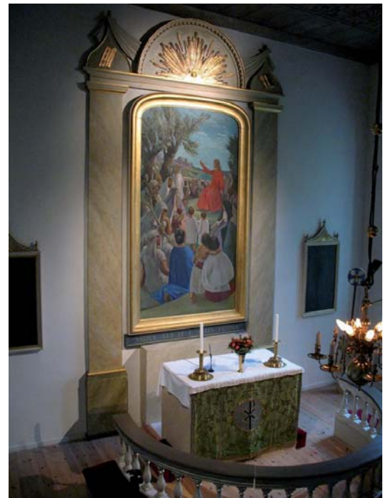
Altartavlan av Georg Pauli, inramad av en tidigare fönsteromfattning från 1800-talet.