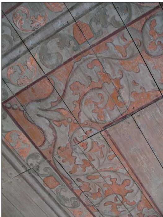
Ovan och överst: takmålningarna av okänd mästare från 1706 ger ännu en bra föreställning om hur de en gång såg ut. Överst till höger: orgelläktaren bärs upp av smidda stöttor.