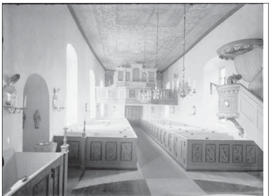
Koret så som det såg ut efter 1908 års renovering. Foto: Paul Boberg vid 1940-talets början. ATA.