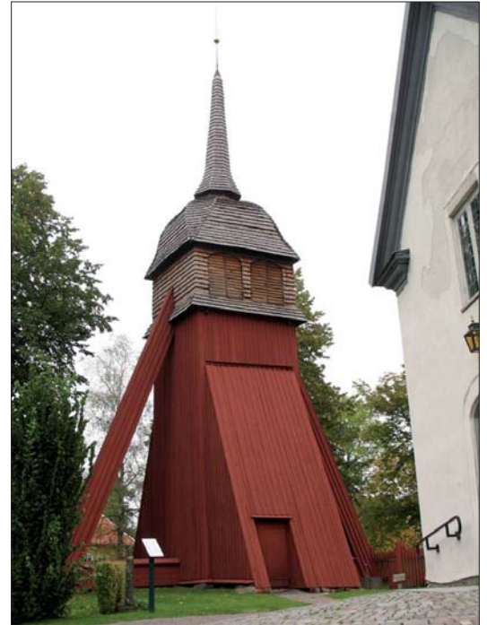
Klockstapeln har funnits sedan åtminstone 1700-talets slut då första kända uppgifter om reparationer på den finns. .