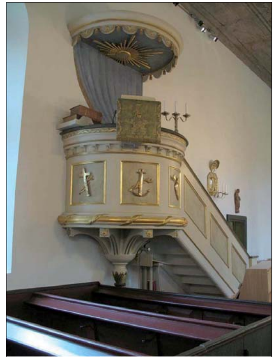
Predikstolen. Uppgifterna går isär men troligen är den från 1820.