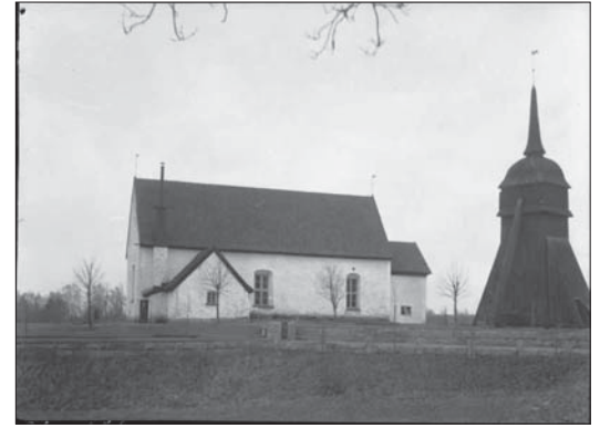
Ovan och till vänster: Sanderyds kyrka före renoveringen 1936. Lägga märke till interiören med glasmålning i koret, listverk i taket, äldre bänkar och takbården. Foto Bertil Berthelson 1934, ATA.

omfattande omputsning av hela kyrkan 1994. Fönsteromfattningen har gotisk spetsbågeform, vilket innebär att den troligen kom till tidigast under 1300-talet. Möjligen har kyrkan föregåtts av en äldre kyrka i trä. Någon gång har den dessutom utvidgats mot öster, i full bredd, något som också syntes tydligt i murverket vid den tidigare nämnda omputsningen 1994.