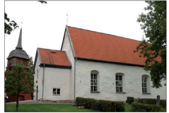
Ovan: Sandseryds kyrka, vy från söder med klockstapelns i bakgrunden. Till vänster: Interiör mot koret.

Måleriet i taket är troligen från 1706 då kyrkan på nytt uppfördes efter en brand. Måleriet togs fram vid renoveringen 1935 och består av fyra tavlor med bibliska motiv, inramat av akantusslingor. Måleriet restaurerades och till viss del kompletterades vid framtågandet. Mot väggarna avgränsas det platta brädtaket med en enkelt avfasad kantbräda. Väggarna är slätputsade i en svagt gulbruten vit kulör. Bänkkvarteren är slutna med grönmarmorade gavlar och dörrar med ljusbruna spegelfält. Dörrarna är nya men tillverkade och utformade efter de äldre dörrar som hittades i trossbotten vid renoveringen 1935. Föregångarna ligger på vinden med äldre ljusgrå bemålning. Golvet i bänkkvarteren är ett rödtonat furugolv. Golvet i koret och mittgången är yngre och är lagt av ljus, fernissad men opigmenterad furu.