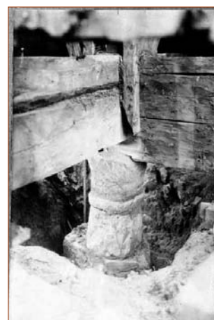
En av de medeltida grundstenar som klockstapeln vilar på.

Klockstapeln är belägen något sydost om kyrkobyggnaden. Den är av en klockbockstyp med inklädd huv och brädfodrade ben. Klockstapeln är rödfärgad med ljusmålade ljudluckor, huv och spiran är spånklädda och tjärade. Det finns inte särskilt många källor som berättar om stapelns tidiga historia men från 1600-talet finns noteringar om att det finns en klockstapel vid kyrkan. I början av 1700-talet befinner sig klockstapeln i dåligt skick och är i behov av reparationsåtgärder, huruvida detta genomfördes är oklart men 1763 skedde en stor om- nybyggnad av klockstapeln. Alltsedan dess har enbart skett vård- och underhållsåtgärder av klockstapeln, vid en större reparation 1919 gjordes en större undersökning av stapelns grund varvid det upptäcktes att grundstenarna har en märklig form och sannolikt är av hög ålder. De senaste större åtgärderna av klockstapeln skedde 1993 då