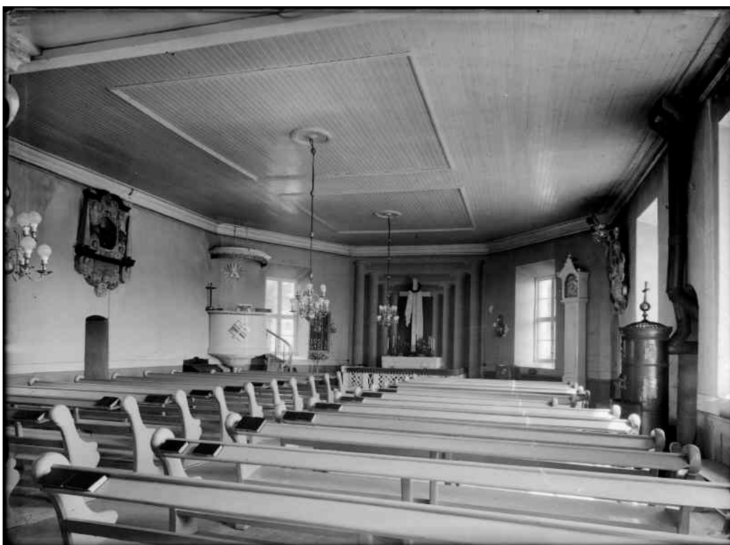
Interiörbild mot öster visar koret illusionsmåleri samt den öppna bänkinredning som tillkom vid 1880-års arbeten. Foto Nils Åzelius 1936.

fick ny uppvärmning genom att två kaminer installerades i sakristian och långhuset. I koret gjordes ett dekorativt måleri i form av en kolonnuppställning. Kyrkans orgel från 1836 ersattes 1900 med en ny