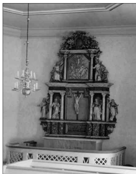
Altaruppsatsen efter att den konserverats och monterats i kyrkan. Foto från 1940 (beskuret).

Fram till 1974 gjordes, med undantag från att orgelverket ersattes med ett nytt tillverkat av orgelbyggare Troels Krohn, enbart arbeten av underhållskaraktär. Sedan följde en exteriör restaurering efter program av Ingmar Holmström Restaureringsteknik. Vid restaureringen putslagades fasaderna och avfärgades med kalkfärg, sockeln