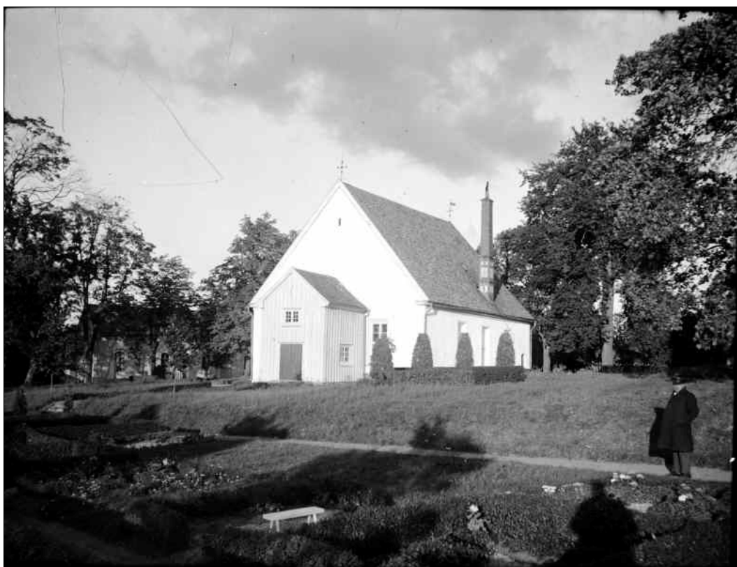
Kyrkan mot sydväst fotot är taget 1935 men fotografen är okänd.

De äldsta delarna i den nuvarande kyrkobyggnaden uppfördes sannolikt någon gång kring 1200-talets mitt men då området haft en betydande ställning redan innan dess är det inte omöjligt att denna föregåtts av en tidigare träkyrka. Den ursprungliga stenkyrkan hade en rektangulär planform och rektangulärt kor och på 1400-talet valvslogs kyrkan med två kryssvalv och under 1600-talet togs fönster upp i den norra fasaden. 1746 gjordes en stor utvidgning av kyrkan där långhuset förlängdes med omkring 3,5 meter och koret förlängdes samtidigt som det fick en tresidig form. Vid ombyggnaden återanvändes delar av takkonstruktionen.