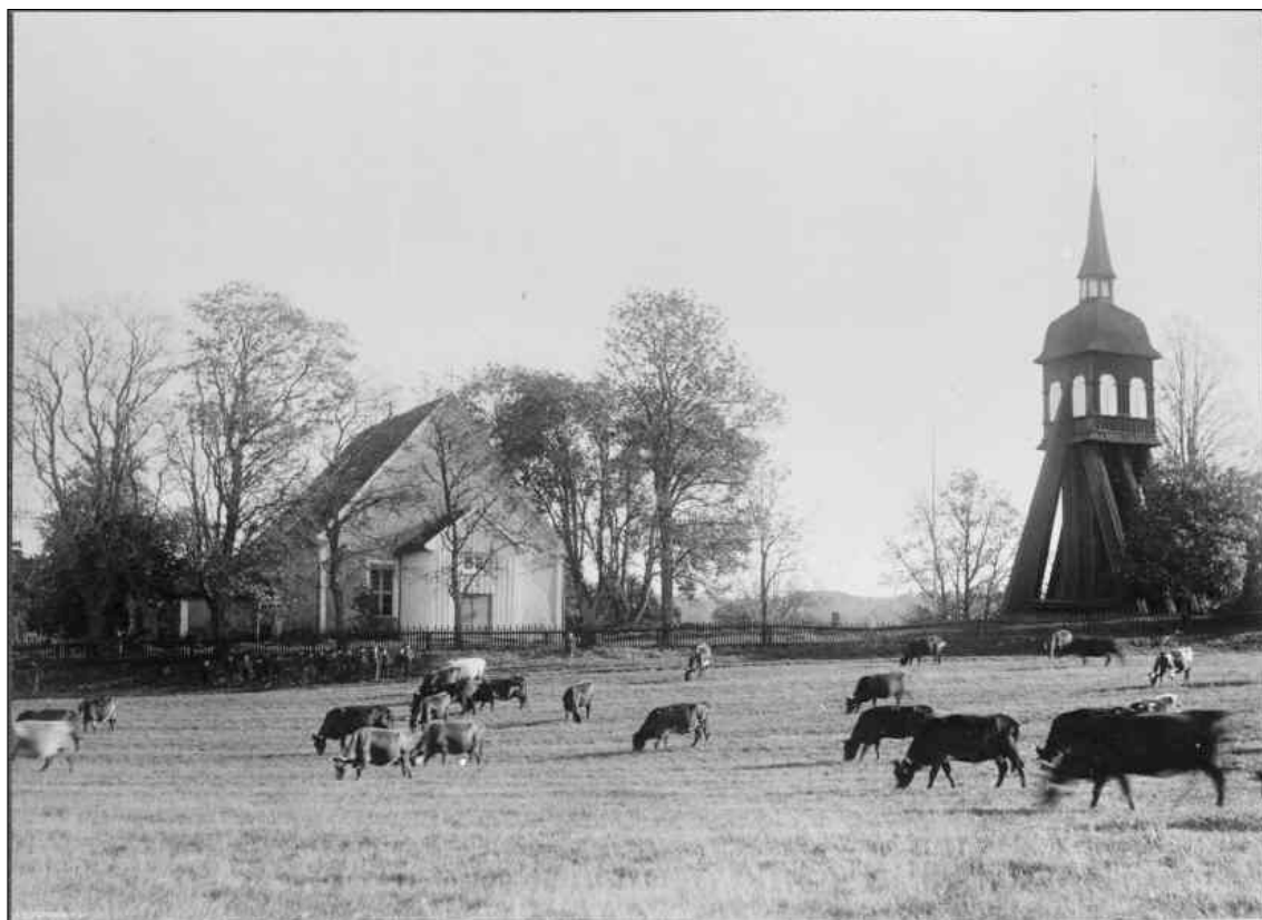
Vy mot väster över kyrkan visar hur landskapet tidigare dominerats av jordbrukslandskap. senast omkring 1910.

Ljungarum har en lång historia där lösfynd visar att området haft mänsklig aktivitet redan för omkring 5000 år sedan. Fast befolkning kan härröras till bronsåldern då det finns omkring 15 kända bronsåldersgravar inom socknen, de flesta av dessa har under 1900-talet borttagits. Fram till slutet av 1200-talet då Jönköping erhöll sina stadsprivilegier av Magnus Ladulås var Ljungarum den mest betydande platsen med den största befolkningkoncentrationen men från denna punkt kom dess betydelse att sjunka till förmån för det kommande Jönköping. Kyrkan utgjorde fram till 1900-talets mitt sockencentrum och omgärdades av spridda gårdar men med att Jönköpingsdalens expansion har kyrkan kommit att omgärdas av bostadsbebyggelse. Kyrkobyggnaden ligger på en höjd och är till delar från mitten av 1200-talet, invid kyrkan finns en klockstapel från mitten av 1700-talet. Kyrkogården har utvidgats i omgångar och karaktäriseras av gräsytor med löv- och barrvegetation och har en avtrappande höjdkurva och omgärdas av ett spjälstaket.