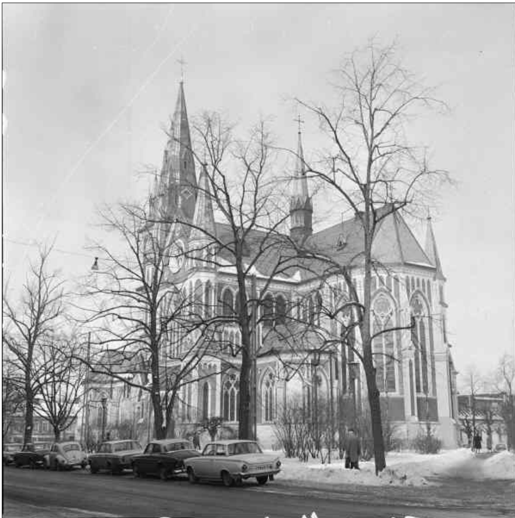
Exteriörbild taget efter den stalinska restaureringen. Även om bilden är svartvit så syns den kontrastverkan som Stalin eftersträvade tydligt. Foto Axel Unnerbäck 1968.

Den interiöra restaureringen följdes 1960-61 av en exteriör restaurering. För åtgärdsprogrammet stod arkitekten Lars Stalin i Jönköping som utarbetade tämligen omvälvande förändringar av kyrkan. Arbetena omfattade en omspikning av de skiffertäckta takytorna samt reparationer av tornspiran. Kyrkans takavvattningsystem ersattes med ett nytt. Fasaderna sågs över och reparerades med puts som infärgades i en tegelröd kulör. Ornamentik och putsytor målades sedan med färgtypen Cemcol som var tänkt att erbjuda fasaden ett skydd som likställdes med plåt. Vid den västra ingången gjordes ny dekorationsmåleri i sgraffitoteknik, måleriet utfördes av den italienska stuckatören Riccardo Reazzole. Stalin gav exteriören en mycket skarp färgskala med vilket han vill betona de plastiska formerna och stärka det gotiska uttrycket. För detta mötte han stor kritik där många ansåg att kyrkan nu lyste ilsket och kändes helt främmande. Under 1960-talet gjordes även mindre förändringar av orgelfasaden i samband med att nya pipor installerades av Åkerman & Lunds nya orgelfabrik.