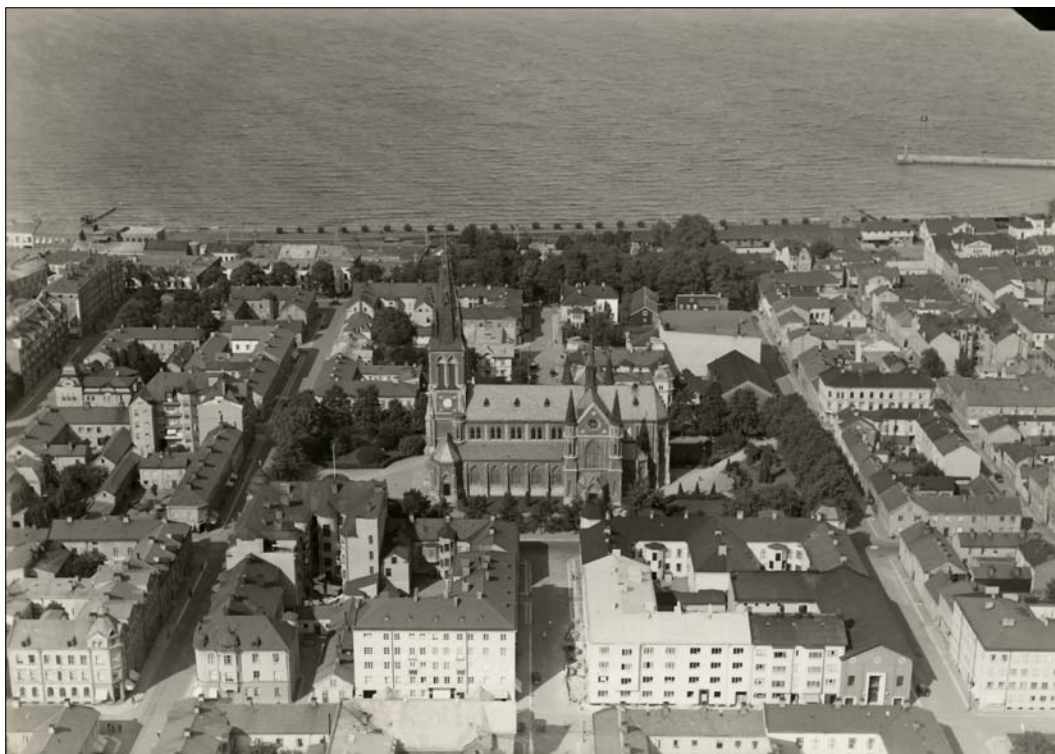
Flygfoto över Sofia kyrka.

Lokaliseringen av kyrkan var föremål för en lång debatt, inledningsvis avsågs kyrkan uppföras ungefär där nuvarande Per Brahegymnasiet är beläget men det slutliga valet blev att bygga kyrkan vid det nya salutorget som i sin tur fick flytta till det nuvarande Västra torget. Kyrkan ligger omgärdad av en mindre tomtyta med stadsbebyggelsen direkt inpå kyrkotomten. Parkmiljön definieras av grönytor med lövträd och kyrkan utgör ett karaktärskapande landmärke i stadsmiljön.