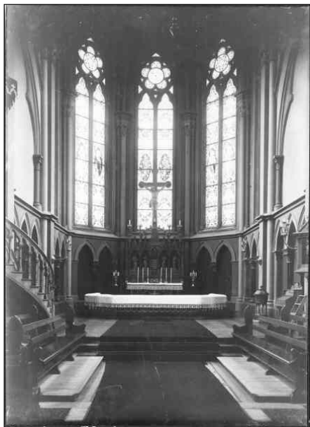
Vy över koret med Glasmålningarna från 1891. Foto taget av Alfred Edle, okänt datum.

Kort efter det att kyrkan färdigställtts erhöll den sina glasmålningar. Dessa föreställer de heliga sakramenten och apostlarna Petrus och Paulus samt profeterna Moses och Elias. Vidare uppvisar fönstren en rik växt- och blomsterornamentik. Glasmålningarna utförde i München av den välrenommerade glasmåleriateljén F X Zettler, firman var en av de största företagen med verksamhet både i Europa som i Amerika. I början av 1900-talet tillkom dopfunten som är skuren i ek av folkskoleläraren D. Lindahl i Kosta.