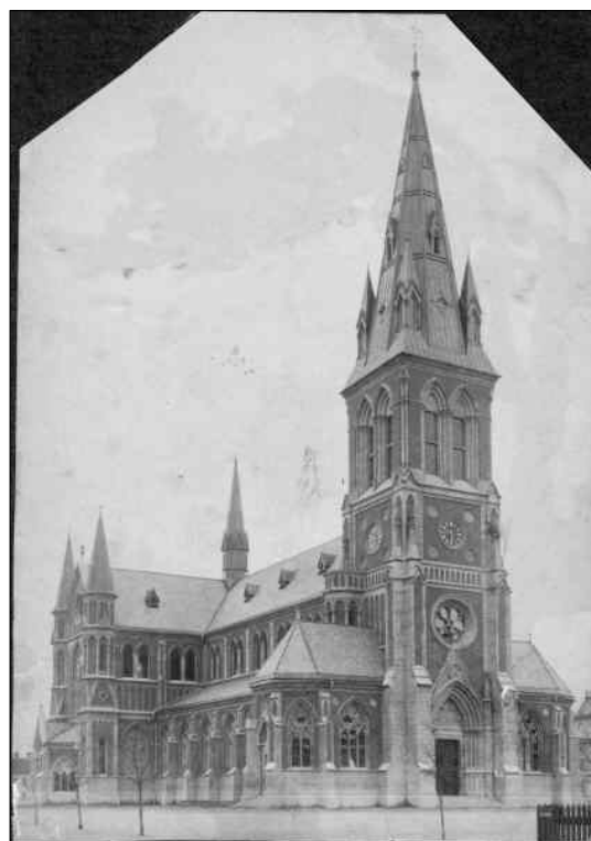
Ett tidigt foto av kyrkan. Träden i den omgivande parken är ännu små och späda. okänt datum.

1800-talet hade bebyggelsen trängt utanför 1600-talets stadsplan och sträckte sig nu mot väster som kommit att kallas Västra förstaden och slottsförsamlingen eller västra församlingen kom att bli trångbodda i Slottskapellet. 1859 beslutades att en ny kyrka skulle byggas men det beslutet skulle komma att dröja innan det genomfördes. År 1880 återuppväcktes frågan och kyrkans lokalisering diskuterades. Inledningsvis bestämdes att den nya kyrkan skulle uppföras i närheten av nuvarande Per Brahegymnasiet och den intilliggande gatan gavs därför namnet Kyrkogatan. När platsen var vald utlystes en arkitekttävling till vilken det inkom fem förslag som skickades till Överintendentsämbetet i Stockholm för godkännande. Alla förslag kom dock att förkastas av ämbetet vilka istället uppdrog en av sina egna arkitekter att utarbeta ritningar för den nya kyrkan.