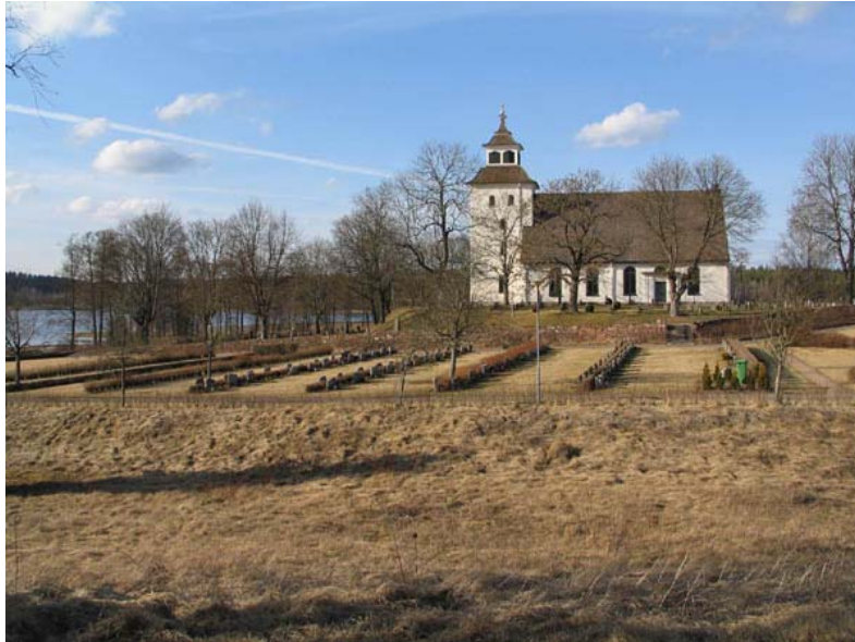
Kvarter G-T (U) från söder. (KI Järeda 0070)