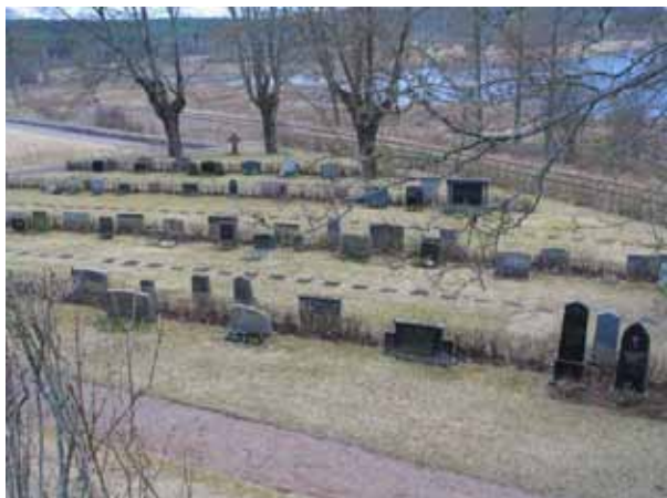
Kvarter E från nordväst. (KI Järeda0079)

man kommer. I raden längst österut som löper längs grusgången varierar gravvårdarnas utseende mycket. Höga och låga avlöser varandra. I raderna längre österut dominerar mellanhöga gravvårdar av 40-tals till 70-tals typ vilket ger dessa rader ett mer enhetligt uttryck. Längst ut i sydväst står ett ensamt större stenkors. De allra flesta gravvårdar är av grå eller svart granit. Många av gravvårdarna har titlar och ortnamn angivna, speciellt gäller det de äldre gravvårdarna.