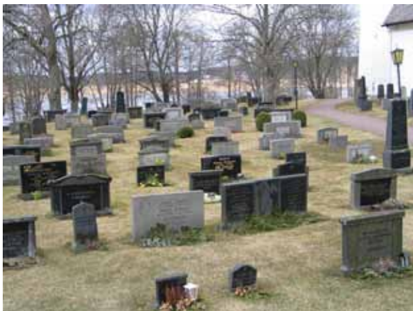
Kvarter C från ost. (KI Järeda 0100)

Gravraderna sträcker sig i nord-sydlig riktning i ganska täta rader. Från huvudgrinden ger området ett mycket enhetligt intryck med sina rader av mestadels mellanhöga vårdar medan gravvårdarna blir något mer varierade ju längre väster ut man kommer. Samtliga gravvårdar står i gräsmattan, en del med möjlighet till liten plantering framför. Karaktären av linjegravar finns delvis kvar, speciellt i de allra västligaste delarna. Kvarteret omges av kyrkogårdsmur i söder och slänten med häck av syren i väster samt del av den gamla trädkranen av ask och lönn. En stor lönn står också mitt i kvarteret.