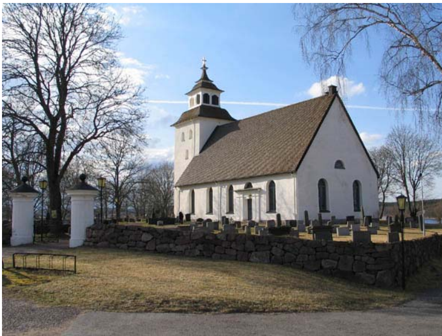
(KI Järeda 0066)

Järeda församling Linköpings stift Kalmar län