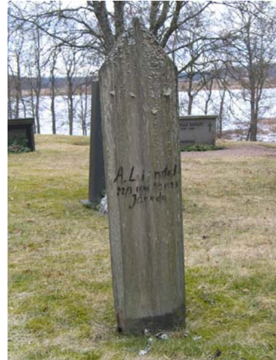
Den enda bevarade "trästaven". (KI Järeda 0106)