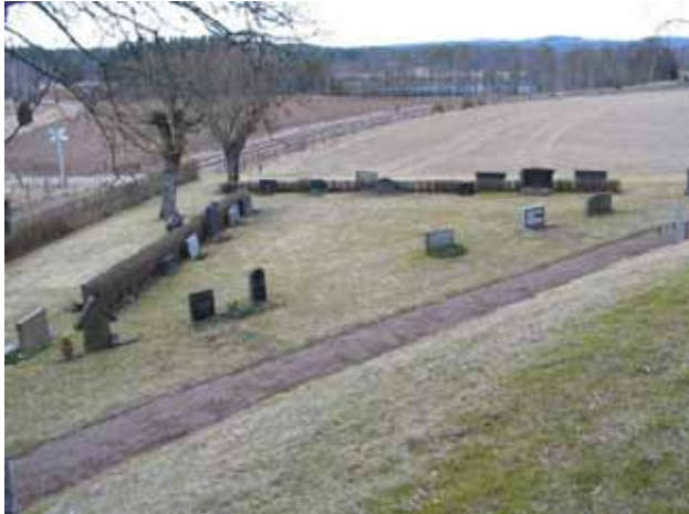
Kvarter E från sydost. (KI Järeda 0081)