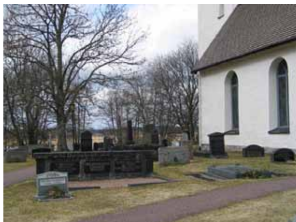
Kvarter B från sydost. (KI Järeda 0098)