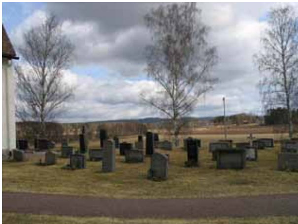
Kvarter A från söder. (KI Järeda 0095)

Gravvårdarnas ålder varierar starkt. Enstaka finns från 1880-talet, men merparten är från 1920-talet och fram till idag. De flesta gravvårdar är av grå eller svart granit, merparten mellanhöga, men några högre. Förutom ett fåtal grusgravar, A ca 108-110, A ca 111-114, A ca 115, A ca 116-18 och A ca 67-69 och är övriga gravar omgärdade av gräs, i många fall med möjlighet till liten plantering framför. Två liknande gravstenar utmärker sig särskilt i sin annorlunda form, A 133 från 1899 och A 70-72 från 1886. Dessa stenar är troligen av sandsten, den senare dekorerad med huggen ekbladsornamentik. Infällt finns en marmorplatta där inskriptionen utförts och på stenarnas topp står ett kors i marmor. I övrigt finns flera stenar som är typiska för en viss tid. Några grusgravar varav ett par omgärdade av stenram. Dominans av äldre gravvårdar längst i norr. Titlar förekommer på många av vårdarna, så som kyrkovärden, hemmansägaren, lantbrukaren, disponenten, prostinnan och kyrkovärden. Många har också ortnamn angivet.