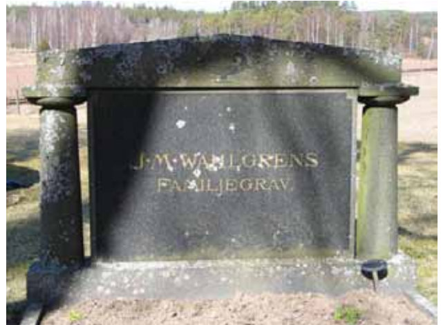
Familjegravvård i kvarter E. (KI Järeda 0170)