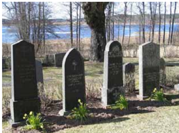
Kvarter E. (KI Järeda 0164)