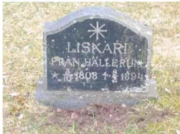
Vården över Liskari från Hällerum. (KI Järeda 0083)