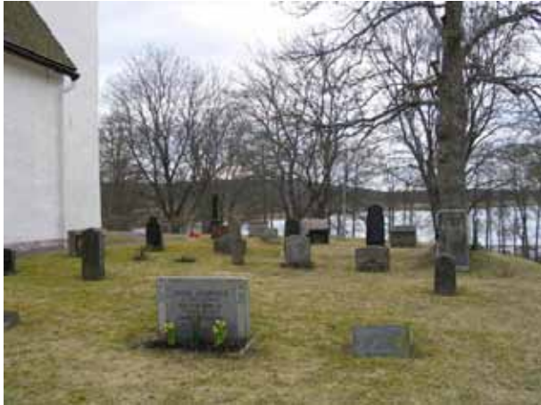
Kvarter D från öster. (KI Järeda 0104)