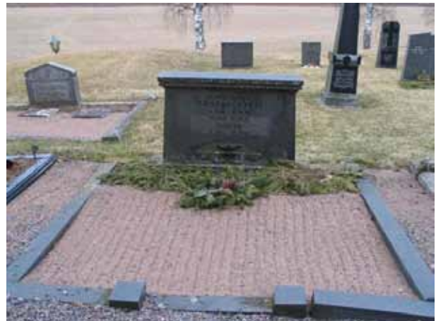
Kvarter A. (KI Järeda 0140)