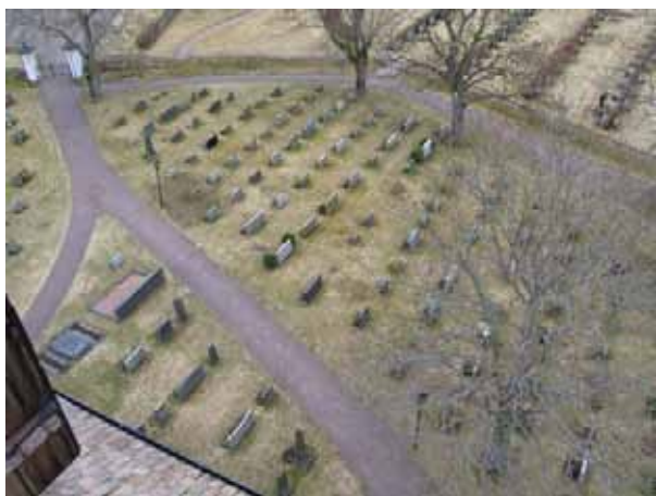
Kvarter B längst ner i bild. (KI Järeda 0026)

Gravvårdarnas ålder varierar starkt. Enstaka finns från 1880-talet, men merparten är från 1910-talet, två från 1930-talet, en från 1950-talet och den sist tillkomne från 2000. De flesta gravvårdar är av grå eller svart granit, merparten mellanhöga, men flera också höga. Här finns också två hällar/tumbor med kraftiga järnringar i var hörn. Samtliga gravvårdar utom två grusgravar står i gräsmattan, en del med möjlighet till liten plantering framför. Flera av gravplatserna har också brukats av samma familj under lång tid, som B ca 15 (1910/1973) och B ca 16-17 (1909/1991). Många av gravvårdarna har den dödes titel angiven, så som kantorn, fabrikören, nämndemannen, bankiren, kyrkovärden och hemmansägaren. De allra flesta av gravvårdarna har också by- eller gårdsnamn angivna. I övrigt finns flera stenar som är typiska för en viss tid. Anmärkningsvärd är de fina stenar som rests över ensamma kvinnor, B ca 31-32 över Frida Sofia Johansson och Greta 1913/1982 och Teckla Nilsson 1913.