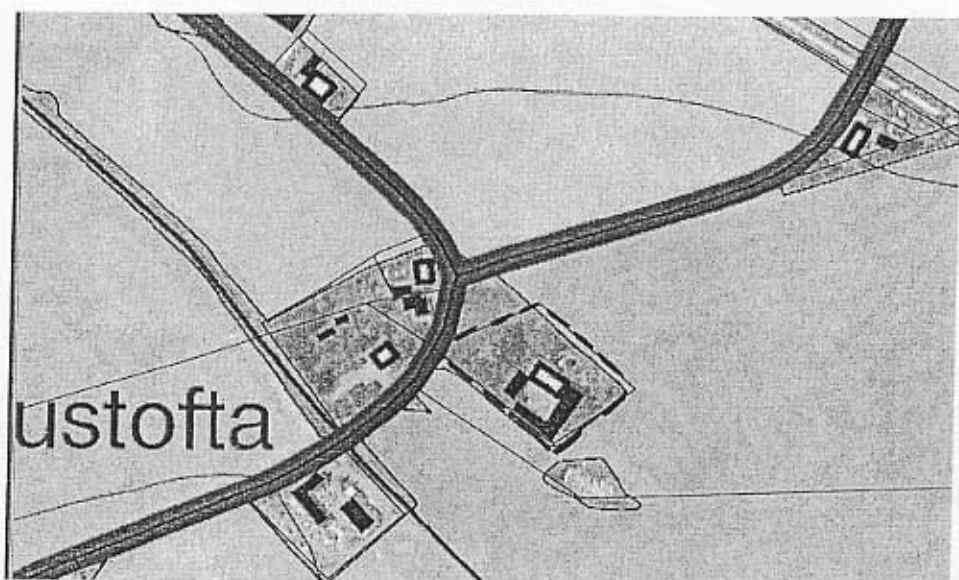
Hustofta 3:6, Väsby socken, Höganäs kommun, Skåne län.