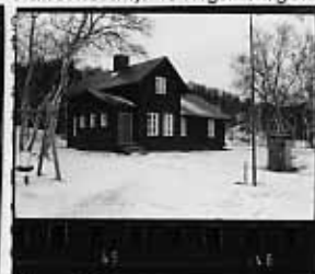
V vit X omålat eller urtvättat så att ursprunglig färg ej går att ange

SLL SLP PFv LSP SSP LFS SFS LPS SPS StockP stockpanel Fjäll fjällpanel Stick stickor, spjälor Rapp rappning/revetering med bruk Sprit spritputs Slät slätputs