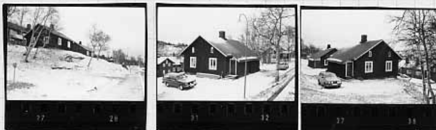
V a VI V V