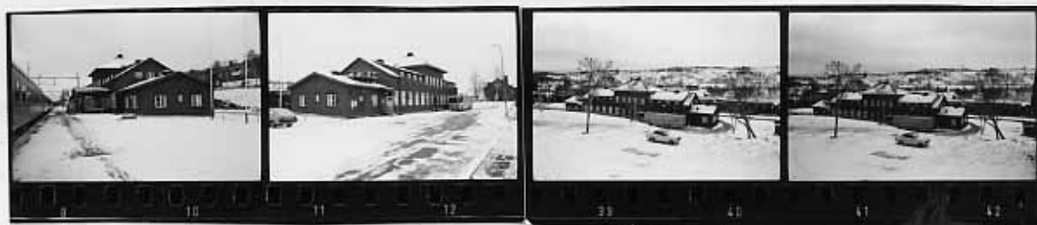
I I I I