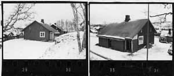
FÄRG och FÄRGTYP VI FR Faluröd, röd sl... ärg (spe- cialförkortn.). Övriga färger an-