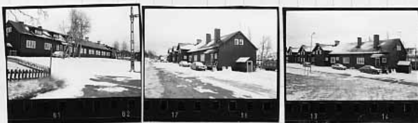
III mot spåret III fr. NV. III fr. NV.