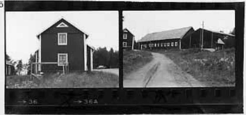
X Boningshus IX Ladugård