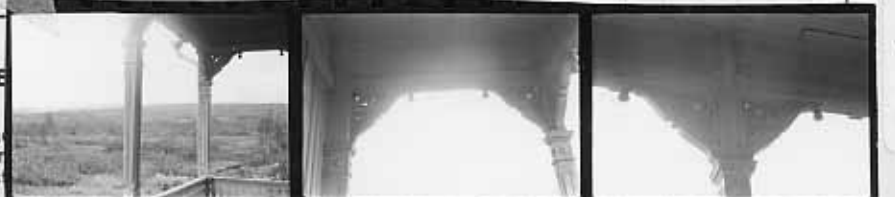
→ 34 → 34A → 35 → 35A → 36 → 36A KODAK SAFETY FILM 5063