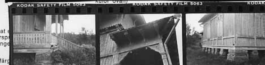
→ 8 → 8A → 9 → 9A → 10 → 10A

Pf-v panel på förvandling LSP liängande slät panel SS LF SF LP SP St Fjä Sti Ra