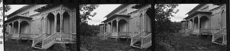
→ 11 → 11A → 12 → 12A → 13 → 13A KODAK SAFETY FILM 5063