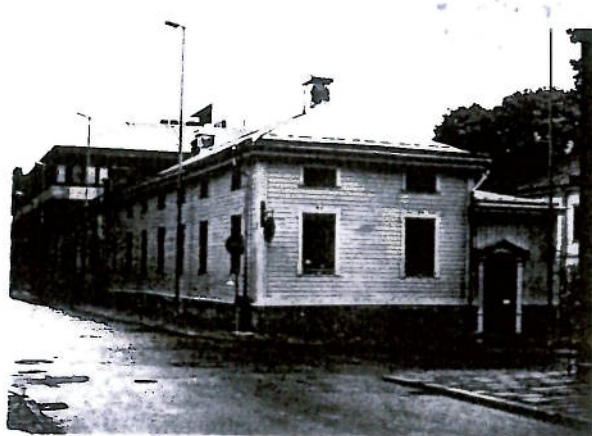
Västra flygelbyggnaden