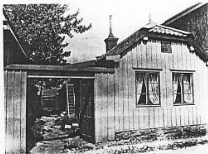
Kv Springer 4 vid 1900-talets början

Uthuslängan revs 1981 på grund av rötskador i stammen och i stället uppfördes en tillbyggnad i en och en halv våning till bostadshuset. Till fastigheten hör även en fristående sjöbod i