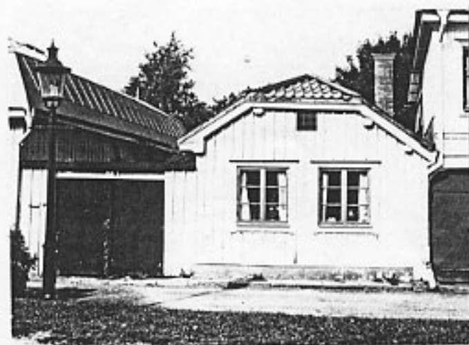
Kv Springer 4, bostadshuset Foto: Länsmuseet 1985

KV SPRINGER 4 Brynäs 9:4 Gävle stad, Gävle kommun