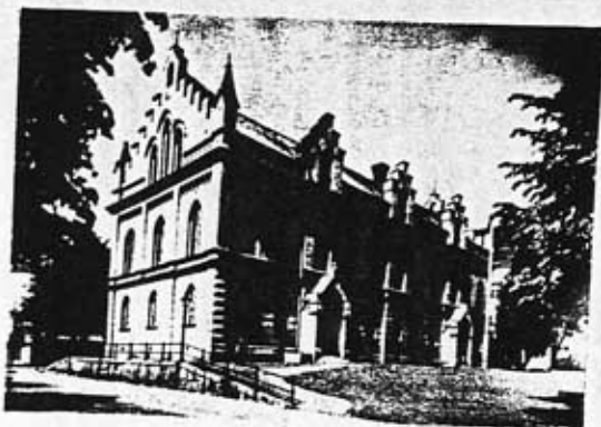
Exteriör: Frimurarhuset omkr 1925