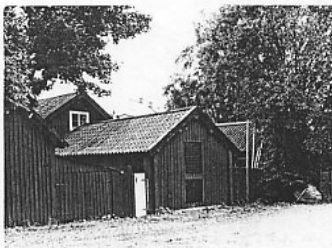
Sjöbodar tillhörande kv Springer 3, 4 och 5 Foto: Länsmuseet 1985

Ekonomibyggnaderna består förutom en sjöbod av ett f d fähus och vedlider som i senare tid delvis byggts om för andra funktioner. Samtliga uthus är timrade och klädda med rödfärgad