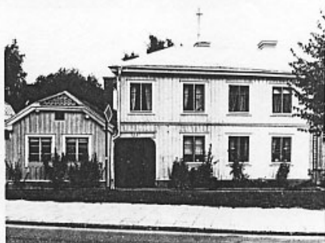
Kv Springer 3, bostadshuset (t h)

KV SPRINGER 3 Brynäs 9:3 Gävle stad, Gävle kommun