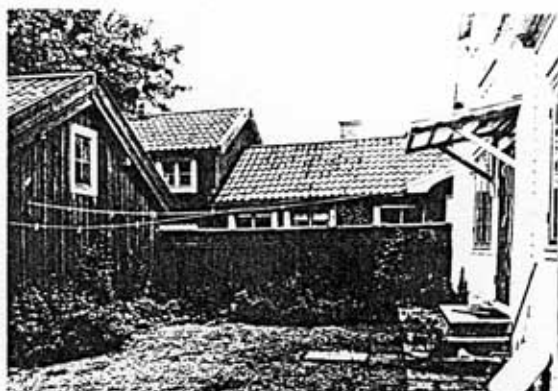
Kv Springer 5, gårdsinteriör

Fastigheten kv Springer 5 är en av endast fem bevarade fiskargårdar på Islandet i Gävle, ett område som i äldre tid nästan uteslutande beboddes av fiskare och sjömän.