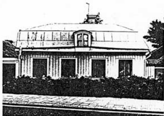
Kv Springer 5, bostadshuset Foto: Länsmuseet 1985

KV SPRINGER 5 Brynäs 9:5 Gävle stad, Gävle kommun