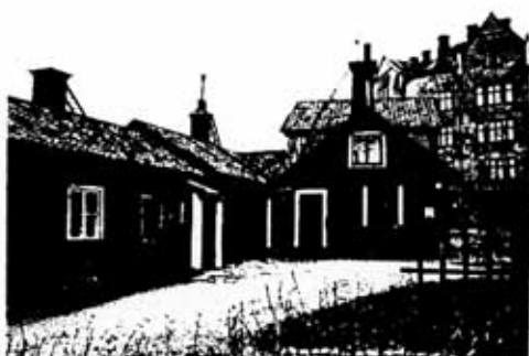
Kv Springer 6 1985