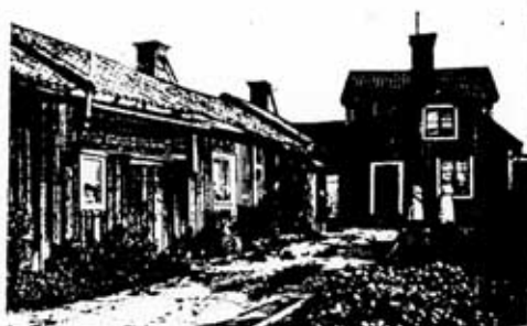
Kv Springer 6 omkring 1910