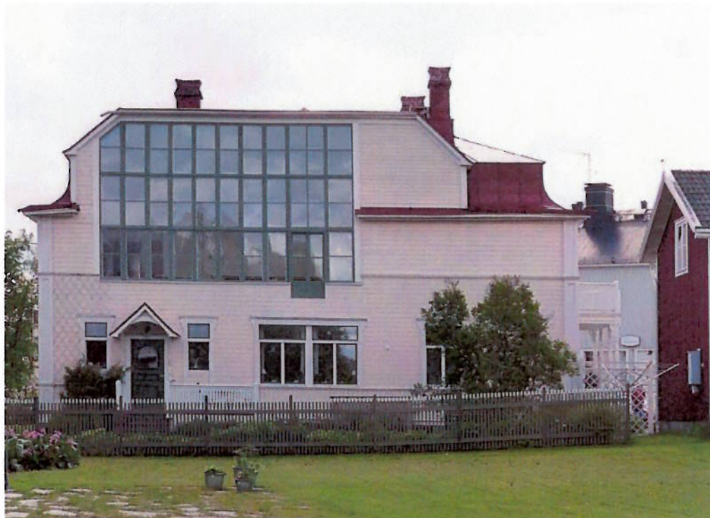
Fasad mot nordväst