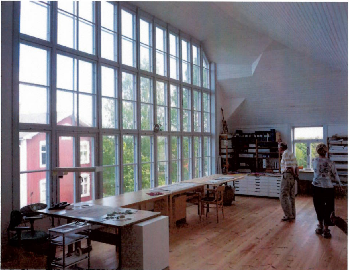
Ateljén mot norr