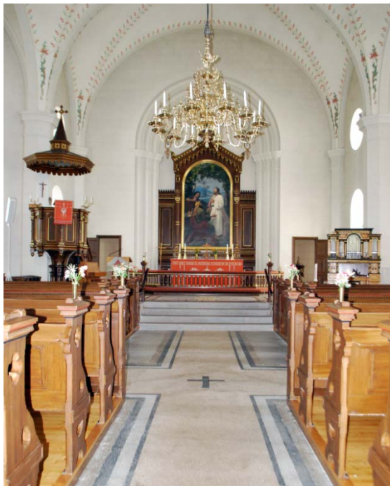
[4]: Långhuset mot koret

Sakristian har golv av cementmosaik, kvadermålade väggar i gulvit ton och vitputsat valv. I rummet finns förvarings-skåp, sittplats och ett altare.