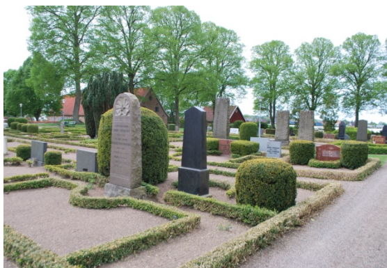
[8]: Gamla kyrkogården mot söder