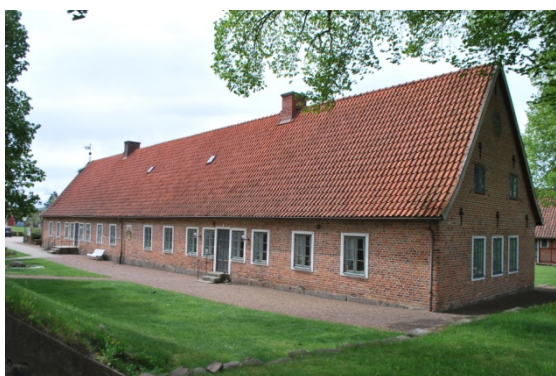
[1]: Församlingshemmet/ Gyllenbielkeska hospitalet

1900-talets andra hälft har inneburit att Kvidinge långsamt stagnerat. I samhället bor idag runt 1900 invånare, som arbetar på ortens företag eller pendlar till Åstorp eller Helsingborg. Kommunikationerna är goda med bl.a. en centralt placerad Pågatågs-tågsstation från 2014. Handeln och servicen är däremot begränsad.