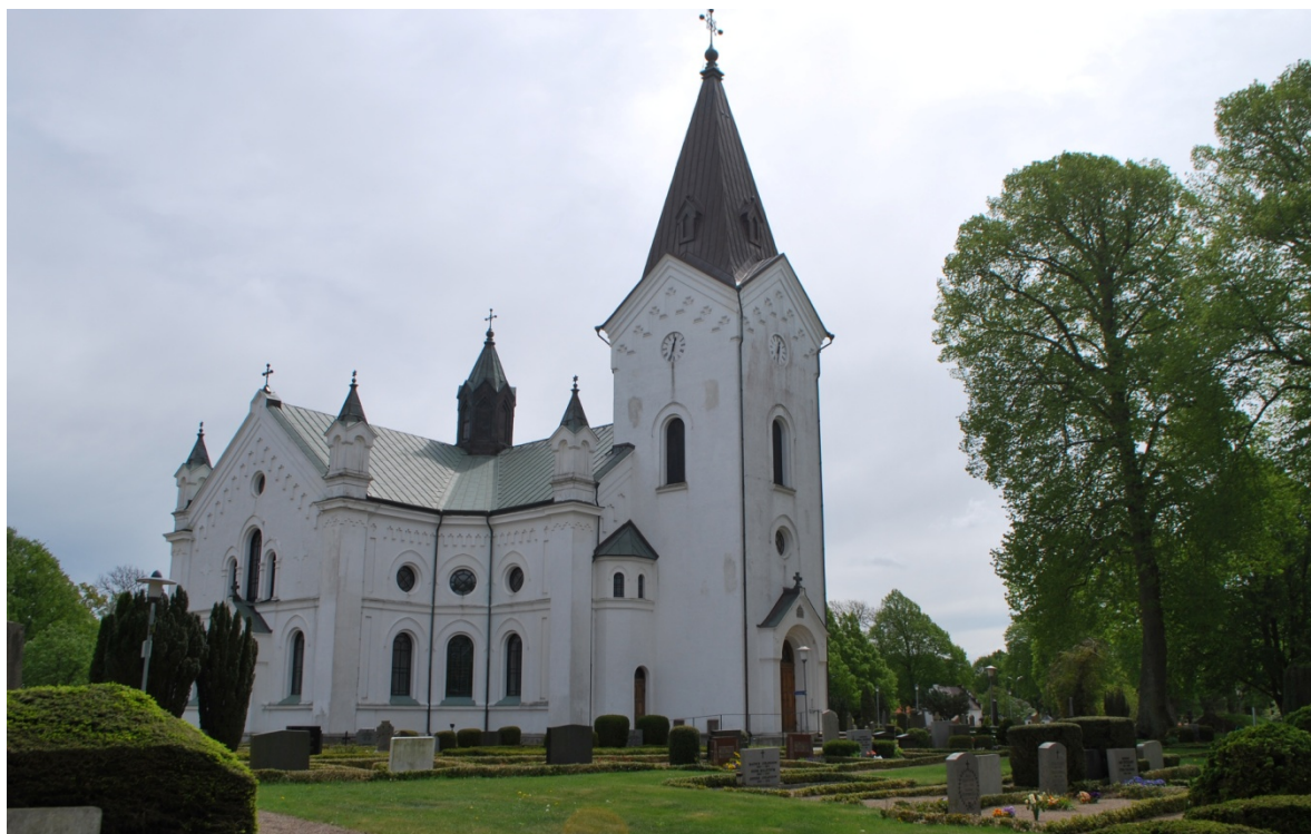
[3]: Kyrkan från nordväst

Kyrkan står på en kallmur av gråsten. Tornets murar är av gråsten, frånsett på- och ommurningar som gjorts i samband med bygget av den nya kyrkan. Sockeln är av oputsad gråsten. Övriga fasader har yttermurar av gråsten och innermurar av tegel. Tegel har även använts till tureller, omfattningar och detaljer. Sockeln är byggd av granit och sandsten som återvunnits från den medeltida kyrkan. Fasaderna är vita, spritputsade med slätputsade, artikulerade partier i form av pilastrar, gesimser, listverk, blindingar, stjärnor och kors. Under fönstren finns en bröstgesims, och ovan fönstren en gördelgesims. Under takfoten löper en tandad takgesims, som förenas med lisener i murhörnen. På hörnsträvorna står fialer med blinderade öppningar. Tornet saknar avdelande gesimser och lisener, men har tandsnittsgesimsen vid spirans takfot. Fönsteröppningarna markeras med putsade omfattningar i relief, s.k. ”ögonbryn”.