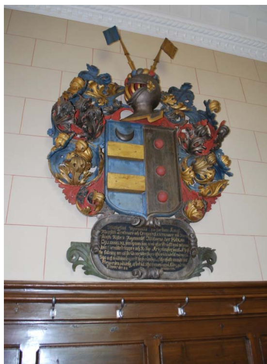
[7]: Håkan Gyllenbielkes huvudbanér