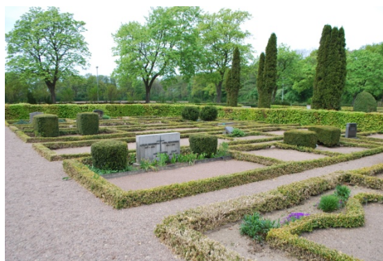
[9]: Utvidgningen från 1929

Utvidgningen från 1929 [9] är utlagd som en korsplan kring två grusade axlar. Kring huvudaxeln i nord-sydlig riktning finns i vardera ända en platsbildning, och i mötet mellan gångarna en mittplats prydd med en amfora på en järnpiedestal. I blickfånget längst norrut står ett träkors. Längs gångarna finns gravplatser (avd E), och bakom dessa rygghäckar av bok som gömmer fyra större områden (avd A-D) med fler vårdar. Gravplatserna, till stor del vakanta, är mestadels grästäckta med buxbomsinfattning. Runt de centrala kvarteren går en grusad gångslinga, som kantas av ett varv gravar (Avd F-G) i utvidgningens ytterkant. Gränsen mot omgivningen består av en trädkrans och omväxlande en häck och en kallmur. Längst i norr finns två grästäckta ytor, som används till urngravplats och minneslund (avd H-I). På urngravplatsen står vårdarna längs den omgärdande bokhäcken, och i mitten ligger två rader stenar vända mot varandra. Minneslundens pryds av en minnesten, ställd framför ett högt träd, och ett smideskonstverk av Per Jadéus där allmänheten kan sätta blomvaser och gravljus.