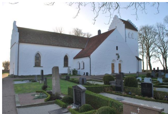
Fasad mot nordost.

Långhuset har åtta stora spetsbågiga fönster i tvåsprångiga nischer. Fönstren har en stomme av två vertikala och fyra horisontella stormjärn och däremellan kvadratisk indelning med blyspröjsar. Glaset är svagt färgat. I mitten finns glasmålningar. Solbänkarna är täckta med kalksten.