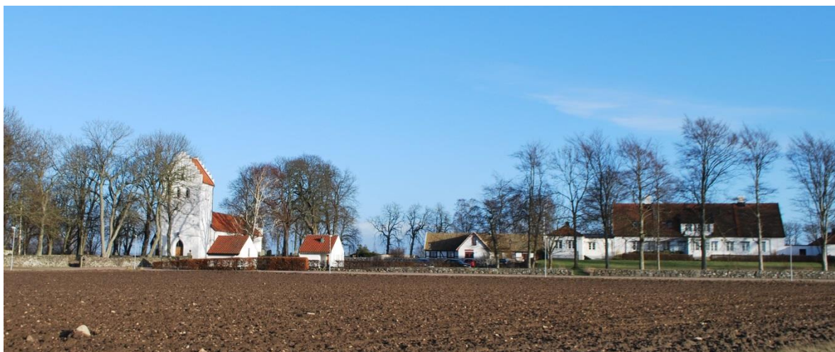
Kyrka, bårhus, fd klockarboställe och prästgård.

en redskapsfabrik flyttad från Ängeltofta gård. Väster ut finns parkering med förråd och bårhus. Nya kyrkogården omges av jordbruksmark på alla sidor utom mot väster där landsvägen delar gamla och nya kyrkogården.