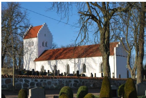
Fasad mot sydöst.

Kyrkorummet nås via dörrar i väster, norr och öster. Samtliga dessa dörrar är från 1925 och klädda med ekpanel med ett zick zack mönster, invändigt är de uppbyggda med ramverk och fyllningar. Gångjärnen är dekorativa bockhornsgångjärn. Huvudingången i väster i tornet sitter i en spetsbågig nisch med två språng medan dörrarna i nykyrkan sitter i rundbågiga nischer, liksom dörren till sakristian i öster. Marken sluttar mot öster och ingången till sakristian nås med en halvrund granittrappa med fyra steg.