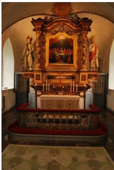
Altaruppsatsen i koret.

Altarringen av trä är förmodligen från 1925. Planformen minskades 2012. Den består av flerfärgsmålade balusterdockor mellan tygklätt knäfall och överliggaret. Planen är U-formad.