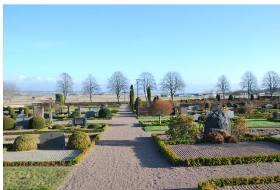
Nya kyrkogården mot öster.

Gamla kyrkogården är omgärdad av en murad gråstensmur avtäckt med tegelpannor och en trädkrans av kastanj. Mot norr finns en murad stiglucka, en överbyggd port som leder till Övragårds ägor. Smidesgrindar finns i övriga väderstreck. Kyrkan omges av singel förutom från parkeringen till huvudentrén där en gång med betongplattor ligger och nordöstra hörnet som är grässått. Gravstenarna står delvis i gräs, andra är omgärdade av buxbom och singel, enstaka platser har sten- eller järnomfattning. Gångarna mellan kvarteren är gräsbesådda. Bland stenarna finns höga obelisker, stenar utformade som trädstammar blandat med nyare låga och breda stenar. Titlarna är övervägande lantbrukare men närheten till havet märks med titlar som skeppare. En anmärkningsvärt sorglig sten visar en familj med nio barn som alla dog i ung ålder.