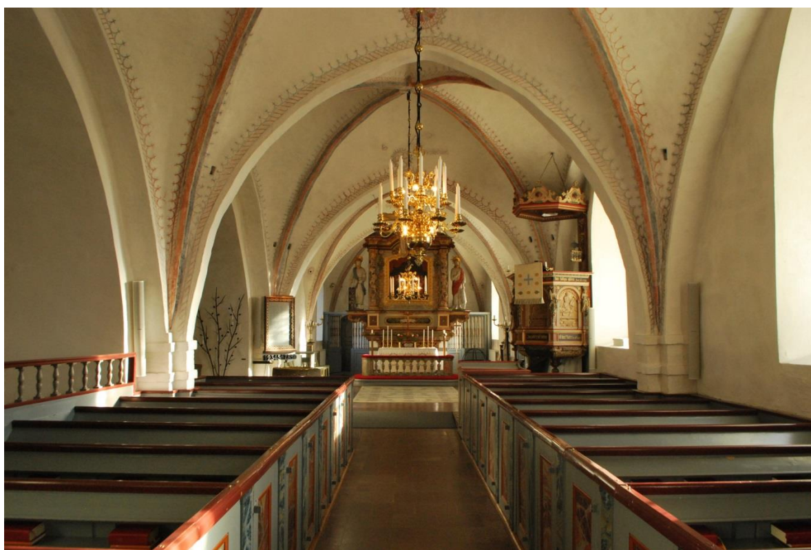
Långhuset mot altaret i öster.