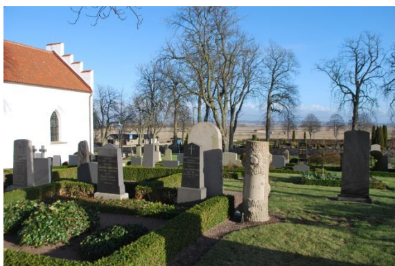
Kyrkogården söder om kyrkan.

2006 inrättas ett lapidarium efter ritningar av kyrkogårdsvaktmästare Cecilia Svensson i ett utvidgat område väster om kyrkan.