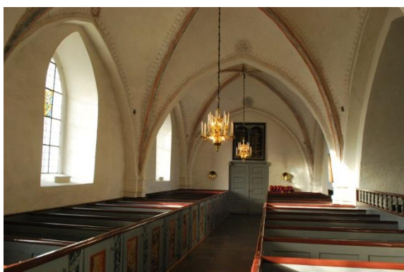
Långhuset mot väster.

Nykyrkan består av två delar, Engeltofta gravkor (västra delen) från 1640 och utvidgningen 1802 (östra delen) som båda byggdes om 1925. Båda delarna har putsade och vitkalkade väggar. Taken är täckta av ribblösa kryssvalv från 1925. Östra delen är inredd med bänkar. Golv av kalksten i gången och brädor under bänkarna. Två rundbågiga fönster med glasmålningar sitter inom en större rundbågig nisch. På norrväggen hänger en minnestavla över de 31 personer som dog i en flygolycka nära kyrkan 1964. Västra delen ligger två trappsteg högre och nås genom en rundbågig öppning. Golvet är täckt med en plastmatta. Denna del fylls av orgeln.