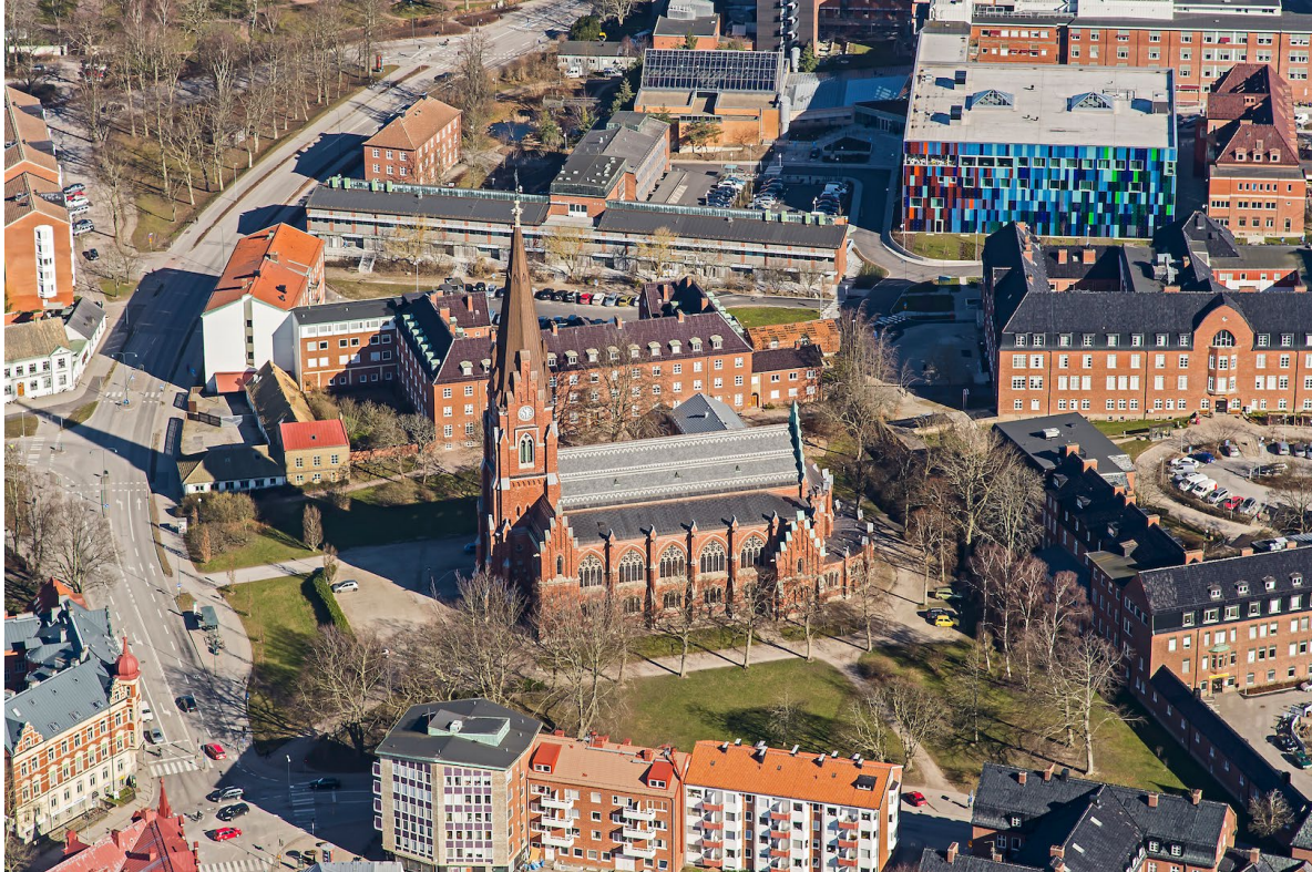
Flygbild över Allhelgonakyrkan tagen från söder, 2014.

ännu en lantlig prägel och äldre foton visar ofta kyrkan i ett perspektiv med stora öppna grönområden i fonden. Söder om kyrkan, i kvarteret Norrtull mellan Allhelgona Kyrkogata och Norra Vallgatan, fanns dock fattigmansbebyggelse som bestod av ett gytter av enkla hus fördelade på 41 tomter. Den största delen av denna bebyggelse fick ge vika för lasarettets utvidgningar 1916–18 och 1925, men närmast Bredgatan kvarstod fattigmanshusen ända in på mitten av 1900-talet.