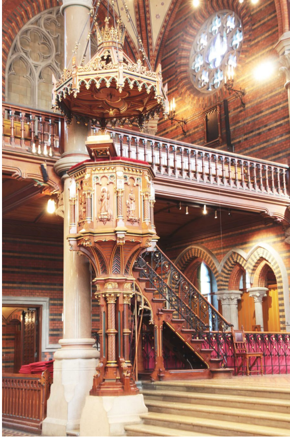
Predikstolen är liksom merparten av den övriga inredningen bevarad från kyrkans uppförande.