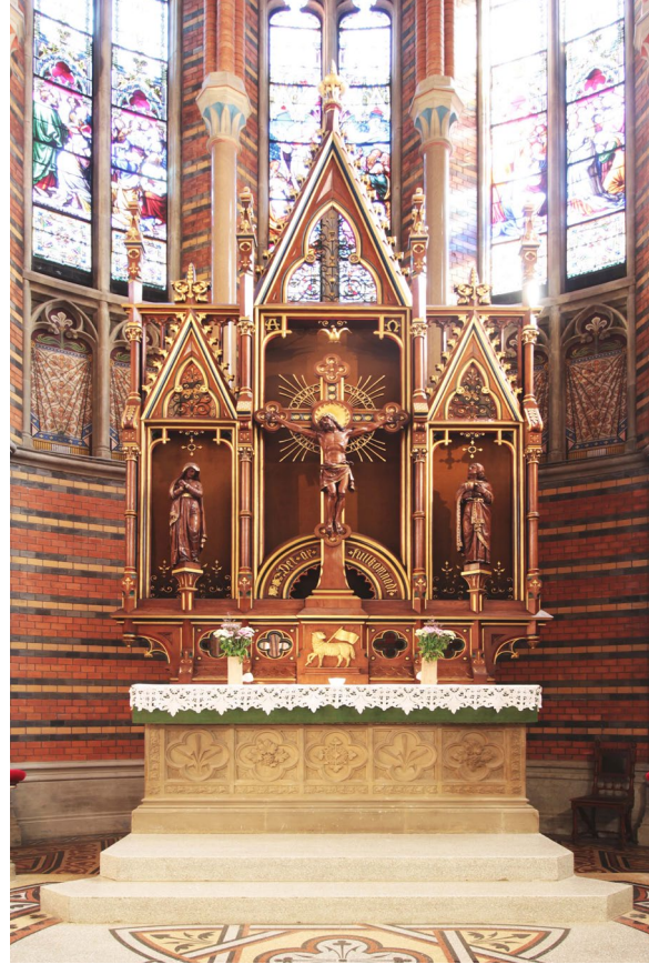
Altaranordningen i högkoret. Altaruppsatsens skulpturer tillverkades av Carl Johan Dyfverman.