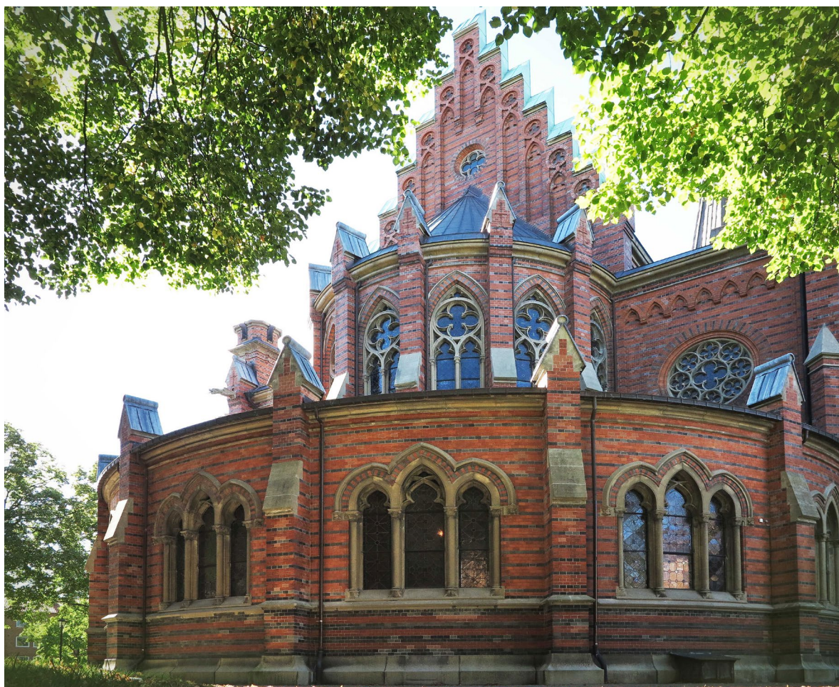
Högekoret och koromgången i öster.

Tornet delas in i tre våningar av gördelgesimser. I den första våningen återfinns västportalen, som är kyrkans huvudentré. Portalen omfattas av trekvartskolonner samt vimperg, det vill säga en spetsig prydnadsgavel, smyckad med fempass och kors. Porten med överljus tillkom 1934 och består av en vikkörskonstruktion i kopparklädd ek. Våningen avslutas upptill med en tandsnittsfris. Nästa våning har ett tvådelat spetsbågefönster med masverk i väst och avslutas med en spetsbågefris. Tredje våningen, klockvåningen, har spetsbågiga ljudluckor i fyra väderstreck och avslutas med trappstegsgavlar med urverk i vardera fasad. Tornets lisenliknande strävpelare har sentida täckning av blyplåt. Den oktagonala spiran är murad och var ursprungligen avtäckt med skiffer eller enligt vissa källor med beklädnadstegel. Redan 1924 byttes emellertid täckningsmaterialet ut till kopparplåt efter problem med läckage. Spiran kröns av ett bronskors ståendes på en korsblomma i granit. Tornet flankeras av ett kort tvärskepp med sadeltak och trappstegsgavlar i norr och söder, samt portaler och tvådelade spetsbågefönster i väst.