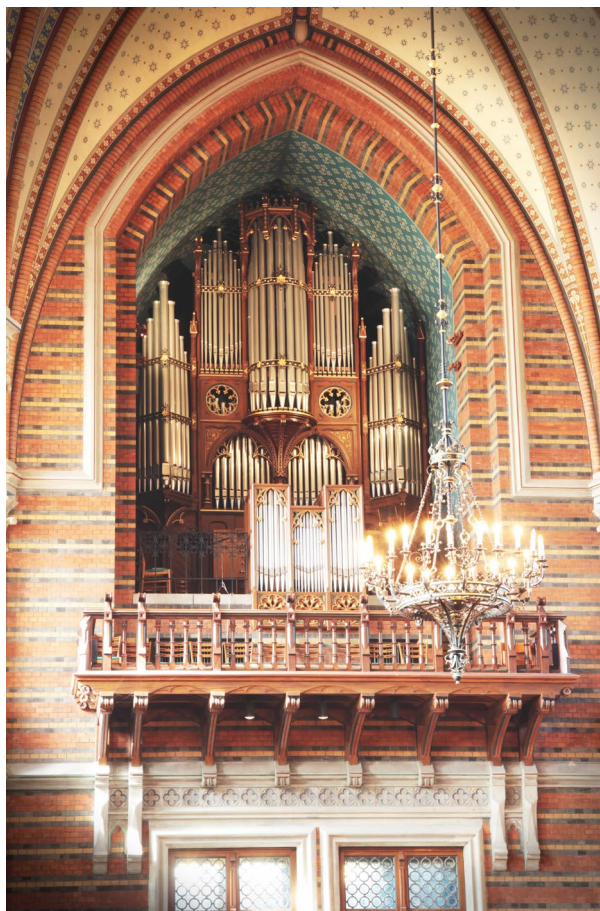
Orgelläktaren och orgeln över ingången i väster.

vapenhus. Golvet är belagt med cementmosaikplattor i gult, rött och svart och väggarna klädda med mönstermurat engoberat fasadtegel i samma kulörer. Taket är valvslaget i två smala travéer. Kryssvalven har vitputsade valvkappor och ribbor i rött formtegel vilka vilar på formgjutna blomsterkapitäl. Dörrar till långhus och tvärskeppets trapphus är i fernissad ek och indelade i små speglar med gotiskt formspråk. Mot såväl långhus som tvärskepp finns överljus med strukturglas och gjutjärnspröjs. Ovan överljus och fönster finns inhuggna bibelord och uppgifter om kyrkans upp-förande. Zettervalls symboliska förebild för vapenhuset var förhallen till Salomos tempel, ”helgedomens förgård” som arkitekten själv beskrev det.