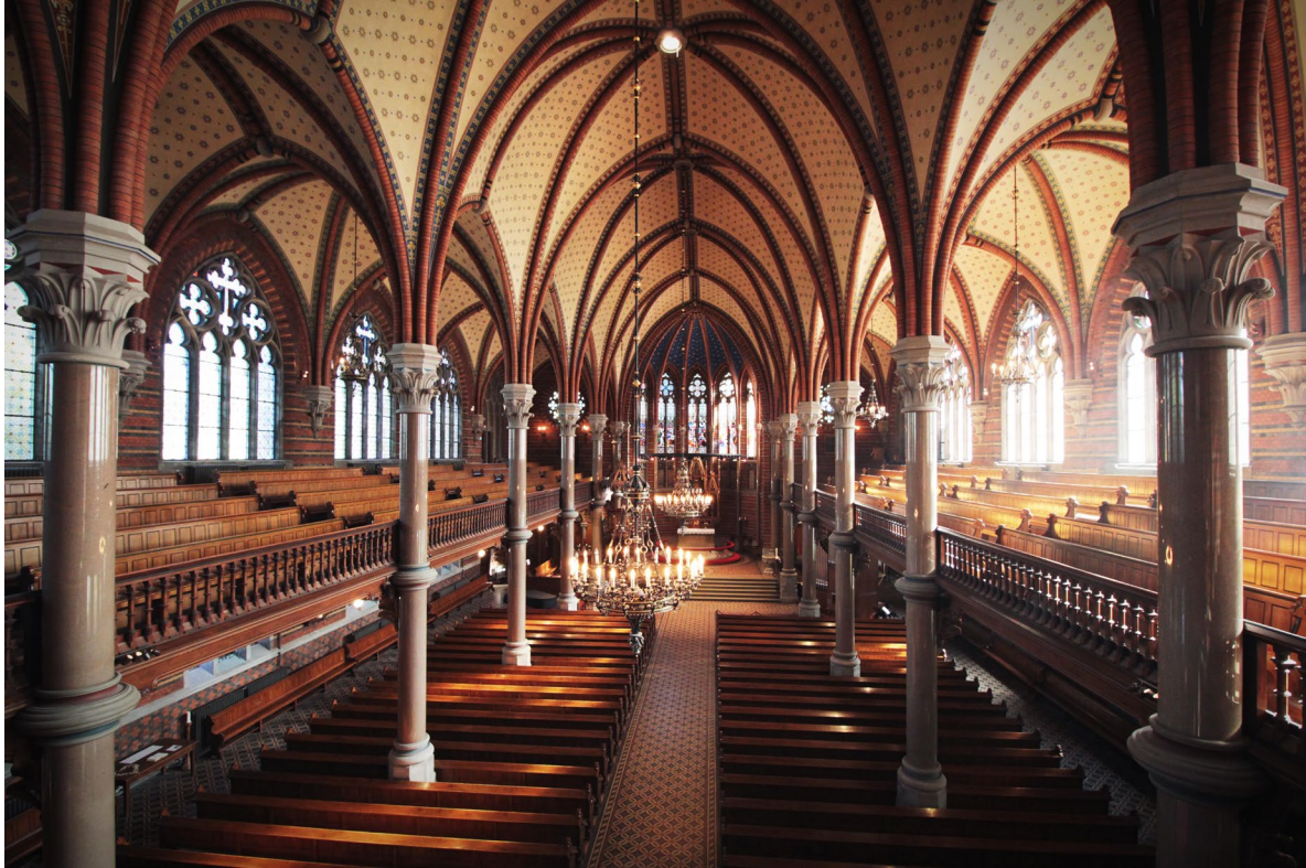
Kyrkorummet sett åt öster från orgelläktaren.

Långhuset har tre skepp indelat i fem travéer och lika många fönsteraxlar, vilka avskiljs av strävpelare som kröns av blyplåtstäckta fialer med vattenkastare i form av bevingade drakar. Nedre våningen har tredelade spetsbågefönster medan den övre våningen har stora fönsterpartier med fyrdelade spetsbågar och masverk.