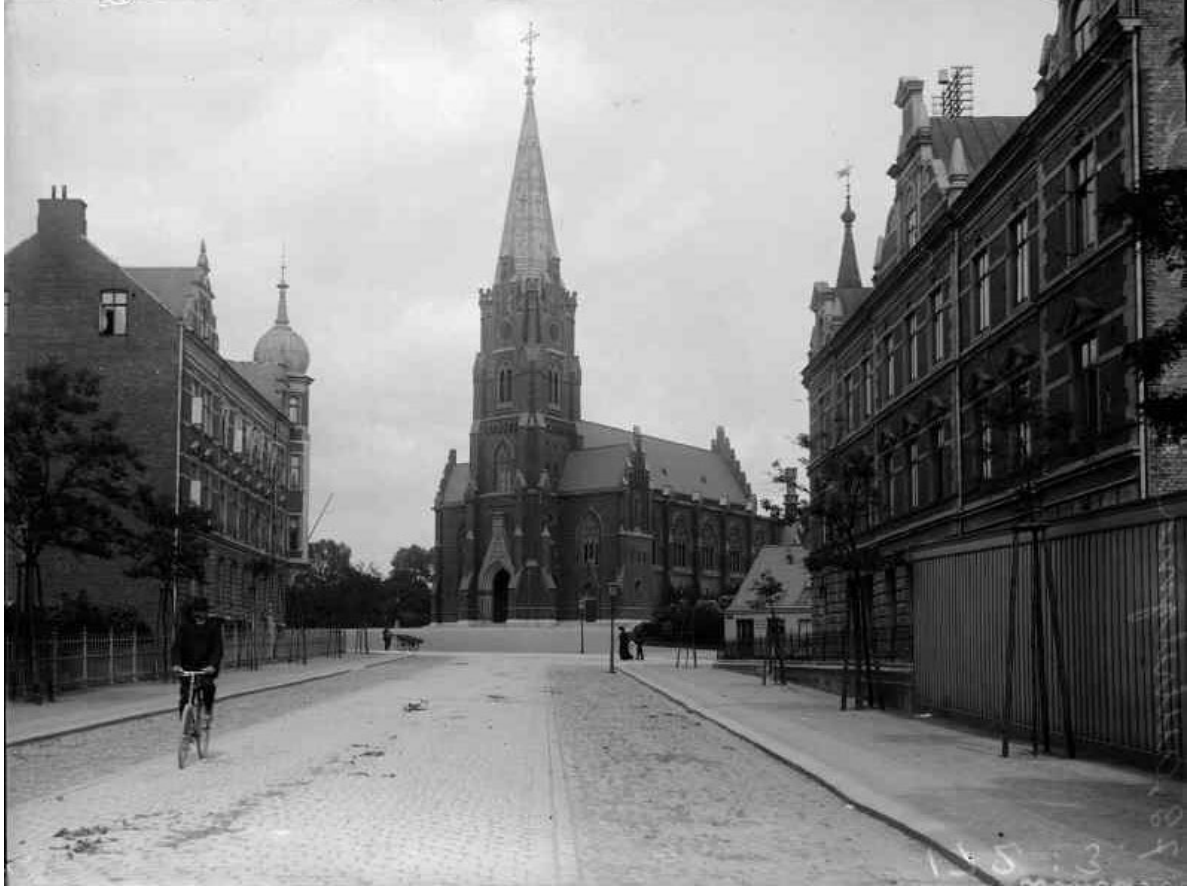
Fotografi taget från Sankt Laurentiigatan någon gång mellan 1904 och 1906. I en ursprunglig stadsplan var kyrkan placerad i rak axel med gatan. Planen överklagades dock och kyrkan kom att uppföras i traditionell öst-västlig riktning.

hänvisning till akustikproblematik. Istället förordades spetsbågestilen, och uppdraget gick till domkyrkoarkitekten Helgo Zettervall som upprättade ett förslag i djärv nygotisk stil med genombrutet västtorn och påtaglig vertikal strävan.