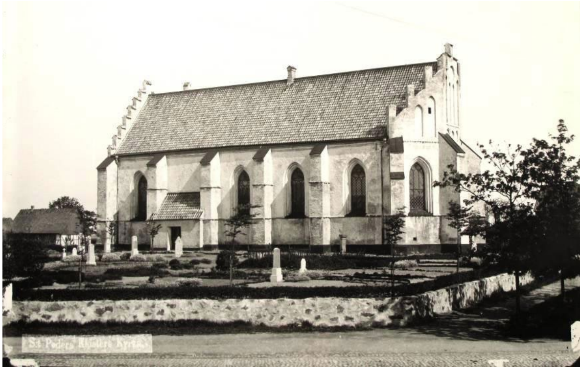
Klosterkyrkan fotograferad från söder innan Henrik Sjöströms restaurering 1894 då putsen knackades ner. Notera det lilla och enkla vapenhuset samt den ännu inte uppvuxna lindarkad.

Under åren 1925–28 skedde den största omdaning av kyrkan sedan medeltiden. Arbetena inleddes med omfattande arkeologiska utgrävningar under ledning av Bengt Engström, vid vilka bland annat den romanska kyrkans grundmurar och ett flertal medeltida gravar, såväl i som utanför kyrkan, påträffades.