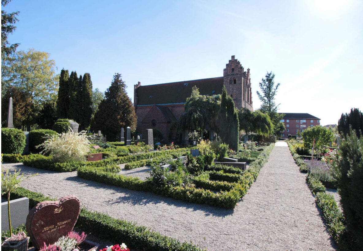
Kyrkogårdens norra del.

om kyrkan, den gamla klostergården som numera fungerade som beteshage för klockaregården, ansågs lämpligast för ändamålet och 1836 invigdes den nya delen av kyrkogården. Iordningställandet medförde att de spår av klosteranläggningen som fanns bevarade under jord permanent avlägsnades.