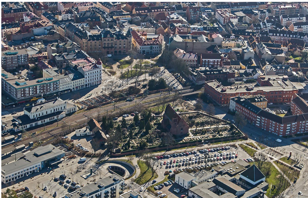
Flygfoto över Klosterkyrkan taget 2014. Till vänster syns stationshuset och bortom kyrkan banvallen och Bantorget.