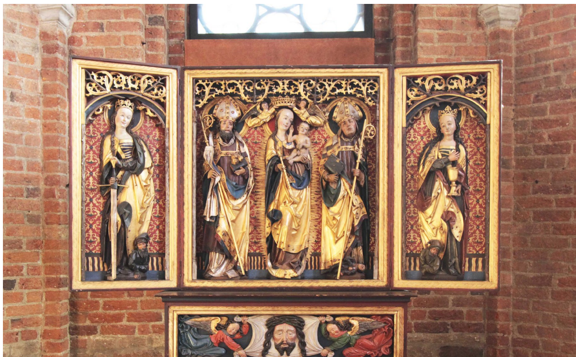
Altaruppsatsen tillkom kyrkan 1931 och är daterad till sent 1400-tal eller tidigt 1500-tal.

Altarskåpet inköptes 1931 från en tysk auktionsfirma och har daterats till 1480 av en professor Clemens, vilken också härleder den till en grupp helgonskåp från Tübingen.