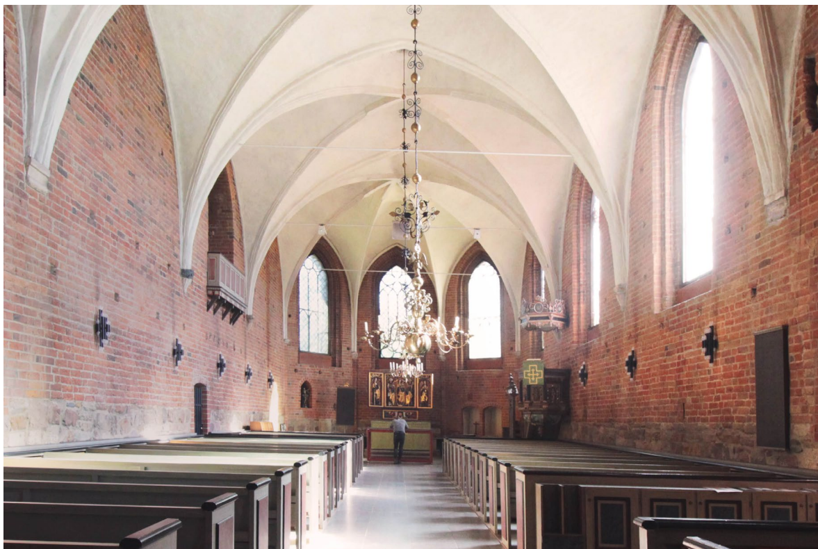
Kyrkorummet sett åt öster. Mellan valvsäcklarna i den mittersta valvtravén på norrväggen syns den så kallade Priorissans läktare.

I norra väggen, ovan en indragen stickbågig öppning till sakristian, finns den så kallade Priorissans läktare. Denna består av en läktarbarriär placerad i en stor spetsbågig nisch med segmentformig öppning in mot den norra tillbyggnadens andra våning. Läktarbarriären tillkom vid 1920-talet, medan muröppningen sannolikt är ursprunglig från kyrkans uppförande. Namnet kommer sig av att man enligt vissa teorier menar att klostrets överhuvud, priorissan, hade sin plats här under gudstjänsten. Andra teorier gör gällande att den kan ha varit avsedd för cantrix, den nunna som utövade växelsång med nunnekören. I norra väggens västra del syns också spår av de valv som bar upp den tidigare nunneläktaren. Dessutom finns här hål efter läktarens bjälklag och, precis som i övriga väggar, bomhål. Högt upp i den andra travéen från väster finns en rektangulär nisch med en petrusskulptur. I nästa travé åt vänster leder en stickbågig öppning med en gråmålad enkeldörr in till tornet.