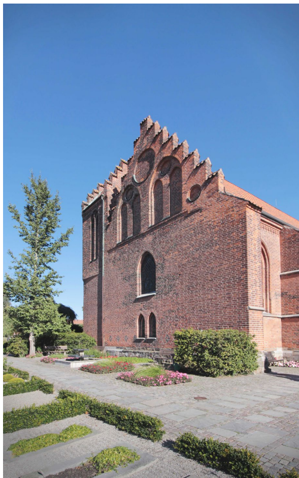
Kyrkans västra gavel.

Kyrkans östra fasad, med den tresidiga koravslutningen, har lika utformade fönster som i södra fasaden. Dessa lär dock ha nytillverkats vid renoveringen på 1970-talet och är således cirka 130 år yngre än västfasadens fönster. Även takfrisen i formtegel går igen, men här med överliggande sågtandsskift. Under det nordligaste av de tre fönstren finns en gravsten från tidigt 1800-tal inmurad.