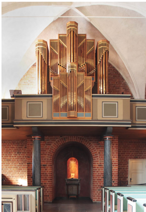
Orgelläktaren i väster från 1920, och kapellet från samma år med målningar av Olle Hjortzberg.

Öster om tornets tillbyggnad ansluter tillbyggnaderna från 1920-talet, där den första delen utgör väntrum med WC. Därefter följer skrudkammaren med pentry, som även fungerar som vaktmästeri, samt sakristian, som har helboaserade väggar samt i öster en bönenisch med muralmåleri av Hjortzberg. På sakristians ovanvåning finns ett trävälvt rum som bland annat fungerar som konfirmand- och samtalsrum. Vid den södra väggen står ett enkelt altare ovan vilket ett större krucifix i ek hänger. Öster om krucifixet finns en öppning till kyrkorummet och Priorissans läktare.