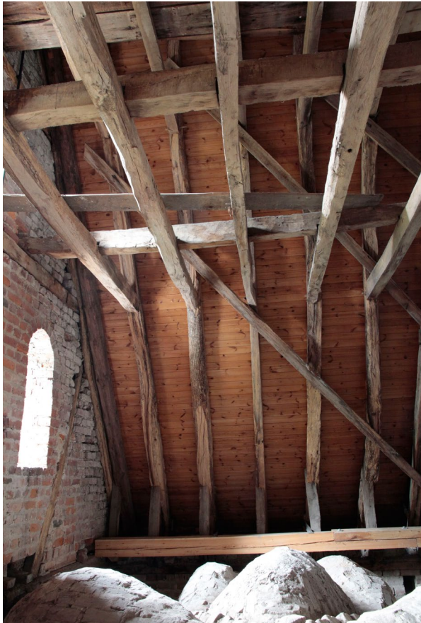
Östra sidan av långhusvinden, sett mot söder. Den ursprungliga takstolskonstruktionen från sent 1500-tal är i stort sett oförändrad sedan uppförandet. I bildens nederkant syns gratvalvens toppiga ovansida.

Liksom vapenhuset är taket täckt av ett fyrkappigt gratvalv. I dess norra mur finns prästingången. Sakristian är uppförd samtidigt som den övriga kyrkan.