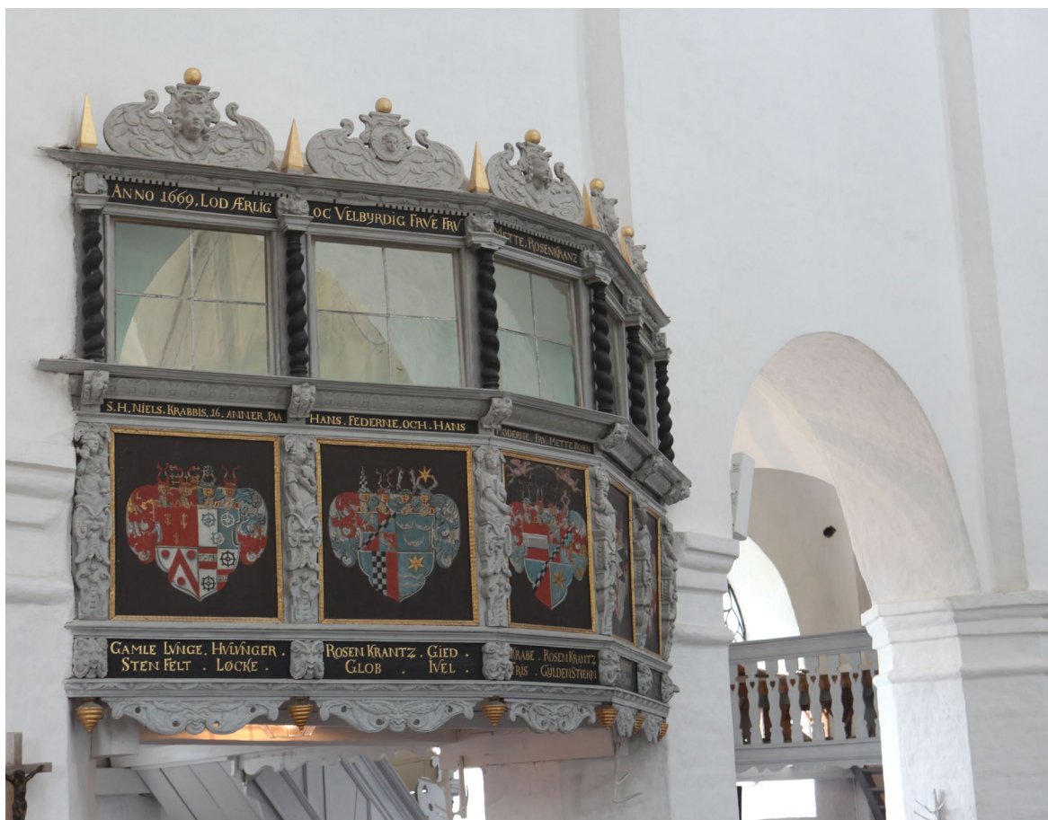
Herrskapsläktaren från 1669 som ovanligt nog är upphängd på väggen.

och svart återfinns mellan glaspartierna och vapensköldarna samt strax över de dekorativt snidade understyckena som avslutar läktarbarriären nedåt. Innehavarna på Häckeberga slott har dispositionsrätt över herrskapsläktaren för all framtid, så länge de bekostar dess underhåll.