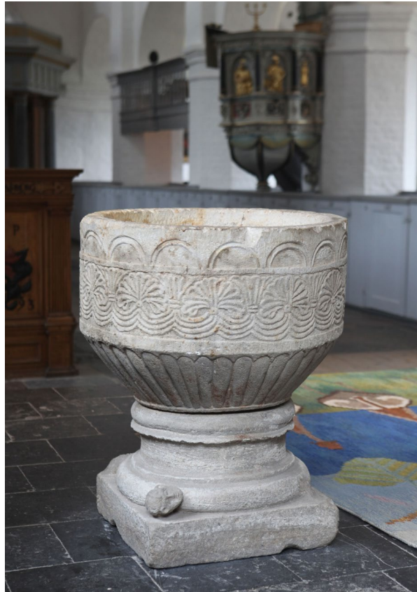
Dopfunten är placerad i korets södra del.