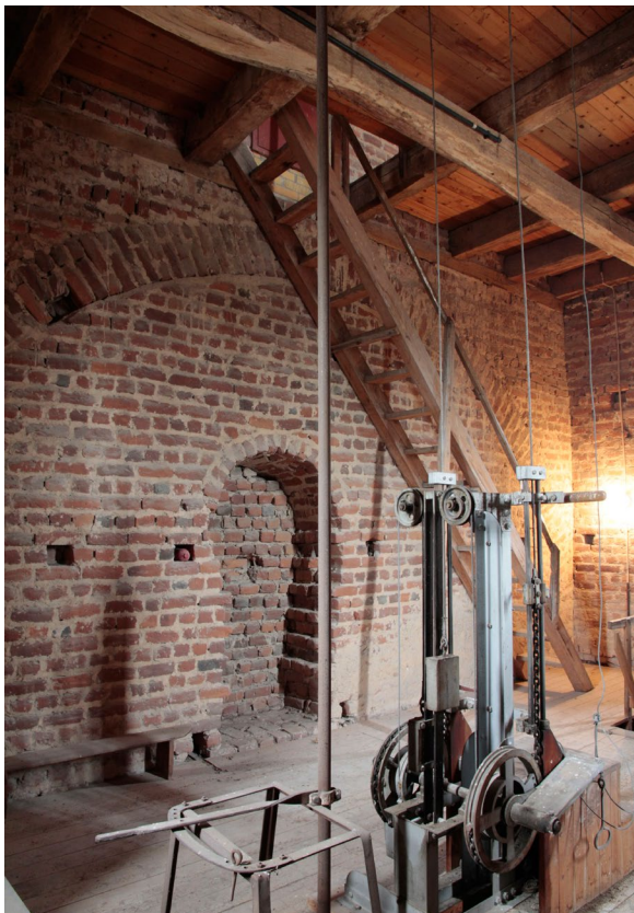
Tornets tredje våning. Notera bomhålen i muren, avlastningsbågen i muren och det igenmurade hålet, vilket troligen användes för materialtransport vid kyrkans uppförande.

tyder på att dess västra del hört till en tidigare läktare. Den östra delen i tornets bottenvåning bärs upp av fyra marmorerade träpelare medan den tresidiga delen in mot kyrkorummet bärs upp av sex krenelerade doriska träkolonner som stänkmålats. Både pelare och kolonner är målade i grått och brunt på grå botten och har skaft med entasis, dvs. att skaften har en ansvällning vid mitten. Ovanpå kolonnerna vilar ett entablement dekorerat med triglyfer och en utkragande tandsnittsfris. Läktarbarriärens krön är dekorerat med en kraftig meanderslinga. Läktarbarriären är målad i en gråblå kulör med accenter i guld.