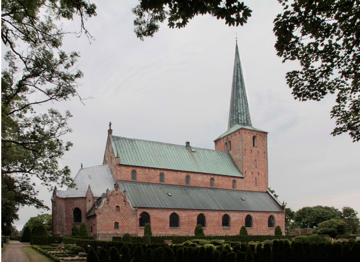
Genarps kyrka sedd från nordväst.

När Genarps kyrka restes revs en liten medeltida kyrka som låg på ungefär samma plats. Vid en restaurering på 1930-talet påträffades foten från en dopfont som troligen hört till den medeltida kyrkan. Kunskapen om den tidigare kyrkan är idag närmast obefintlig.