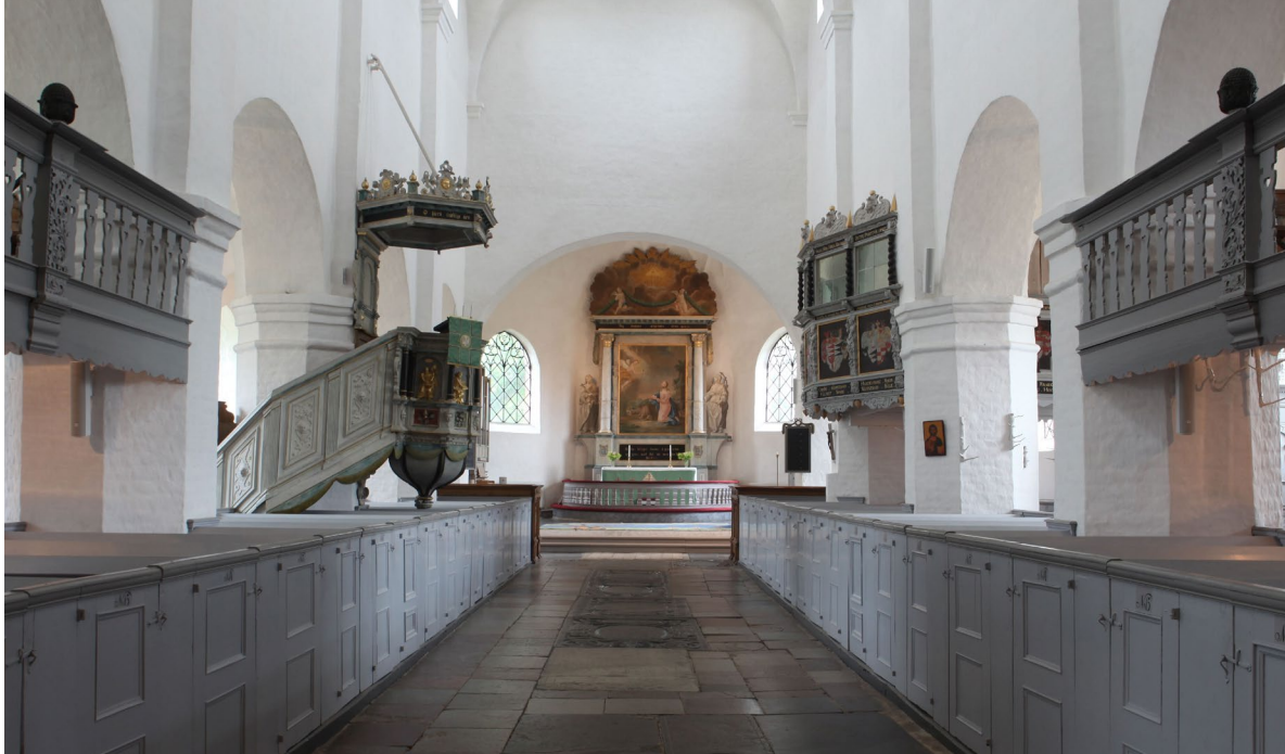
Kyrkorummet sett från öster. I bildens ytterkanter syns pig- och drängläktarna.