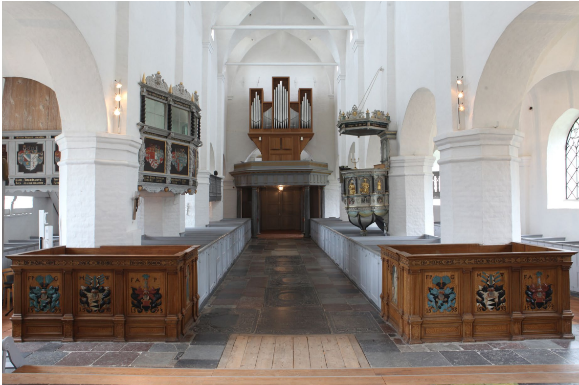
Kyrkorummets sett från öster. I förgrunden syns de båda herrskapsbänkarna från 1593. På höger sida syns predikstolen från samma år och på väggen till vänster herrskapsläktaren från 1669. Den kraftfulla orgeln på orgelläktaren dominerar i kyrkorummets västra del.

i ek med tunna vertikalställda ribbor i den undre delen. Spelbordet är integrerat i orgelhuset och är vänt från kyrkorummets. En kororgel står sedan den inköpts från Lindö kapell i Norrköping år 2004 i korabsidens norra del. Dess uppbyggnad är snarlik Marcussenorgeln med femdelat övre parti. Fasad och orgelhus är tillverkade i grönlaserat trä.