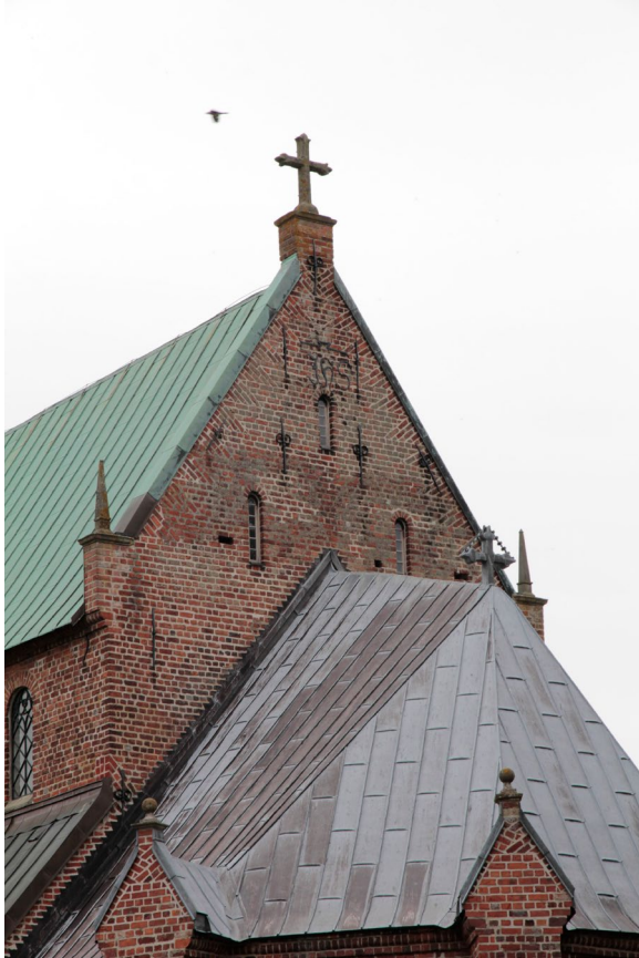
Kortaket i bly och långhusets vind. Notera fialerna, kulornamenten och ankarlutarna på långhusets gavel.

Murarna är oputsade och uppförda i rödaktigt stortegel och vilar på en utskjutande sockel av kvaderhuggen natursten. Teglet är lagt i kryssförband och har ritsade fogar. Fasaderna avslutas upptill av en vulstprofilerad kornisch i samma tegel som i fasaderna. Kyrkans tegel sägs ha tillverkats sydväst om Genarp i Hässelberga 1. Troligen var bottenvåningens samtliga fönster ursprungligen blyinfattade och hade sandstensposter. Merparten av dessa ersattes på 1870-talet av de något mindre svartmålade gjutjärnsfönster som kyrkan har idag. I sakristian finns ännu ett blyinfattat fönster bevarat, vilket vetter åt norr.