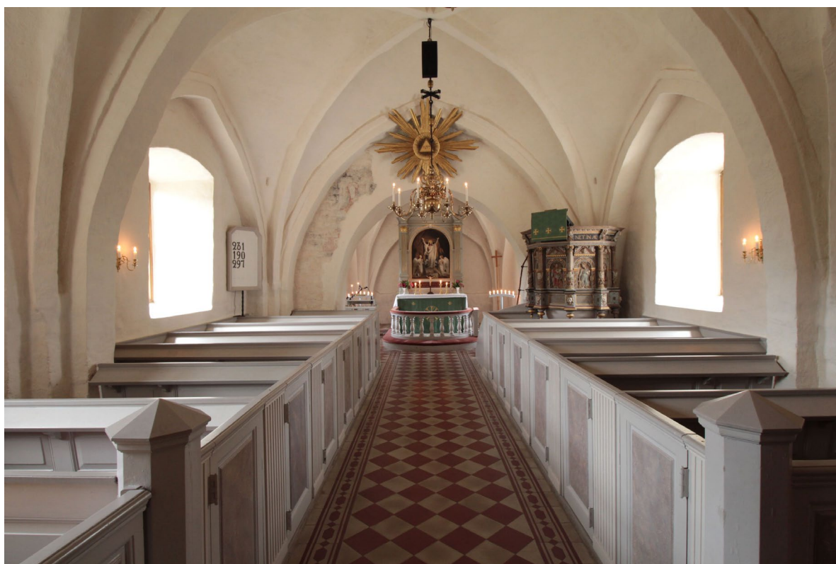
Kyrkorummet sett från väster.

Utöver uppgången till tornet har kyrkan två ingångar. En i vapenhuset från söder som utgör kyrkans huvudingång samt prästingången från öster. Bortsett från fönstret i vapenhusets västra fasad, som är placerat i en ensprångig nisch, sitter kyrkans samtliga fönster i liv med fasaden. Fönstren som är målade med oljefärg i guldockra är alla placerade i stickbågiga muröppningar. Samtliga tillkom vid Græbes restaurering 1949–50.