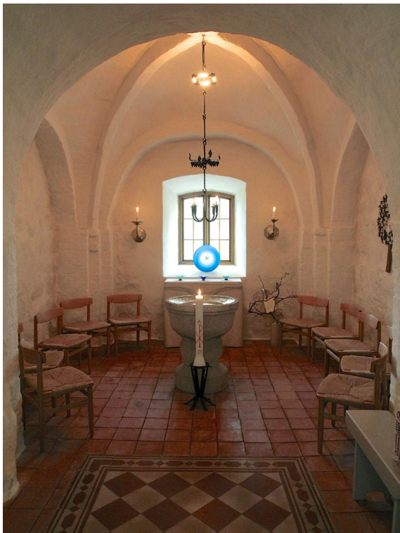
Dopkapellet som inreddes i tornets bottenvåning 1991.