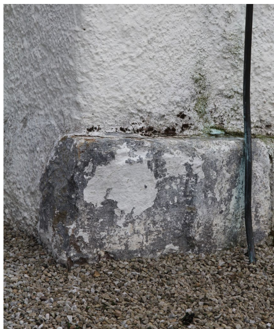
Bland annat på korets nordöstra hörn syns den blågrå färg som målades på när hörnen kvadrerades 1727.