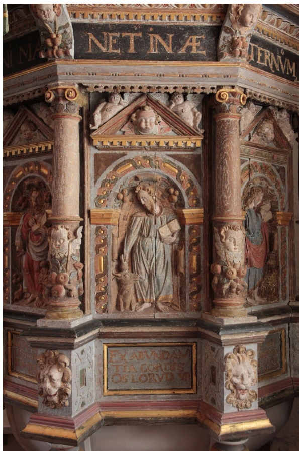
Predikstolen från 1600-talet är rikligt dekorerad med tidstypisk ornament. I fyllningen i mitten står Lucas som ett håller tag i tjurens horn.

Predikstolen tillverkades i början av 1600-talet. Dess karnisformade nedre del vilar på en oktagonal pelare. Korgen har åtta sidor, varav fem utgör själva fasaden. Sidorna har fyllningar i vilka de fyra evangelisterna samt Paulus finns placerade i rundbågiga fält, bärandes varsin bok samt sina respektive attribut. Sidornas hörn markeras med joniska kolonner försedda med bevingade puttiansikten i dess nedre partier. Sockeln under figurerna har rektangulära textfält och lejonhuvuden under kolonnerna. Ett svart textband med bokstäver i guld finns placerat i krönet ovan speglarna. Predikstolens bemålning i rött, blått, grått, svart och guld frilades i mitten av 1950-talet.