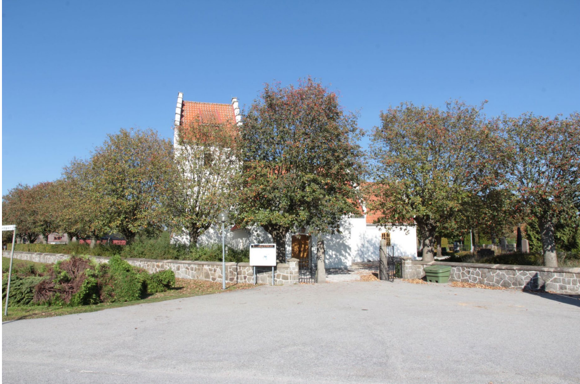
Revinge kyrka från söder. Kyrkans ingång markeras av två stenstolpar och grindar i svartmålat smidesjärn.

Området har varit boplats sedan tidig medeltid. På andra sidan om byvägen, något sydöst om kyrkogården, ligger byskolan som är uppförd i tegel. Området runt skolan består i huvudsak av villabebyggelse uppförd under 1900-talets andra hälft.