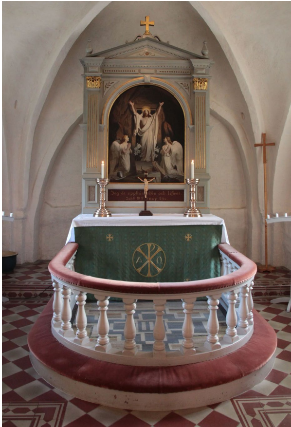
Altarring, altaruppsats och altare. Notera skivstakarna från 1500-talet som står på altaret.

Koret i öster har samma bredd som långhuset och delas av från långhuset genom den rundbågiga triumfbågen. Koret har två fönster, ett åt norr och ett åt söder. Bakom altaruppsatsen döljer sig ett textilskåp och i korets östra mur finns en prästingång. Dörren i prästingången består av brädor och har svartmålade smidesgångjärn och klinklås. Ovanför dörren finns en markering i putsen för ett igensatt östfönster.