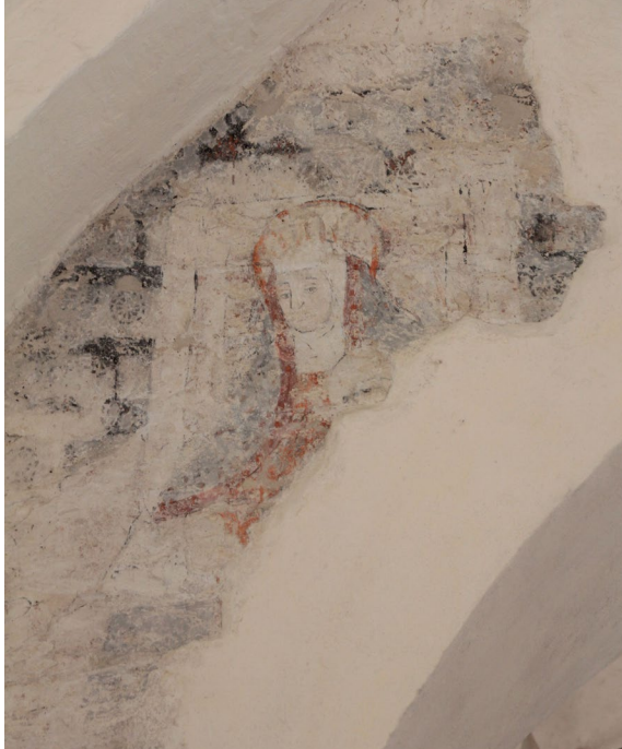
Målningen som påträffades på triumfbågs- väggen 1991.