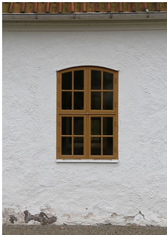
Tittar man noga på putsen runt fönstren är det möjligt att se hur mycket större fönsterhålen var innan Eiler Græbes restaurering 1949–50.

Koret är något lägre än långhuset och är till stor del uppfört i samma tegel. Gaveln är försedd med medeltida blinderingar. I dess nordöstra hörn finns en sandstenskvader med gråblå bemålning. Både korets och långhusets hörn kvadrerades år 1726 med kvaderstensimiterande bemålning i gråblå kulör. Den gråblå kulören erhöles genom att man blandade i lindkol i kalkfärgen. Samtliga av kyrkans fasader bär en vitkalkad spritputs och avslutas upptill av en gesims med två mursprång. Spår av en underliggande ljusröd, men även ljusgul, kalkfärg kan skönjas på flera ställen på långhusets södra