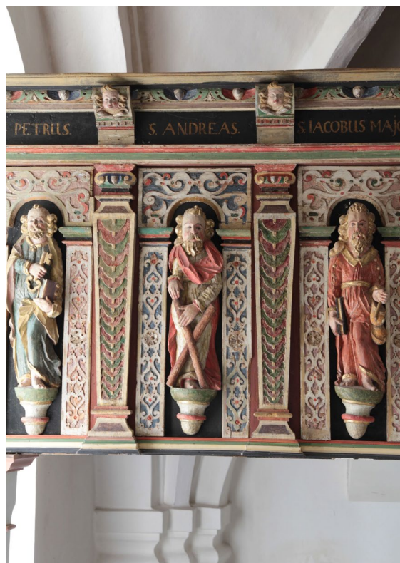
Detalj av läktarbarriären från omkring år 1600.

Långhuset, korsarmarna och koret har sekundärt inställda kryssvalv som, trots att de tillkommit med fyra hundra års