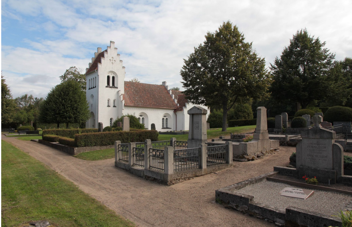
Kyrkogårdens sydvästra del.

har renoverats åren 1915, 1925 och 1979. Orgelfasaden är tredelad och har ett enkelt utförande i nygotik med ekådringsmålat trä och förgyllda accenter.