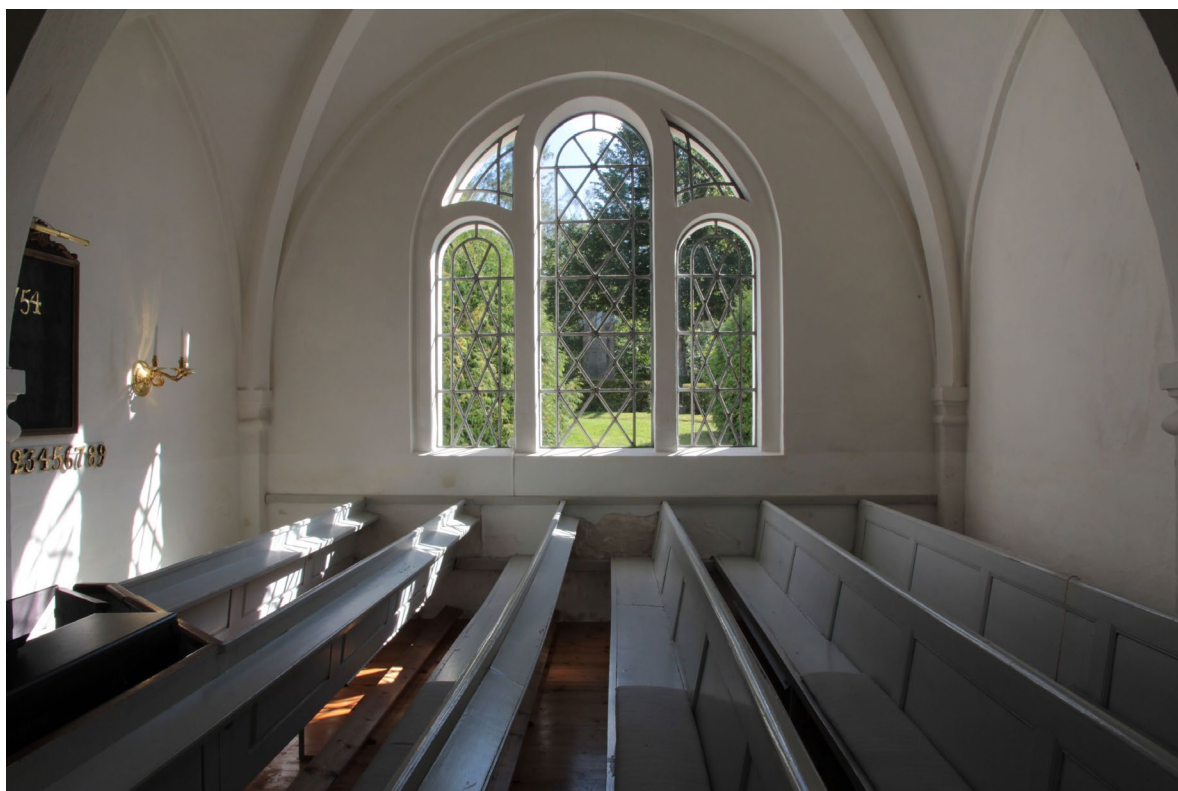
Den södra korsarmen. Även korsarmarnas bänkar behåller sin östliga riktning.

Orgelläktaren är belägen i kyrkorummets västra del och har samma bredd som kyrkorummet. Läktaren byggdes om vid restaureringen 1870–71 och vilar på sex pelare med samma bemålning som kyrkbänkarna (grått med detaljer i rödbrunt). Den polykromt bemålade läktarbarriären har träsniderier föreställande de tolv apostlarna, vilka är placerade i rundbågar med Kristus i mitten. Bortsett från änglahuvudena och pilastrarna som är gjorda i ek är barriären utförd i furu. Barriären är sammansatt av delar från flera epoker och dess exakta ålder är inte känd, men troligen härrör den i huvudsak från 1600-talet. Eventuellt kan delar ha återanvänts från något tidigare inventarium, möjligen delvis från en tidigare läktarpredikstol.