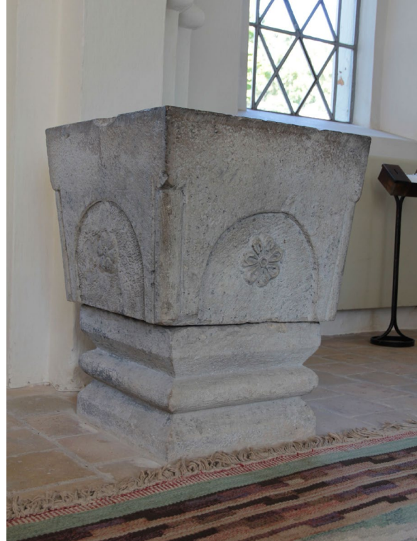
Dopfunten från 1200-talet.

Dopfunten från 1200-talet är kyrkans äldsta föremål och är tillverkad i sandsten från Höörtrakten. Cuppan är kvadratisk och vilar på en profilerad bas, även den kvadratisk. Dess sidor är dekorerade med varsin rundbåge i vars centrum en palmettrelië finns placerad. Vid 1695 års prästmöte beslutades att dopfunten skulle flyttas upp i koret ”såsom sed i övre Sverige”.