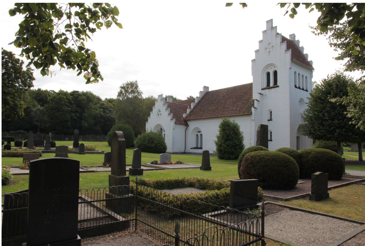
Kyrkan sedd från nordväst.