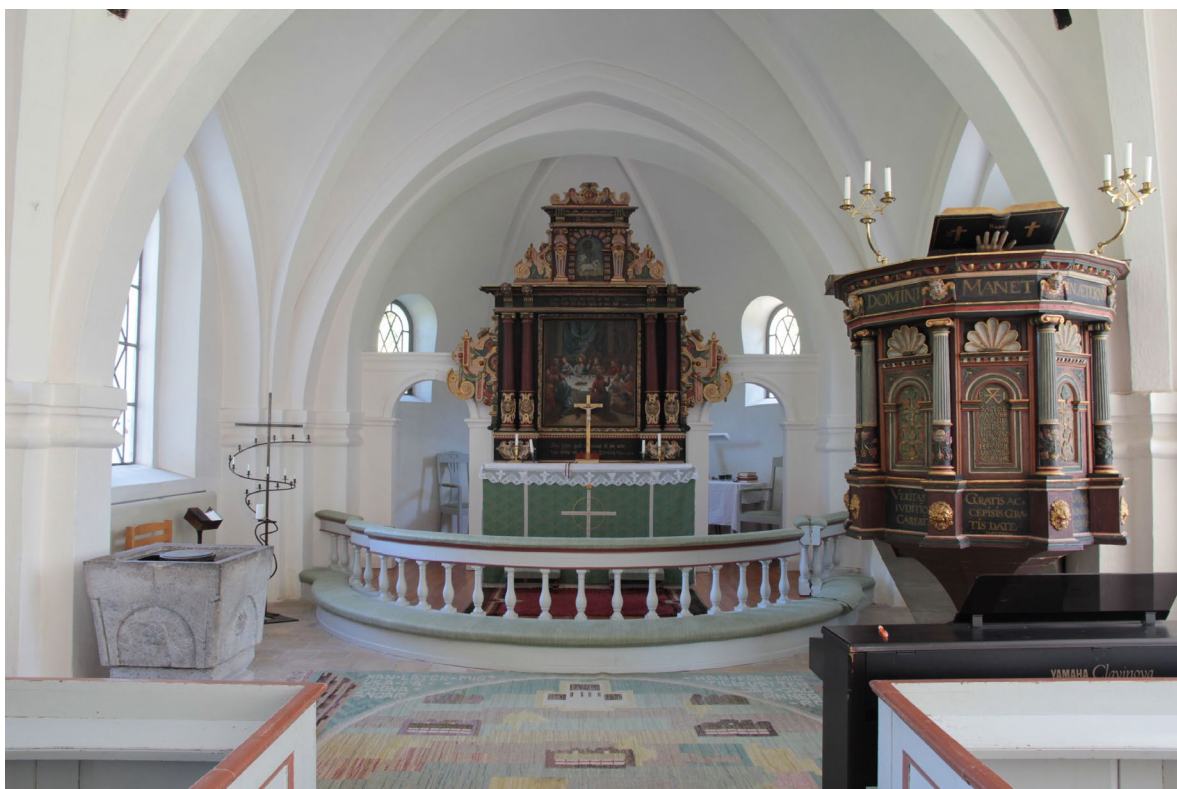
I koret ligger en ryamatta från 1940 föreställande kyrkan och de sju Rabygårdarna som låg i utkanten av byn.

Kyrkans klockvåning och vind nås genom en trång trappgång i vapenhusets norra sida. En ingång från tornets andra våning leder in till långhusvinden. Den ursprungliga uppgången till vinden skedde genom en lucka i långhusets sydvästra valvkappa, vilket idag syns som en ilagning. Takstolarna över långhuset består till största del av bilad furu från 1700-talet. Hanbjälkarna är i ek och uppvisar flertalet äldre urtag och hak. Sannolikt har de återanvänts från ett tidigare medeltida taklag. Det nuvarande taklaget plockades troligen ner och återrestes vid restaureringen 1870–71.