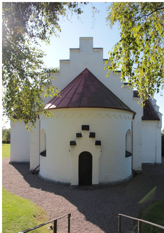
Korabsid med prästingång.

Kyrkans yttre präglas av restaureringen 1870–71. Att långhuset är äldre än övriga delar avslöjas enbart av sockeln som har ett mer oregelbundet uttryck i grovt tuktad sandsten. Murarna i långhuset och tornets nedre del hör till kyrkans äldsta partier och är uppförda i gråsten, vilka sammanfogats med