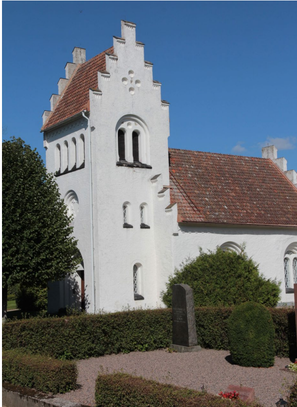
Kyrkans västtorn och långhus är försedda med trappsteggavlar.

murad i gult stortegel ställt på högkant. Tornets grund utgörs av resterna av ett äldre torn.