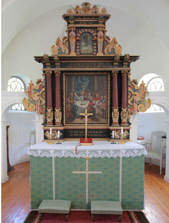
Altare och altaruppsats från sent 1500-tal. På sidorna syns den murade skärmväggen.