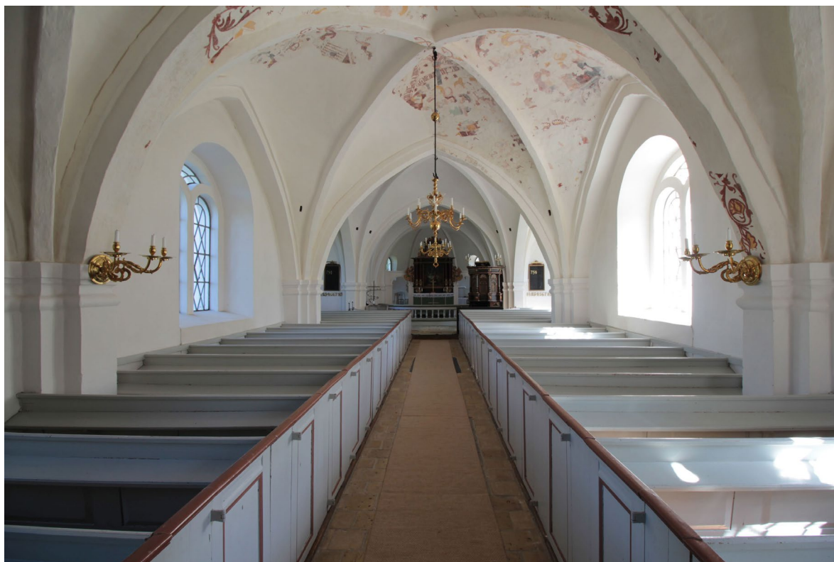
Kyrkorummet sett från väster. Valvens kalkmålningar är partiellt framtagna.