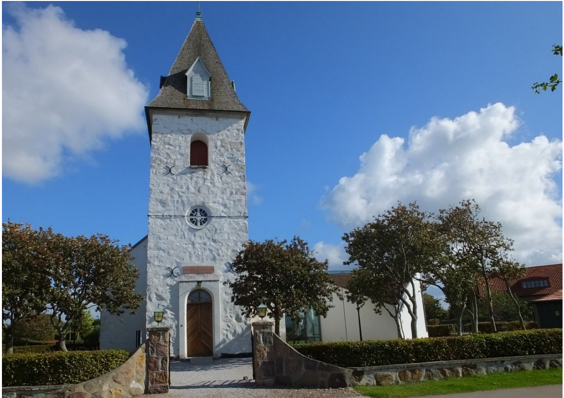
Vikens kyrka sett från väster. Till höger om tornet skimtar Skeppet, tillbyggnaden från 2013.

består av en kvadratisk byggnadskropp, diagonalt ställd mot långhuset och ansluten till dess södra sida genom en glasad korridor.