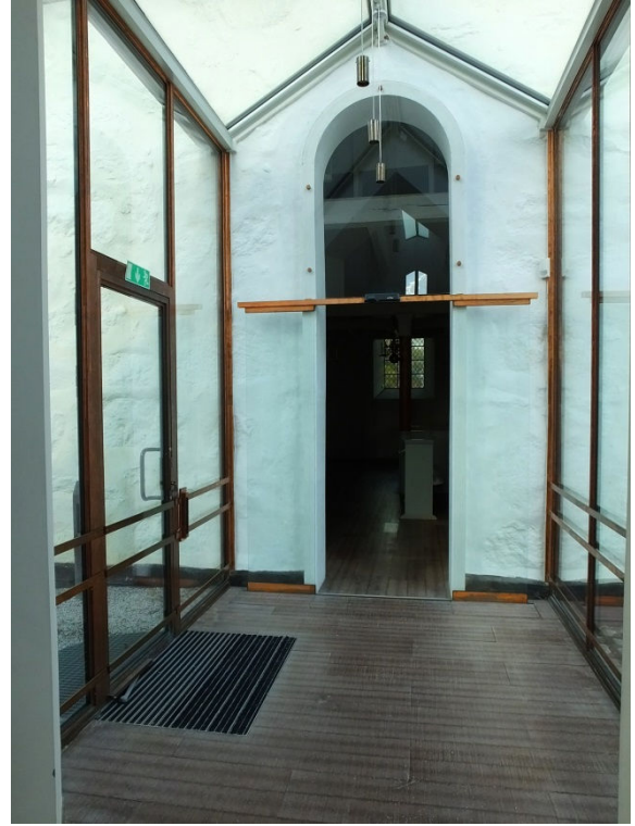
Till vänster syns samlingsalen i den nya tillbyggnaden. Bilden till höger visar passagen mellan Skeppet och långhuset, sett från söder.

listverk. Listverket och pilastrarna är marmoreringsmålade. På ömse sidorna av altaret finns ingångar till sakristian. I de stickbågiga öppningarna sitter gråmålade spegeldörrar. Predikstolen från 1700-talet står vid långhusets norra sida med uppgång från koret.