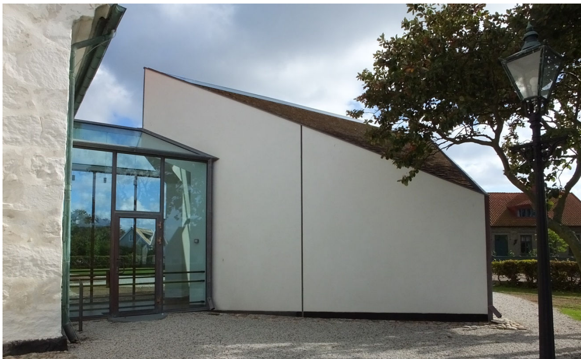
2013 års tillbyggnad Skeppet, sett från väster. Mellan långhuset och Skeppet finns en glasad passage med ingång från väster.

sida. Stenen är av röd natursten och anger kyrkans byggnadsår. En ljudöppning i vartdera väderstrecket finns och till tornets andra våningsplan finns också ett rundfönster. Kyrkans fönsterbågar består av inmurade småspröjsade gjutjärnsfönster från 1866 med undantag av tornets rundfönster som är av trä. Ljudluckorna är utförda som skjutluckor av trä. I torntaket takfall finns takkupor av grågrönmålat trä (kopparärgad nyans) med sadeltaksavtäckning och rundbågsformade öppningar täckta av träluckor.