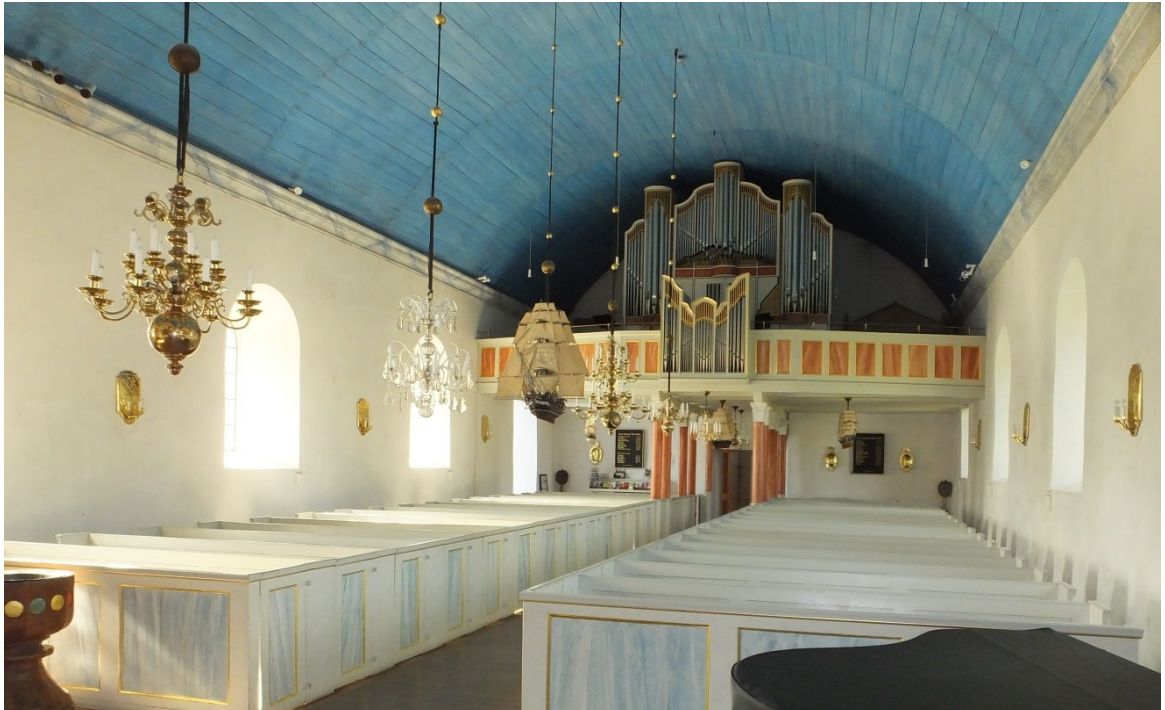
Långhuset sett från koret mot väster.

Äldsta orgelfasaden är från 1846 och utförd i stram klassicerande stil i grått och guld med pilastrar, tandsnittslister och en trekantig gavel krönt av en strålsol. Orgelfasaden från 1900 ritades troligen av Ture Zetterström och är utförd i det sena 1800-talets stileklekticism. Fasaden har synliga pipor och är dekorerad med pilastrar, akroterier och voluter samt målad i grått och guld.