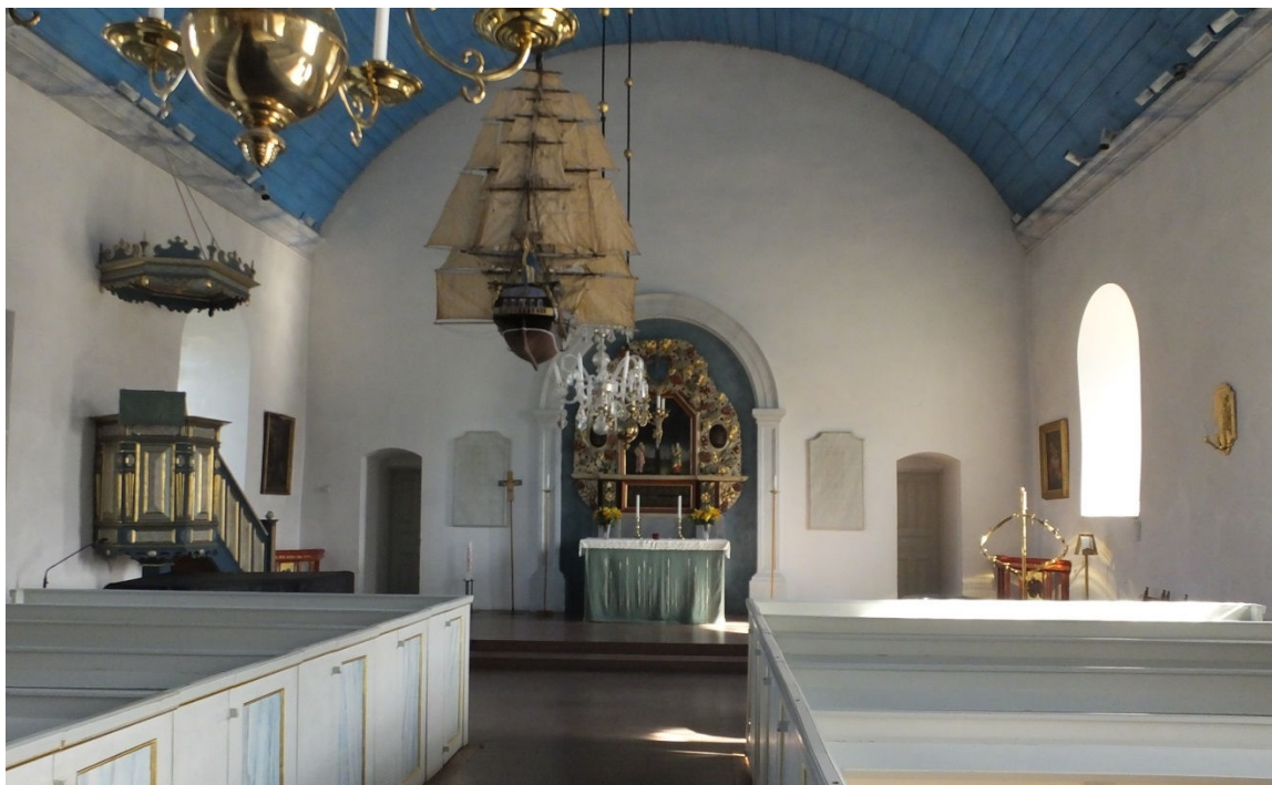
Långhuset sett mot koret i öster.