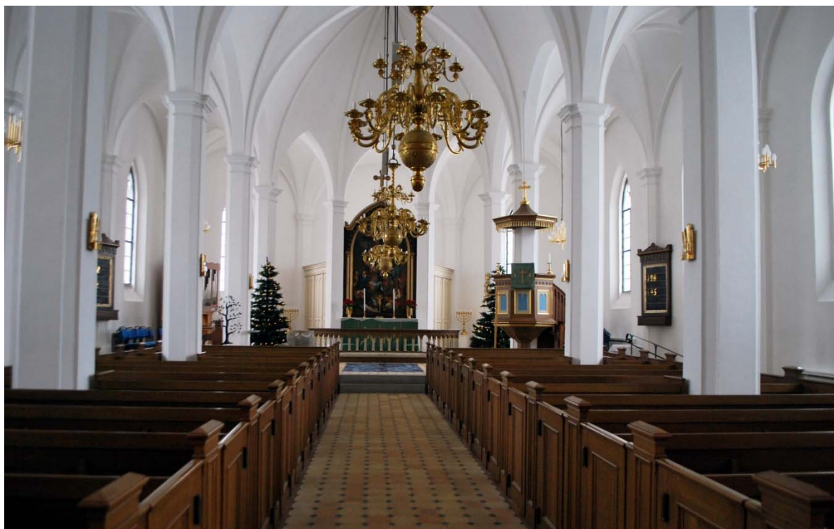
[3]: Långhuset mot koret

kryssvalv med kvadratiska ribbor. Valvbågarna vilar på avfasade pelare och pilastrar med profilerade kapitäl. Den slutna bänkinredningen är indelad i två fritt placerade kvarter, satta på ett golv av kvadratiska, gula klinkerplattor.