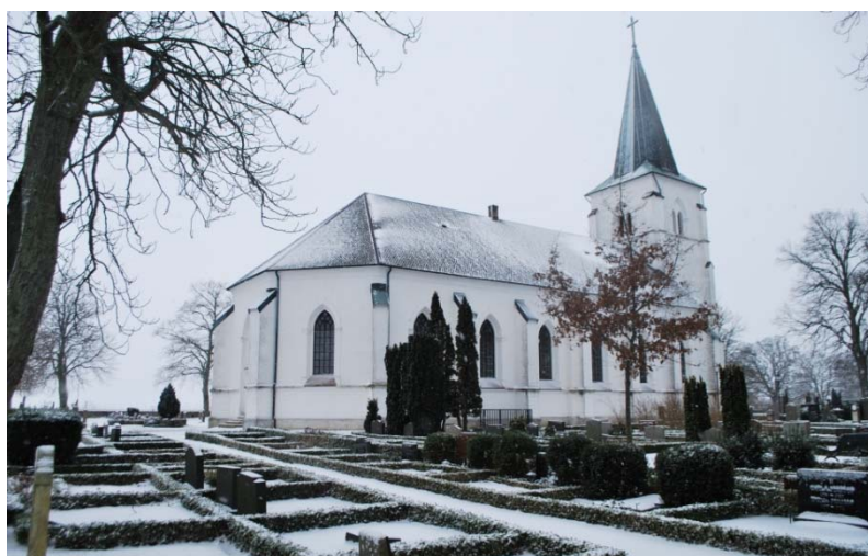
[1]: Kyrkan från nordost

Kyrkorummet täcks av ett valmat sadeltak belagt med klovad och rakhuggen skiffer, som spikats till underlagstaket av bräder. Tornspiran är täckt med koppar från 1969, lagd i skivtäckning med halvt förskjutna takfalsar, monterad på ett brädunderlag.