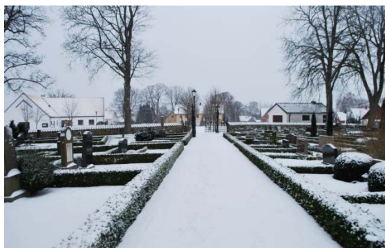
[6]: Buxbomsinfattade gravar, axel mot f.d. skolan