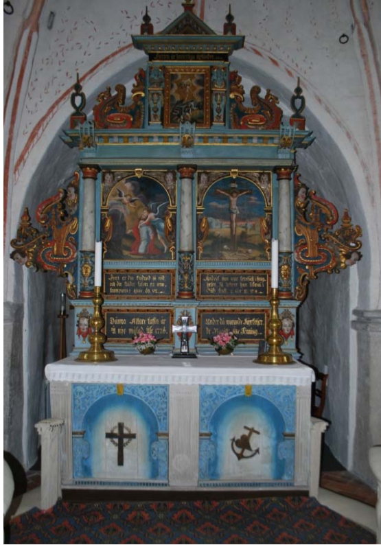
[4]: Altarupsats, altemensale