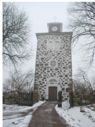
[2]: Tornet från söder