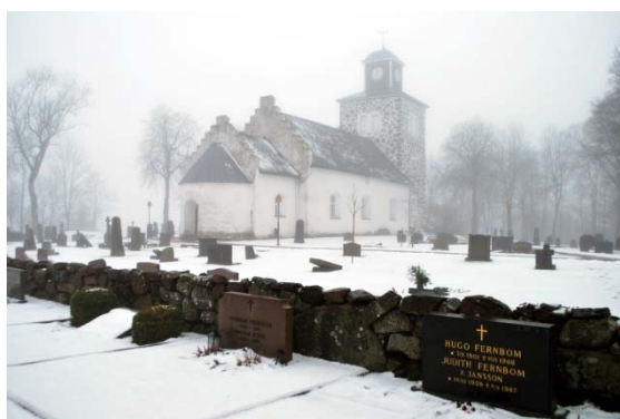
[6]: Östra kallmuren, vy mot äldre kyrkogården

Den äldre delen av kyrkogården omges av en kallmur. Huvudentrén i väster har ett tredelat grindparti i sirligt gjutjärn innanför gjutjärnsstolpar, medan den i norr har en likartad dubbelgrind innanför granitpelare. Från de båda ingångarna leder grusgångar upp mot tornet och sakristian. Gravkvarteren är genomgående grästäckta med några nyplanterade träd fritt utplacerade. Gravstenarna står i rader, inramade av stenkant eller utan yttre avgränsning. Många gravplatser är vakanta. Arbete pågår med att omgjuta och dubba de idag många liggande stenarna. I gravmaterialet dominerar medelhöga, svarta granitstenar med kors eller bruten topp och delade socklar, typiska för tiden runt förra sekelskiftet. Bland gravvårdarnas titlar märks ett flertal lantbrukare, liksom någon folkskollärare och sparbankskamrer från Tåstarps storhetstid, men det finns även många stenar utan titel. Den äldsta stenen är en skånsk kalkstensvård från 1813. I nordvästra hörnet finns ett enkelt lapidarium med bl.a. några järnkors.