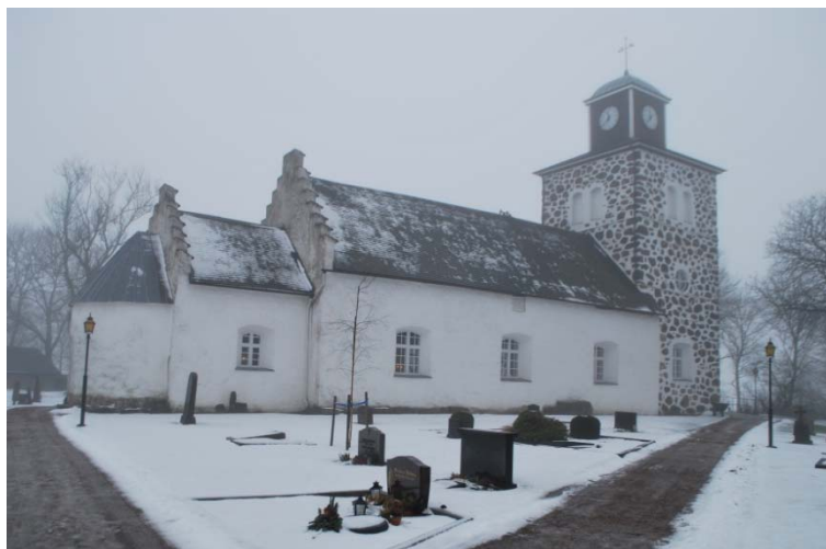
[1]: Kyrkan från nordost

Absidens hjälmtak täckts av blyplåt på underlag av råspont och papp. Långhusets och korets sadeltak är täckta med tjärade furuspån från 1840 som spikats på träpanel. Den något utkragande takfoten har ett tjärat underslag. Murarna saknar gesims, kanske kan en förkroppning anas på korfasaderna. Kor- och långhusgavlarnas trapptinnar är avtäckta med tegelpannor. Torntaket är ett avskuret, flackt tälttak, inbrädat och täckt med enkelfalsad koppar i skivtäckning med halvförskjutna hakfalsar. På taket står en lanternin, klädd med brun locklistpanel och avslutad av en karnisformad kopparhuv.