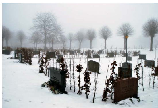
[7]: Nya delen av kyrkogården, vy mot nordost

På östra sidan om kallmuren [6] kring den äldre kyrkogården finns en utvidgning [7], som i norr, söder och öster inramas av en krans med hamlade lindar. Träden står på en låg slänt som bildar gräns mot det omgivande landskapet. Mot parkeringen finns en entré med murade, granitavtäckta pelare och gallergrindar i gjutjärn. Gravplatserna är