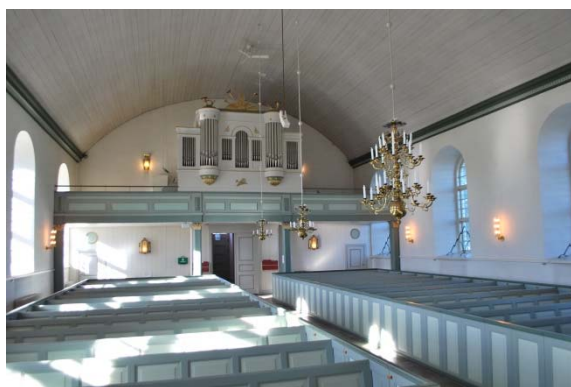
Långhuset mot orgelläktaren i väster.