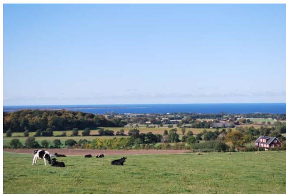
Utsikt från kyrkogården.

Kyrkan har två ingångar, huvudingången genom tornet i väster och en prästingång i sakristian i öster. Västporten sitter i en rundbågig öppning med raktäcktt dubbeldörr och ett lunettfönster av trä ovanför. En sten med inskription är infälld ovanför lunettfönstret. Östingångens öppning och dörr är segmentbågig. Ovanför finns två slätputsade lister, ”ögonbryn”. Dörrarna från 1963 av ramverk med fyllningar är klädda på utsidan med kopparplåtar. Granittrappor leder till dörrarna.