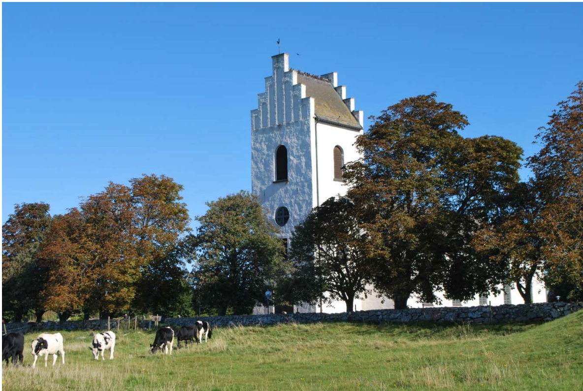
Tornet mot sydväst.