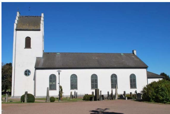
Fasad mot söder.