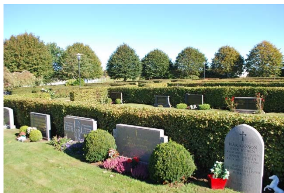
Nya kyrkogården från 1957.

Utvidgningen från 1957 har kvarter indelade med avenbokshäckar och gravstenarna placerade längs rygghäckar. Genom kvarteren är gångar av kalksten i gräsmattan, mellan kvarteren är singelgångar. Gravstenarna är låga och horisontella. Minneslunden med ett högt träkors och en natursten med symboler för tron, hoppet och kärleken är placerad längst i väster nära stenvuren med utsikt över havet.