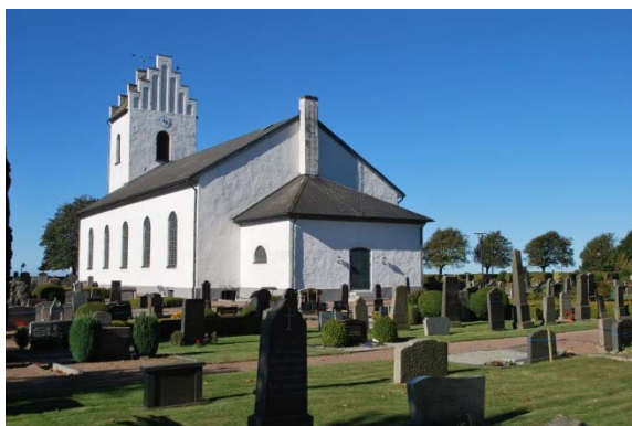
Fasad mot sydöst.

Kyrkan är grundlagd på gråsten och murarna är uppförda av gråsten. Kyrkan är spritputsad och vitmålade med silikatfärg. Portarnas smygar är slätputsade. Sockeln är utkragande, spritputsad och gråmålad. Långhus och sakristia är utan dekorationer. Tornet har sedan 1873 trappstegsgavlar med sju tinnar. Under tinnarna finns långsmala höga rundbågiga nischer så kallade blinderingar.