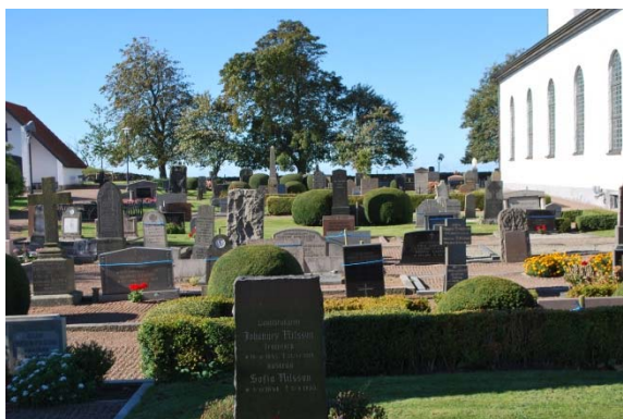
Kyrkogården söder om kyrkan.

lantbrukare men flera sjökaptener finns också. Här finns obelisker, naturromantiska stenar utformade som trädstammar blandade med lägre nyare horisontella stenar. Bakom bårhuset finns en asklund från 2013, en liten kulle med låg växtlighet med liggande stenar med namnbrickor. Kullen omges av cortenstål och en gång av betongsten.