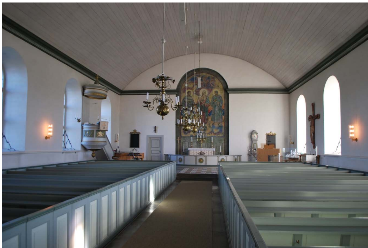
Långhuset mot altaret i öster.

bordsaltare, digitalorgel, skåp, stolar, glasmonter med skepp och golvur. I norr finns predikstol, flygel, ljusbärare och en kyrkvärdsbänk. Innanför den täta altarringen är golvet täckt med en rödbrun textilmatta. En kristallkrona hänger i taket i koret. På korväggen fortsätter långhusets grönmålade taklist fram till en hög rundbågig nisch med en freskmålning från 1923.