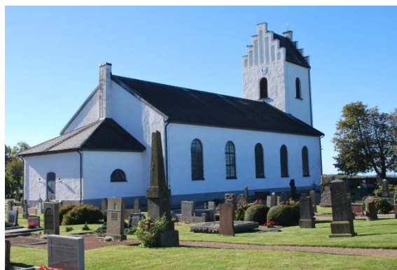
Fasad mot nordöst.