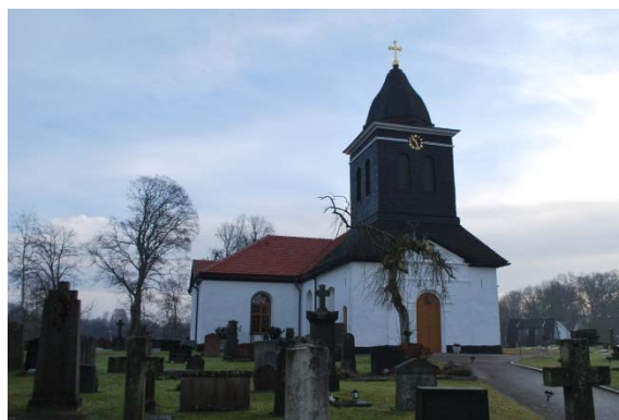
Fasad mot nordväst.

Kyrkan har stora ockragula träfönster i rundbågiga slätputsade öppningar. Fönstren tillkom troligen 1846, en del bågar mot söder är utbytta. Fönsterbågen består av fem lufter som är spröjsade. Invändigt är fönstren vita. Innerfönster tillkom 1947. Fönstren avslutas uppåt med en lunett förutom i tornet vars fönster är rakslutna. Solbänkarna täcks av kopparplåt, förutom absidens solbänk som är av huggen granit.