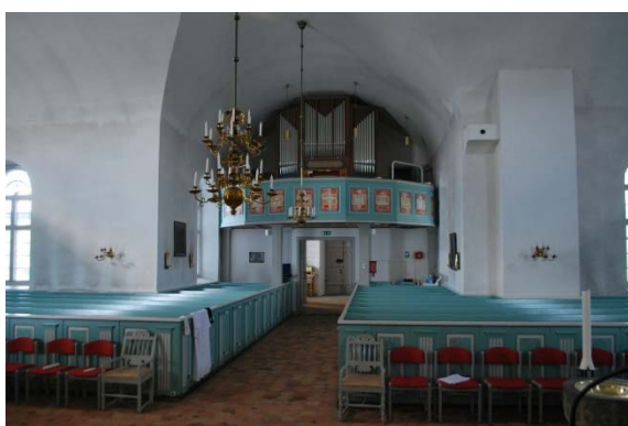
Mot orgelläktaren i väster.