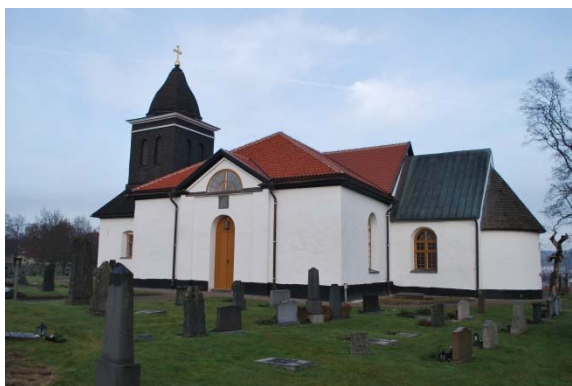
Fasad mot söder.

Kyrkans murar är mestadels uppförda av gråsten. Till vissa delar som portalerna, gavelröstet mellan långhus och kor och hela absiden är tegel använt. Tornets övre del är timrad och klädd med tjärade spån. Fasaderna är spritputsade och vitkalkade med slätputs i muröppningar och lisener. En betonggjuten nedgång finns till källaren under norra korsarmen. Sockeln är putsad och tjärad.