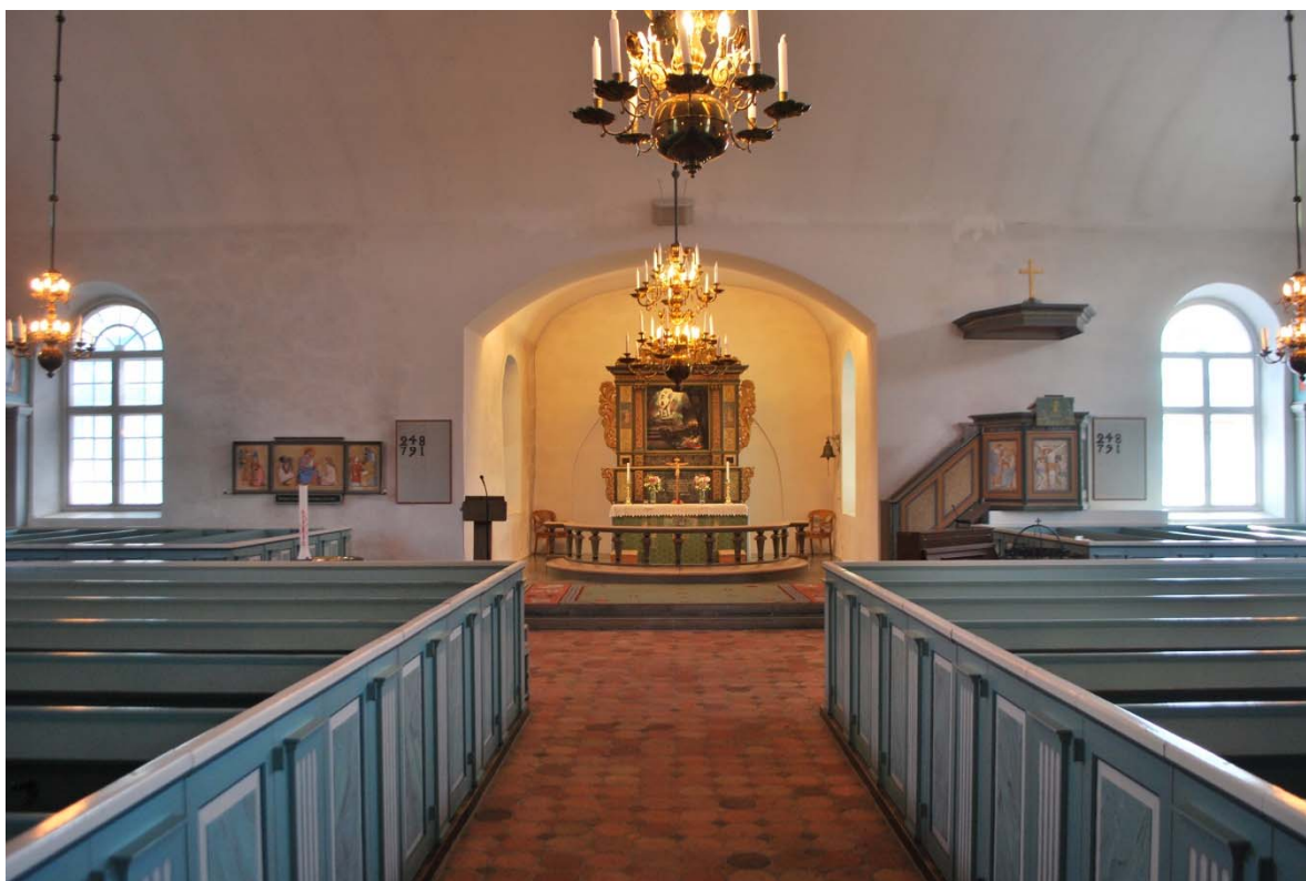
Långhuset mot koret.