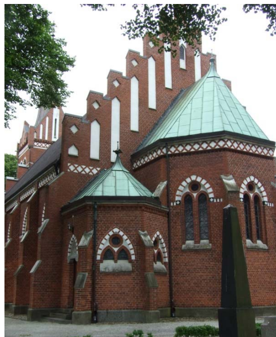
[2]: Polygonalt kor och sakristia med pyramidtak