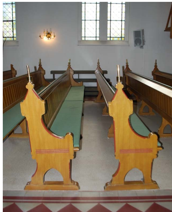
[7]: Ursprungliga bänkar