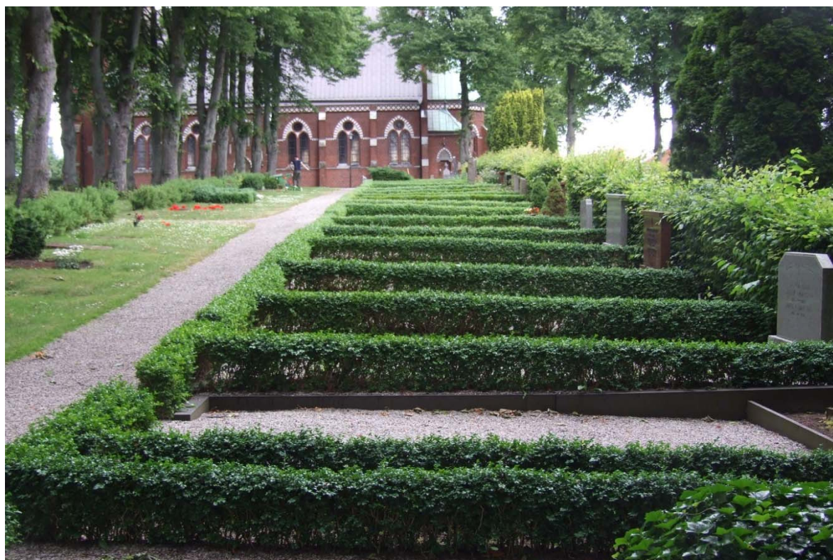
[9]: Mellersta kyrkogården

Den västra delen från 1939, som på alla sidor omges av avenbokshäckar, efterbildar med sina terrasseringsar den första utvidgningen. I söder finns en trappa i granit ut mot byvägen, med en svartmålad järngrind innanför grindstolpar av sten. Området har, precis som den mellersta och östra delen, en huvudgång i nord-sydlig riktning, och tvärgångar ut till gravkvarteren. Växtligheten domineras av buxbom, som omger de flesta kvarter och gravplatser samt avgränsar kvarteren i form av högre rygghäckar.