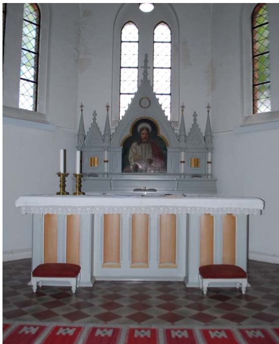
[5]: Altare och altarpupsats

manualer och självständig pedal, och har ett helmekaniskt system med slejflådor. Spelbordet är vänt mot åhörarna och koret. Fasaden är i nygotisk stil, och precis som altarpupsatsen indelad i tre partier, utformade med spetsiga gavlar och åtskilda med fialer och kolonner. Orgeln renoverades 2014.