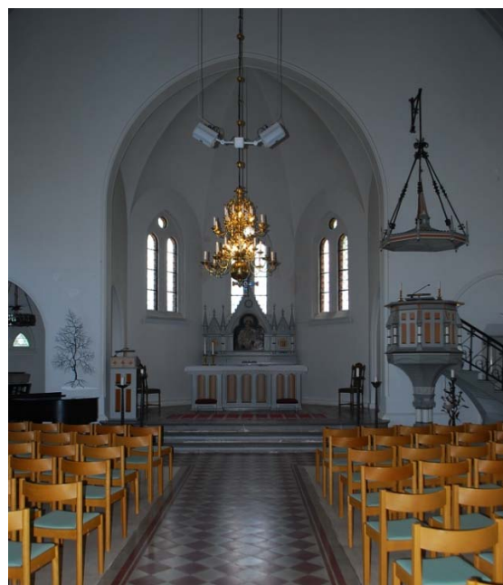
[4]: Långhuset sett mot det upphöjda koret