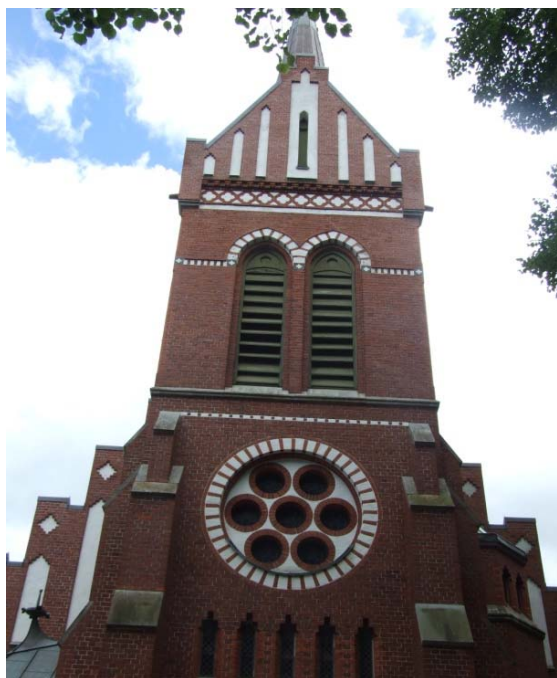
[1]: Tornets västfasad

Långhuset har ett högre sadeltak, medan tornets tillbyggnad, kor, sakristia och dopkapell åt öster har pyramidtak. Det södra vapenhuset har ett sadeltak. Gesimslisten mellan tak och vägg är utformad som en hålkälslist, och där under ett skift med profiltegel som vilar på ett tandsnitt. Mellan dessa finns på långhus och kor en fris med fyrpassbågar av tegel mot en vitputsad bakgrund, ett tema som återkommer i listverket nedanför tornets gavelrösten. Tornet har ett korstak, i vars mitt det står en åttasidig spira, och trapptornet ett kägeltak. Alla takytor är täckta med enkelfalsad kopparplåt i skivformat med måttligt förskjutna hakfalsar.