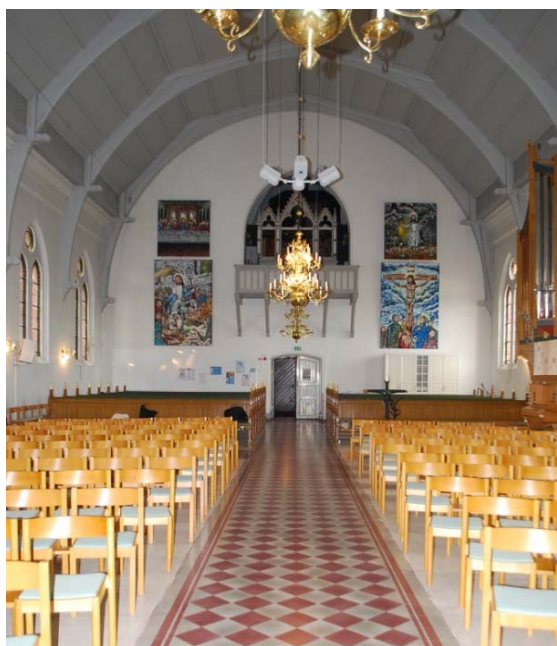
[3]: Långhuset sett mot vapenhuset

Koret och dopkapellets golv är, liksom långhusets gångar, belagda med röda och vita viktoriaiplattor. Sakristians golv är täckt med plastmatta. Bänkkvarteren har golv i beige terrazzo, som övergår direkt till gångarnas klinker. Förutom ett antal öppna bänkar består sittmöbleringen av lösa stolar placerade i vinkel till altaret.