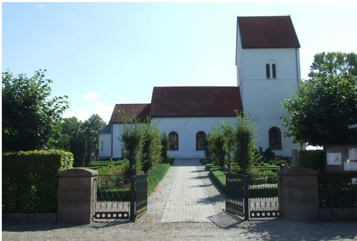
[5]: Kyrkogården sedd från huvudentrén

pargrind i gjutjärn och enkla gånggrindar på ömse sidor, flankerade av grindstolpar av murade granitblock [5]. Från entrén strålar en grusad, delvis stensatt gång, upp mot kyrkans två entréer och vidare till ekonomibyggnaden i sydväst. Bakom denna finns en liten ingång utan grind som leder till en kompost strax utanför kyrkogården.