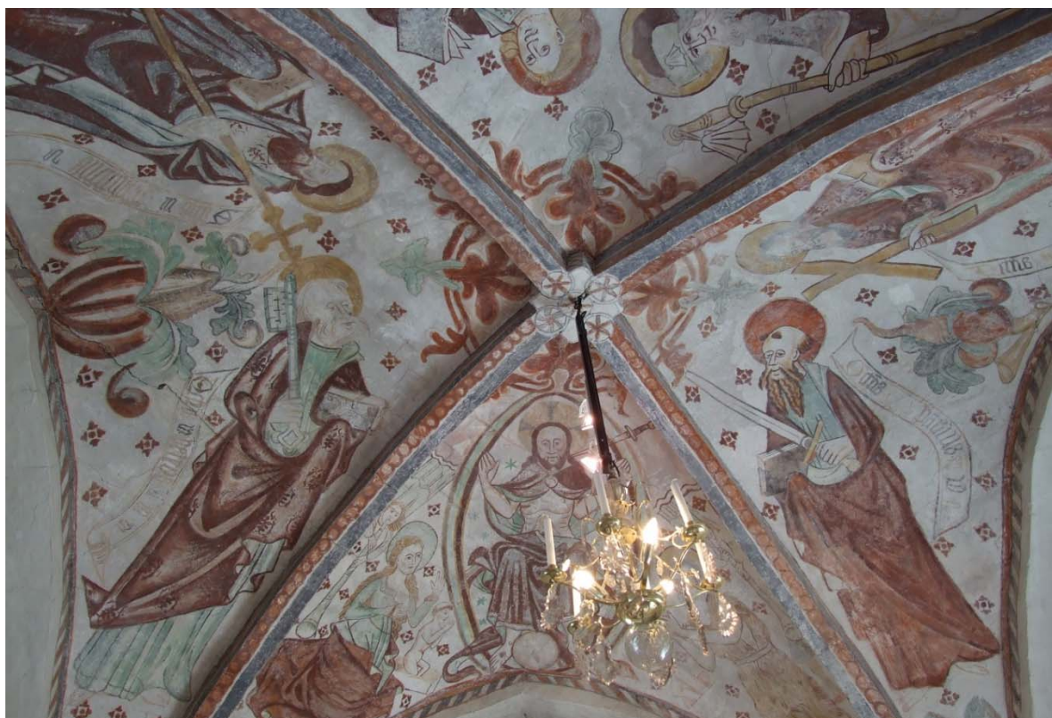
[2]: Kalkmålningar i koret

orgelläktarens nordvästra hörn. Takstolarna över tornet är av fur, uppbyggda med underramar, dubbla stödben, sparrar samt dubbla hanband. Taktronen utgörs av spontad träpanel. På tornets tredje våningsplan står kyrkans klockbock av fur. Takstolarna över långhuset, av fur med inslag av sekundäranvänt ekvirke, har underramar, vertikala stödben, två hanband och sparrar som underlag för undertaketets inbrädning. Valven är oisolerade. I den norra- och södra muren märks spår av de ursprungliga, romanska fönsteröppningarna. Takstolarna över koret är av fur och sekundäranvänd ek, resta på dubbla lejder med tassar, stödben, sparrar och hanband. Långhusets- och korets taktrön består av spontad träpanel.