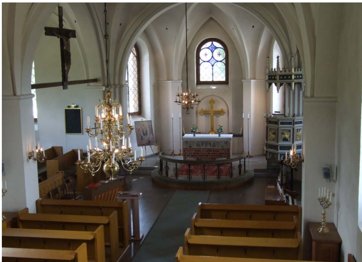
[4]: Interiör mot koret

Innanför altarringen är golvet förhöjt cirka 25 cm. I östra korväggen bakom altaret finns en rundbågigt täckt nisch med en kalkstenshylla där det förgyllda altarkorset står uppställt. Nischen minner om var ytterdörren till den tidigare sakristian var placerad.