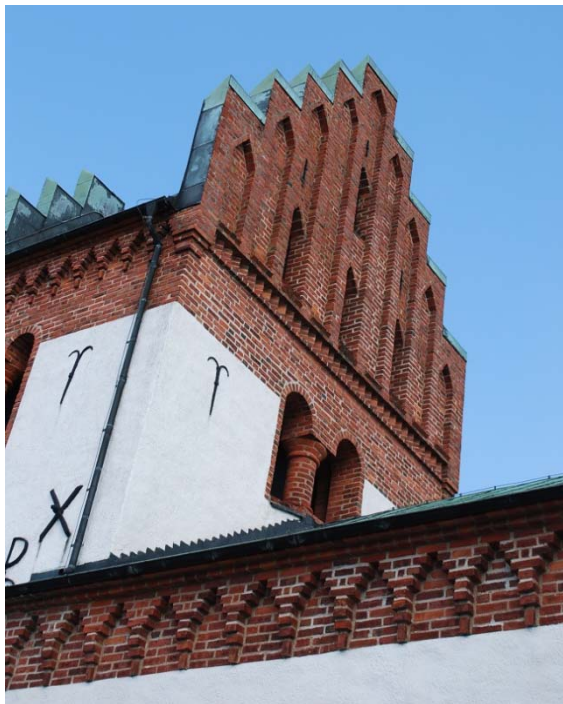
[1]: Trappstegsformad torngavel, droppstenslist

Samtliga öppningar är rundbågiga, undantaget de smala spetsbågiga öppningarna på tornets och korsarmarnas tegelrösten. De är alla inramade av oputsat, rött tegel i två språng, och har kraftigt snedställd solbänk av tegel lagt på flatan. Fönstrens spröjsverk har en gemensam nedre del av två rundbågigt täckta partier med diagonalställda blyspröjsar, och överst en varierad del med geometriska former [2]. Långhus- och tornfönster har en ruterform, i vilken finns ett blommotiv av färgat dekorglas inskrivet mellan bågarna. Det mittersta korfönstret är speciellt rikt utformat. I tornet finns ljudöppningar i alla väderstreck, utformade som kopplade rundbågiga fönster skilda av en tegelpelare med kraftig bas och koniskt kapital. Ljudluckorna är av svartmålad panel.