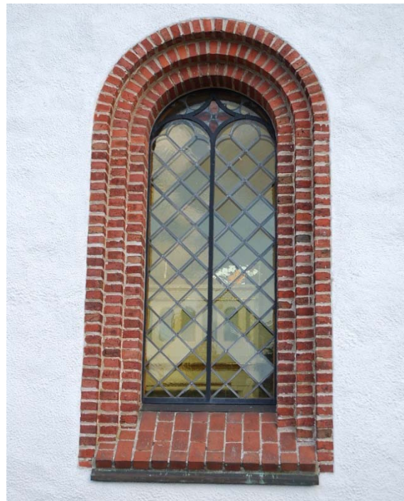
[2]: Långhusfönster med tegelomfattning

Kyrkan har en huvudentré i tornet och sekundära entréer på korsarmarnas gavlar. De tre portalerna är utförda som höga, rundbågigt täckta öppningar med omfattningar av oputsat tegel som vidgar sig i flera språng. De segmentbågiga ramverksdörrarna är utvändigt klädda med furupanel. Ovanför korsarmarnas portaler finns varsitt fönster, och i absidens mitt en igensatt dörröppning som blinderats med slätputs. Tornet nås utifrån via en rundbågigt täckt öppning utan tegelomfattning.