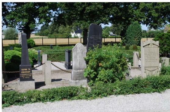
[6]: Gamla kyrkogården

Samtliga gravkvarter i den gamla- och mittersta delen av kyrkogården är täckta med singel. De enskilda gravplatserna är omgärdade av låga buxbom- eller ligusterhäckar, frånsett ett fåtal gravar som omgärdas av stenkant eller järnstaket. De enskilda gravarnas växtlighet domineras av städsegröna växter.