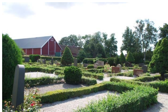
[7]: Mellersta kyrkogården

Kyrkogårdens nyaste del, som utgör kyrkans minneslund och urngravplats, ligger längst i söder omgärdad av diverse buskplanteringar. En svängd gång, som ansluter till Wåhllins gångsystem, leder genom fem stycken gräsbesådda ellipsformade rum, som vart och ett har olika funktion och delvis olika karaktär. I det mittersta rummet finns en minnesplats med bänkar och en stor granitskål för snittblommor. Växtligheten är mycket rik med olika träd, buskar och perenner. Väster om minneslundan ligger kyrkans parkering och en ekonomibyggnad.