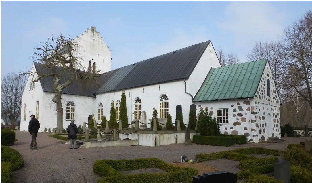
Kyrkan sedd från sydost. Intill korets södra sida ligger Thornhjelmiska gravvalvet

som långhuset. Tornets nedre del, upp till långhusets takfot är i likhet med de äldsta delarna av långhuset uppfört av kvaderhuggen sandsten. Detta bör ha varit tornets ursprungliga höjd som senare byggts på med ett gråstensmurverk under senmedeltiden. Ingång till tornet sker från dess norra sida via en sekundär trappinbyggnad av tegel som når upp till en ingång till andra våningen. Från tornvåningen finns en ursprunglig ingång till långhusvinden i öster. Långhusets västra gavel tycks vara bevarad ungefär i höjd med andra tornvåningen.