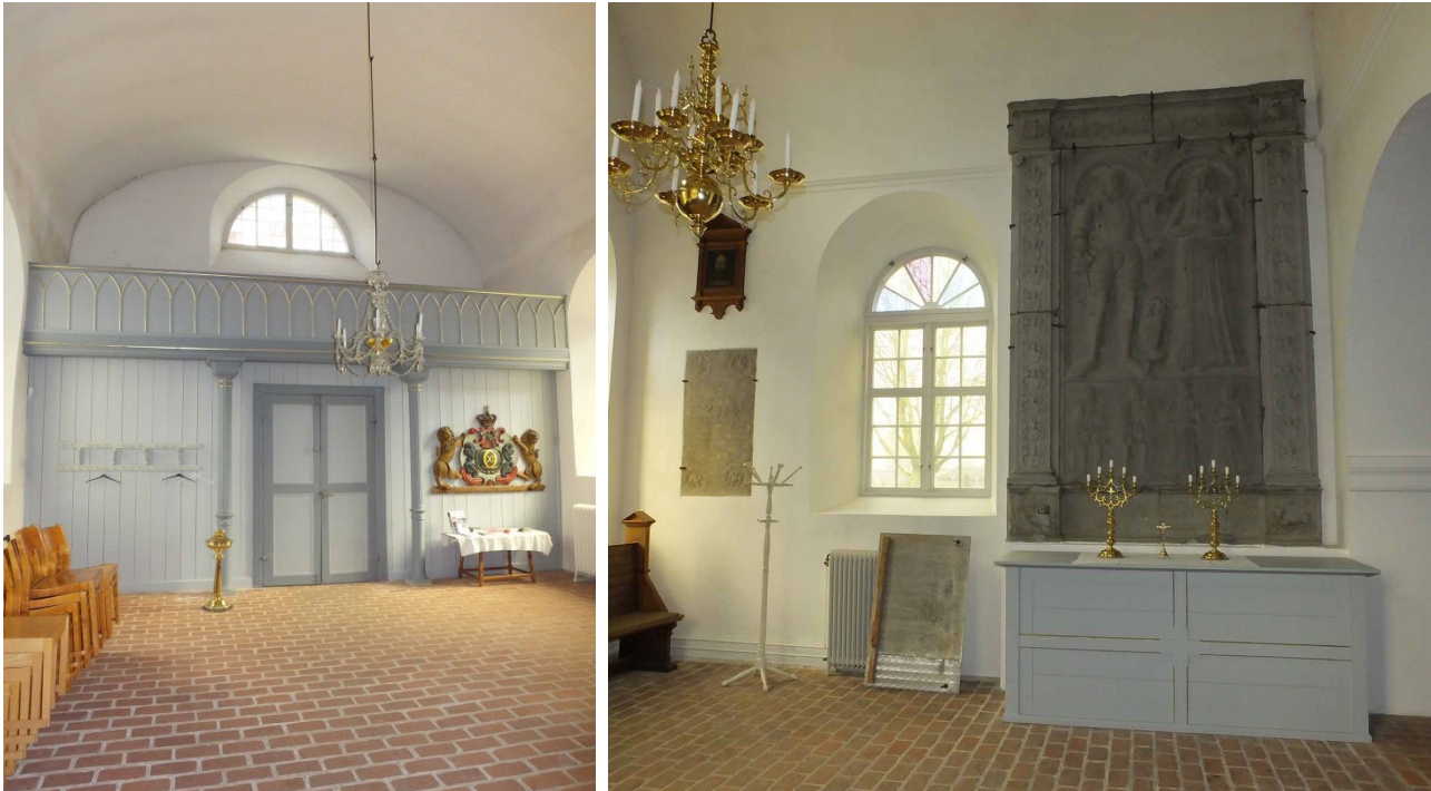
Bilderna visar till vänster vapenhuset i norra korsarmen och till höger södra korsarmen som är inrett till sidokapell.

i snidat trä. Innertak till korsarmarna utgörs av ett flackt putsat och vitmålat tunnvalv, troligtvis av reveterade brädor.