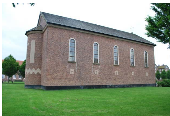
Kyrkan mot väster.

Kyrkans fönster är höga, smala, rundbågiga och omges av putsade, beigemålade omfattningar. Fem fönster finns på västsidan och fem på östsidan av långhuset, dessutom finns ett större rundbågigt fönster ovan portalen i söder. Fönsterbågarna består av profiljärn utvändigt och trä invändigt. Glaset är invändigt katedralglas och utvändigt klarglas. Varje fönster består av fyra spröjsade bågar placerade ovanför varandra. Till toaletten finns ett litet kvadratisk träfönster med en X-formad spröjs som sitter under ett av långhusets fönster. Solbänkarna är av brunmålad plåt. I sakristian finns två rektangulära fönster med spröjsade träbågar. Fönstren omges lika