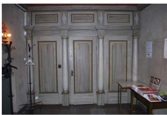
Vapenhuset med dörr till läktaren.

Taket är av sågade rödbruna brädor med en dekorationsmålning av ett grekiskt kors i en cirkel placerad mitt i taket. Tak och golvlister är marmoreringsmålade.