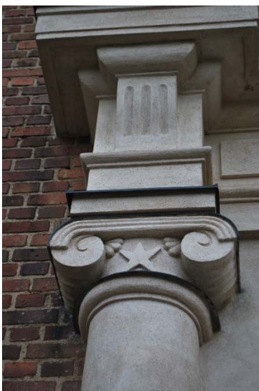
Detalj av portal.