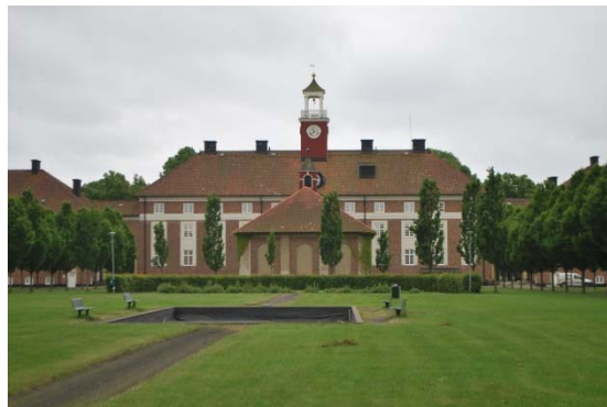
Borggården mot söder.