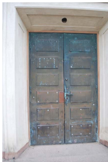
Port klädd med kopparplåtar.