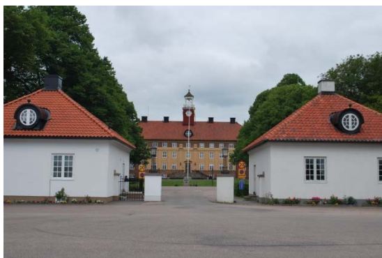
Entrén till fd sjukhusområdet.

Westmans sjukhusområde är planerat runt en perfekt symmetrisk strikt huvudgård, kring vilken områdets byggnader är placerade likt en mellansvensk bruksort. Längs en centralaxel ligger två grindstugor, en herrgårdsliknande administrationsbyggnad med klocktorn i söder, en borggård med spegeldamm och kyrka och längst i norr en ekonomibygnad. Längs borggårdens östra och västra sidor ligger sjukhuspaviljongerna i två och tre våningar. Gården har spikraka gångar kantade med trädrader. Sjukhuset hade även eget tvätteri, växthus, öppna solpaviljonger, personalbostäder, vattenverk och park som tillsammans utgjorde ett eget samhälle utanför staden. Utanför borggården är planeringen mindre strikt och har mer karaktär av engelsk park med små skogsdungar mellan husen. Under byggnaderna finns ett kulvertsystem som förbinder husen med varandra. Husen är uppförda i rött tegel med putsade partier, småspröjsade fönster och tegeltak. Stilen är främst 1920-tals klassicism med drag av nationalromantik.