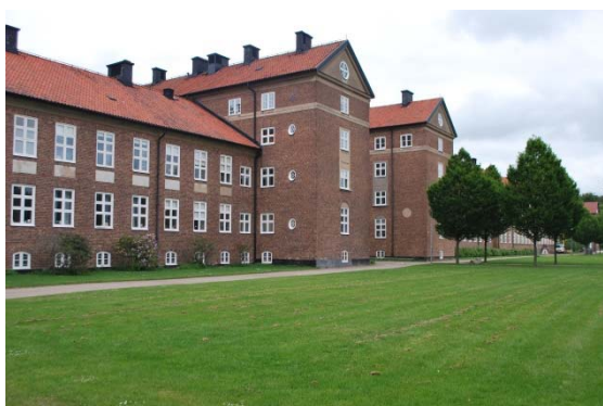
Fd sjukhuspaviljongerna på borggården.