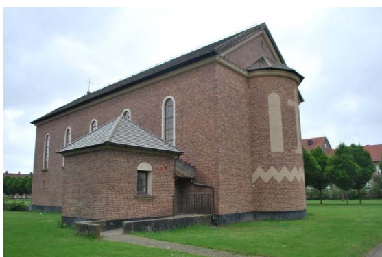
Kyrka och sakristia mot nordöst.