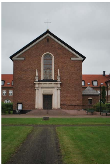
Kyrkans portal mot söder.

Porten är en utåtgående pardörr. Dörren är en fyllningsdörr av trä utvändigt klädd med koppar. Kopparplåtarna är fästade med stora spik med svagt fyrsidiga skallar.