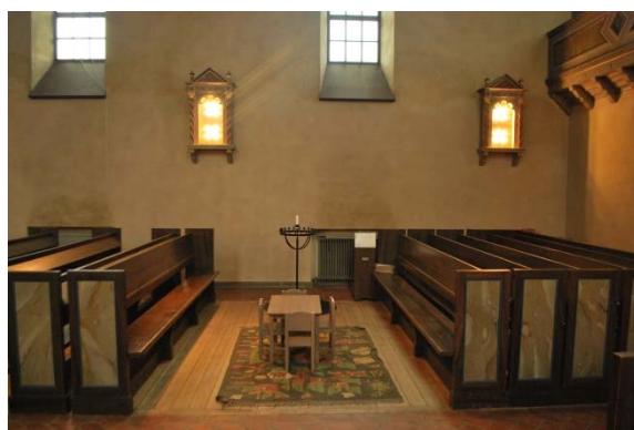
Barnhörna i långhus. Väggharmatur i skåp.

Orgelläktaren nås från en dörr i vapenhuset och trappa och är en del av kyrkorummet med väggar och tak lika detta. På golvet ligger en heltäckningsmatta. Barriären består av täta fyllningar, mot kyrkorummet är barriären utkragande och stöds av profilerade konsoler. Barriärens fyllningar består delvis av diagonalt placerade kvadrater och är marmoreringsmålade. Bakom orgeln finns kyrkans stora gavelfönster som är omgivet