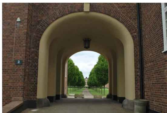
Mot borggårdens raka trädrader.

Kyrkan ligger på borggården omgiven av gräsmattor, en damm och raka gångar och trädrader. Ingen kyrkogård omger kyrkan. Kyrkan ligger i nord-sydlig riktning. Den strikt symmetriska planen för sjukhusområdet var viktigare än att placera kyrkan i det sedvanliga läget med koret i öster. En grusad halvcirkelformad grusplan är kyrkans