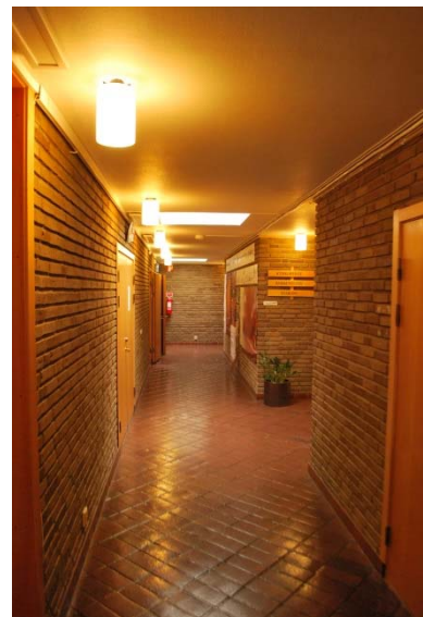
Korridor i församlingshem.

Dopfunt , från 2007 av inredningsarkitekt Karin Ljungberg, av trä och sten. En öppen kvadratisk benställning av oljad ek och skiva av slipad kalksten med lågerhuggen kant.