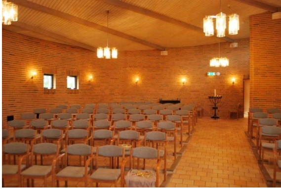
Kyrkorummet mot entrén.