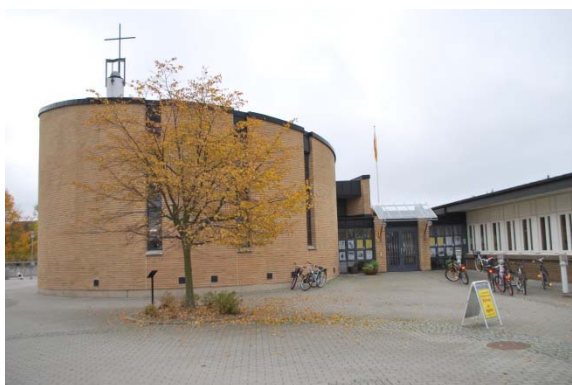
Kyrkan mot norr och torget. Entrén.

Kyrkans grund och låga sockel är av betong. De runda murarna är av tegel både ut och invändigt med mellanliggande isolering. Teglet är i flera skiftande gula nyanser med inslag av röda och bruna stenar. Stenarna är hålkälstegel, vilket betyder att stenens kant har en insvängd profil, vilket medför att bruksfogen blir mycket bred. Teglet kommer från Kanik tegelbruk utanför Lund som numera är nerlagt. De breda fogarna är ljus varmgula. Förbandet är enbart av löpskift. Tegelväggen höjer sig från en lägre del i söder till en högsta punkt i öster. Inga takgesimser eller andra dekorationer i muren finns. Muren avslutas mot taket av en svart plåtkant. I nederkant av muren sitter svarta ventilationsgaller.