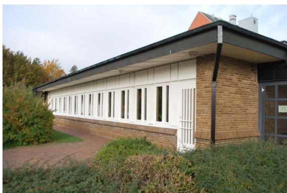
Församlingshemmet mot söder.