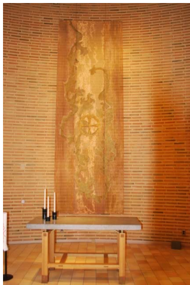
Altare och gobeläng.