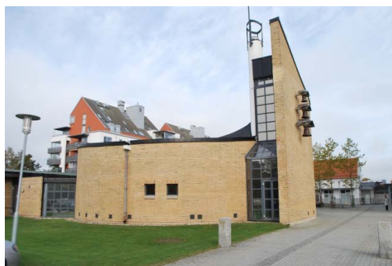
Kyrkan mot söder.