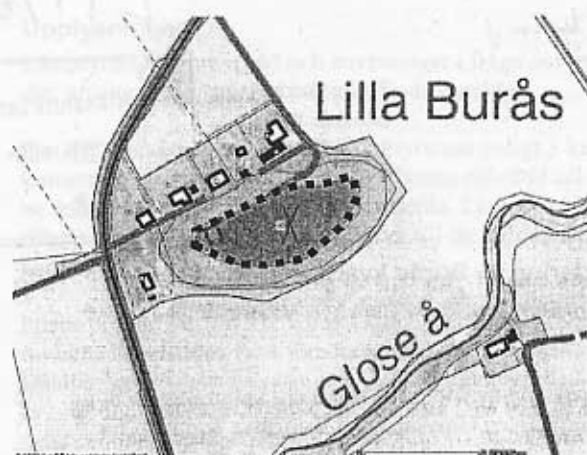
Fig. 1: Mörkmarkerat område utgör skyddsområde för byggnadsminnet Burås kvarn