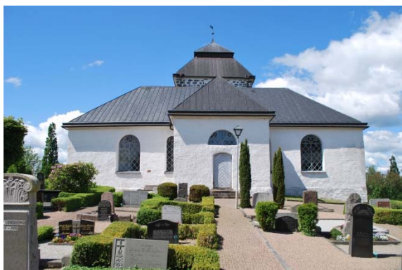
Fasad mot öster.

Kyrkobyggnaden består av ett torn i väster, korsarmar i norr och söder samt en utbyggnad för sakristia i öster. Tornet är medeltida men påbyggt 1796, norra korsarmen är från 1793 och den södra korsarmen från 1828 då även sakristian byggdes om.