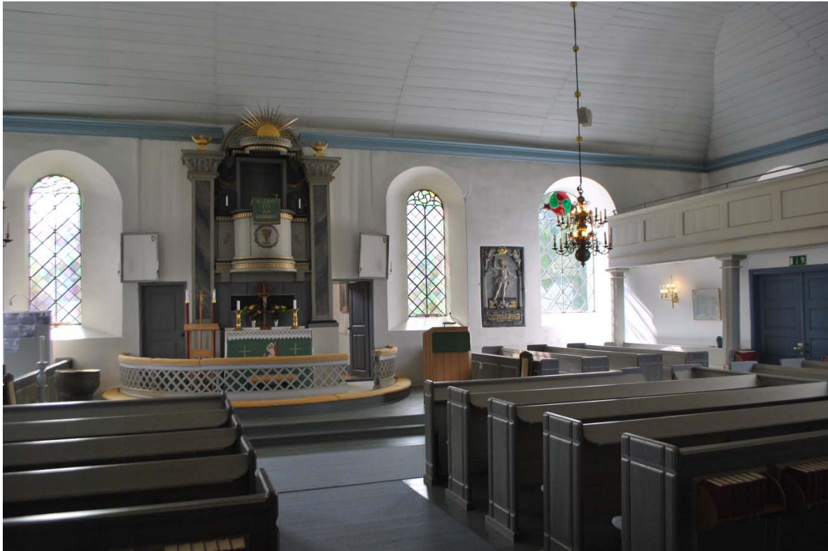
Mot altarpredikstolen i öster.