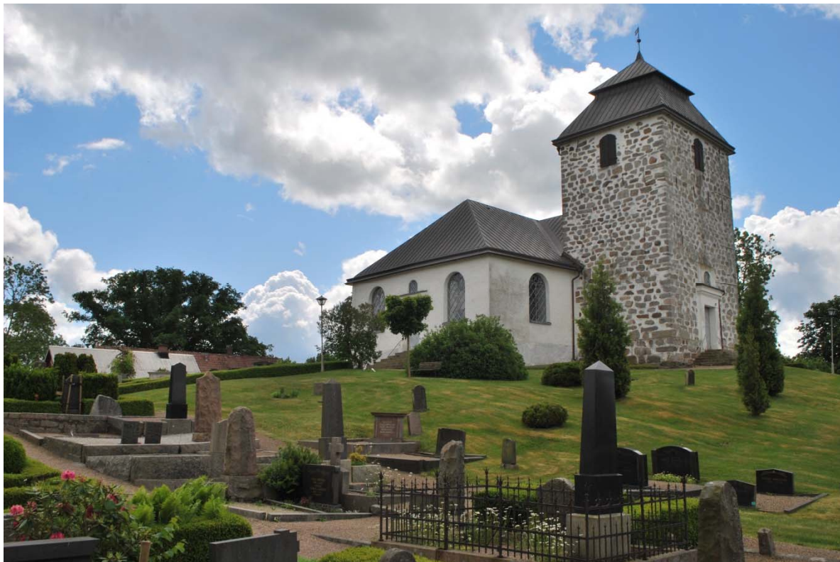
Fasad mot nordväst.