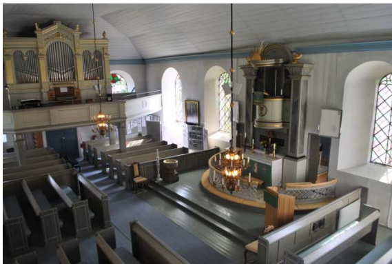
Från södra läktaren mot orgelläktaren i norr.