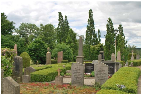
Kyrkogård söder om kyrkan.

Den nyaste delen i väster från 1954 ligger lägre och åtskiljs med en bred singelgång från den äldre delen. Marken är terrasserat och grässådd. De låga horisontella gravstenarna står i raka rader längs med klippta rygghäckar av bok och liguster. I sydvästra hörnet finns en grusad förplats omgiven av höga pelarklippta ekar. Omkring den ligger askgravlund, minneslund och urlund. Askgravlundens namnbrickor fästs på en gråstensmur. Minneslundens med en sten, ljusbärare och en blodlönn omges av en tujahäck.