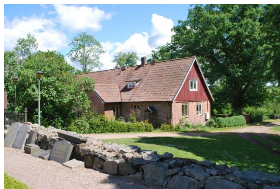
Öster om kyrkogården.