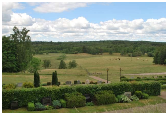
Västra utvidgade delen av kyrkogården.