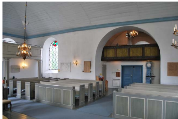
Mot läktaren i väster.