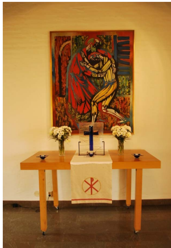
[3]: Altarbord och altartavla

Altarring saknas. Tidigare har funnits ett skrank i ek. I sakristian står två bönpallar i ljus ek med knäfall och överliggare klädda i blått ulltyg. Dessa är från 1980 och ritade av Arne Magnusson.