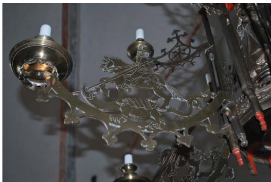
Detalj av ljuskrona.

Johannes döparen under en gotisk baldakin. Från mitten utgår ljusarmar i två våningar, där den nedre raden har bilder av S:t Göran och draken. Den nedre raden är ursprunglig. Kronan avslutas nedtill med ett lejonhuvud och upptill av en korsblomma. Denna krona ansågs så unik att den visades på Världsutställningen i Paris 1867 och Baltiska utställningen i Malmö 1914.