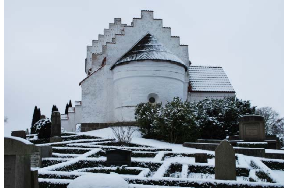
Kyrkan från öster. Runt fönster i absiden.