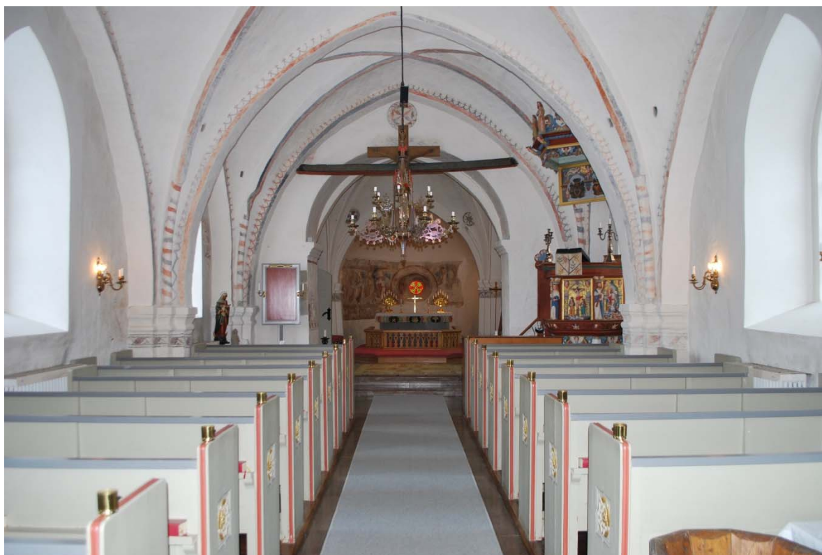
Långhuset mot altaret i öster.

glasruta med ett mantuanskt kors, (likarmat kors med breda utsvängda armar). I långhuset kommer man in under orgelläktaren som bärs av åtta pelare, sex av dem infogade i väggen mot vapenhuset. Taket (orgelläktarens undersida) är reveterat och målat.