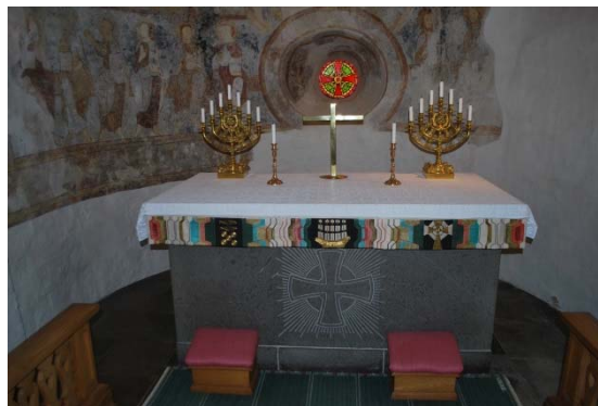
Absiden med altare, runt fönster och kalkmålning.

Bänkinredningen från 1917 är ritad av Theodor Wåhlin. Ny färgsättning gjordes 1960 av Eiler Græbe. Bänkarna är öppna utan dörrar och uppdelade i tre kvarter. Gavlarna har rektangulär form och är dekorerade med en utskuren förgylld blomma i en kvadrat av girlander. Bänkryggarna är ramverk med fyllningar. Fotstöd, psalmbokshylla och väskkrok är integrerade. Bänkarna är målade i grått med accenter i rött, blått och förgyllning. Dynor med randigt rött tyg ligger i bänkarna.