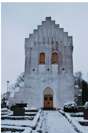
Tornet i väster.