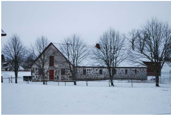
Ekonomibyggnad på Sireköpinge säteri.