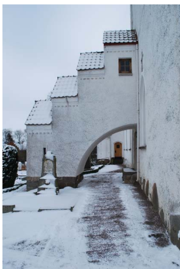
Strävpelare med trapphus till tornet.

kalkmålningar togs fram. Utvändigt gjordes puts- och målningsarbete, liksom 1995 och 2000.