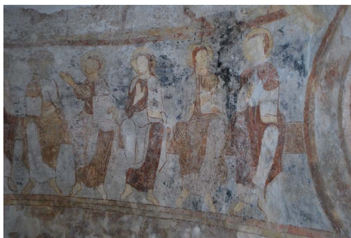
Kalkmålning vid absidfönstret från ca 1175.

Från koret nås sakristian genom en segmentbågig öppning som sitter i en större spetsbågig nisch. Dörren är en fyllningsdörr med bandgångjärn och beslag avslutade med treklöverform. Golvet i sakristian är av grå linoleum, väggarna putsade och vitmålade. De spröjsade ekfönstren är rakt täckta mot norr och segmentbågigt täckta mot öster. Vindfånget, med utvändig entré till sakristian, har kalkstensgolv.