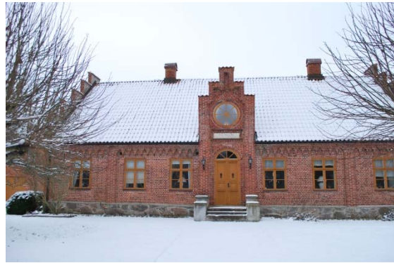
Martina von Schwerins skola mitt emot kyrkan.

böjd upp mot kyrkans entré. Längs den omgärdande häcken går en singelgång, liksom runt kyrkan. De flesta gravplatserna är buxbomsinramade, några få har stenramar, en har järnkätting. Gångarna mellan buxbomskvarteren är mycket smala. Kyrkogården är mycket välbevarad i sin struktur utan gräsbesådda gravar. I backen ner mot Råån finns minneslundan med ett vattenspel och en ljusbärare. Gravstenarna är varierande.