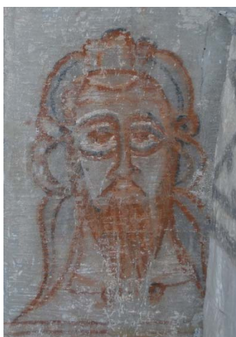
Målning från före 1175.

Golvet i koret ligger två steg högre än långhuset.