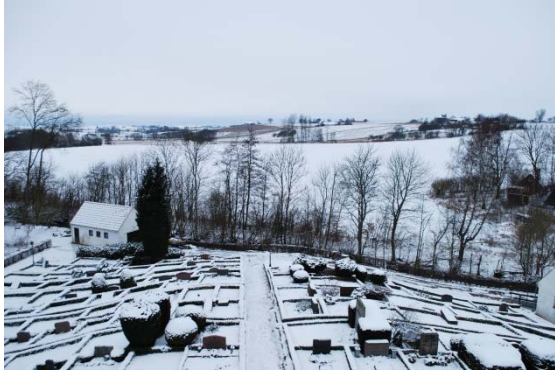
Kyrkogården och Råån mot väster.