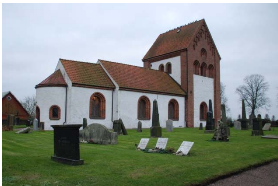
[6]: Gamla kyrkogården

muren utgör en fortsättning på 1897 års kvarter med grusade och stenkantade gravplatser. De äldsta gravarna, som finns längs den västra sidan, är ofta låga diabasvårdar, medan stenarna i norr är yngre i funktionalistisk stil. Gravplatsernas växtlighet varierar kraftigt med inslag av både mer moderna växter och frodig vintergrönska.