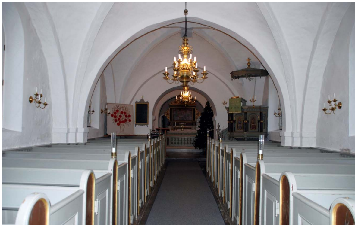
[3] Långhuset mot koret

slätputsade och målade med modern, vit färg. Kalkmålningarna är förputsade.