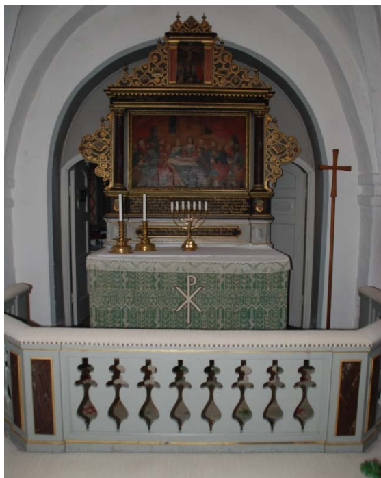
[4]: Altarring, altare och altaruppsats

Predikstolen [5] är byggd 1880 av byggmästare N. Andersson. Den sexsidiga korgen står på ett sexkantigt profilerat skaft. Överliggaren, dekorerad med urskurna rosor, bärs av brunmarmorerade pelare, som kopplats med kolonetter på ömse sidor. På dessa ligger entablement, som bär äggstavsdekorerade rundbågar. I bågarne finns målningar som föreställer Petrus och evangelisterna. Räckesbarriären är tät med rundbågiga speglar. Ovan predikstolen hänger en sexkantig baldakin krönt med ett klöverbladskors. Ljudtakets insida är dekorerad med ett strålförmigt listverk och en hängande duva.