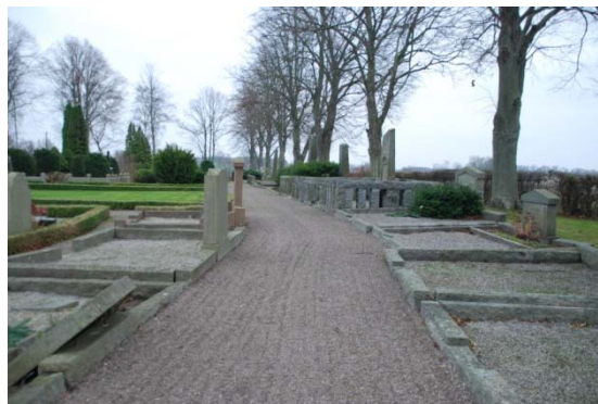
[8]: Utvidgningen från 1897 med stenkantade gravar