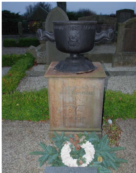
[9]: Nils A Lindströms grav av gjutjärn

Minnes- och urnlundarna är anlagda längs den nya kyrkogårdens östra kant. Minneslundens är täckt av gräs med en central, stenkantad plantering med olika marktäckare. I gräset står en natursten med texten ”Ingen är glömd av Gud”. Urnlunden består av två rader av stenkantade gravplatser, lagda på ömse sidor om en stensatt mittgång.