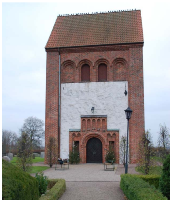
[1]: Tornet mot väster

är, att kormurarna murats om vid något tillfälle. Hörnkedjor och omfattningar är av kvaderhuggen sandsten, som idag har överputsats. Skillnaden i bearbetning mellan grå- och sandstenen kan anas i fasaderna, då dess sandstenshörn är slätare än övriga murpartier. Absiden och tornets nedre del är uppförda av kluven gråsten. I tornets hörn finns tegelpilastrar, som bär upp tornets övre del med massivmurar i tegel murade i vendiskt förband [1]. Den östra tornmuren är dock av putsad gråsten ända upp till takgesimsen. I teglet märks ett antal lagningar, vars stenar har en rödare, mer homogen färg än de ursprungliga. I fasaderna sitter flera ankarjärn av olika typ.