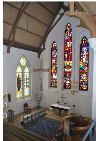
Koret från läktaren.