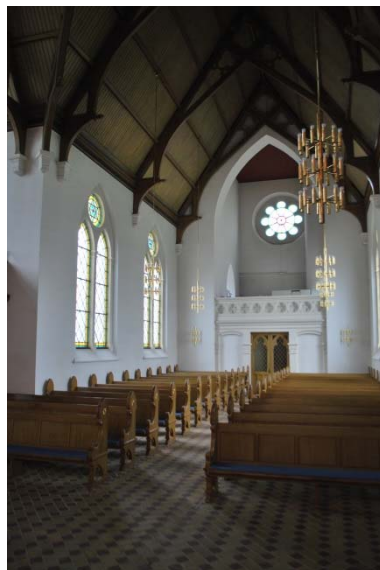
Långhuset mot väster.