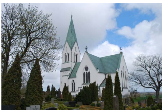
Fasad mot nordöst.

Kyrkan är troligtvis grundlagd på en kallmur av natursten. Frilagda grundstenar är delvis synliga vid koret. Runt byggnaden finns en gråmålad sockel med skråkant och list mot dagemurarna. Den senare tillbyggda sakristian har sockel av granitplattor i liv med fasaden. Murarna är uppförda av tegel som är spritputsat och vitmålat. Sakristian är slätputsad. Kyrkans listverk, fönsteromfattningar, kapital och pelarbaser är gjutna av betong och inte putsade utan endast avfärgade. Vid renoveringen 2009 framkom att ett parti av tornets norra och västra mur var murade av delvis tuktad sandsten och granit, alltså fanns medeltida murverk upp till ca fem meters höjd och därovan tegel. I den antikvariska rapporten från 2009 framkommer också teorin att de gjutna cementornamenten antagligen varit omålade, och det har därmed varit en kontrast mellan grå ornament och vita murar.