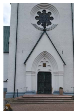
Entréport i tornet.

Öppningar för fönster och portar är spetsbågiga i nygotisk stil.