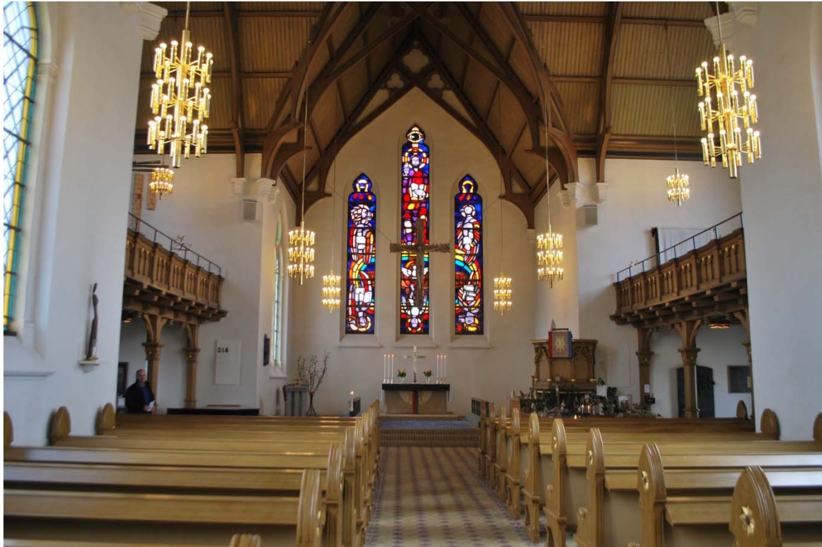
Vy från långhuset mot koret.