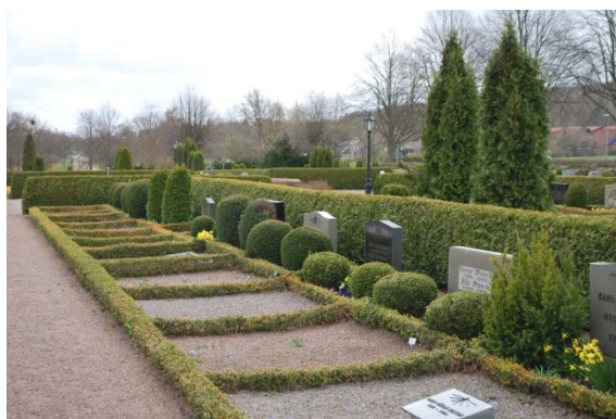
Gravplatser längs rygghäckar.