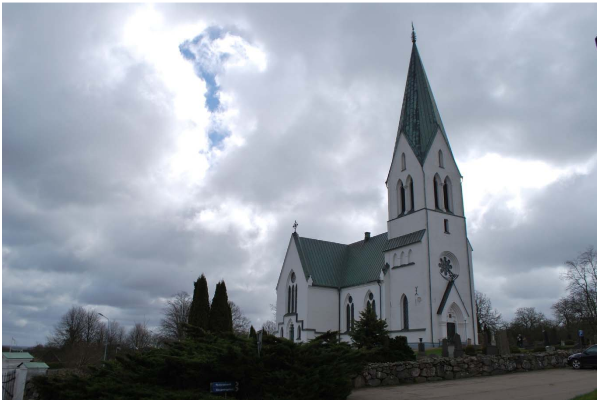
Fasad mot nordväst.