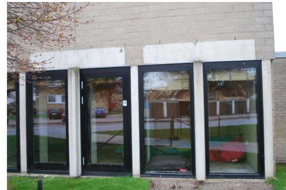
Betongbalkar som bildar T-kors. Fasad väster.

Sakristian intill kyrkorummet har golv och väggar lika övriga rum. Fönstren är utbytta mot vita fönster till skillnad mot alla övriga fönster som är svarta.