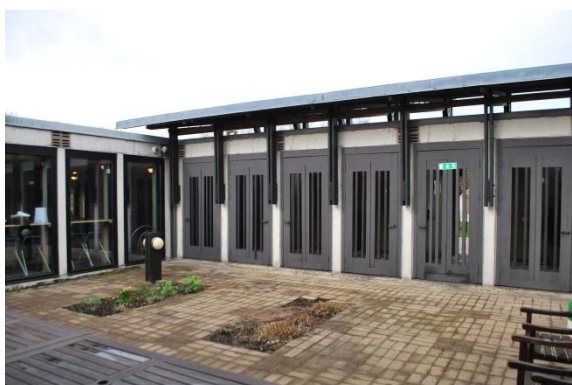
Atriumgården med dörrarna till förrummet.