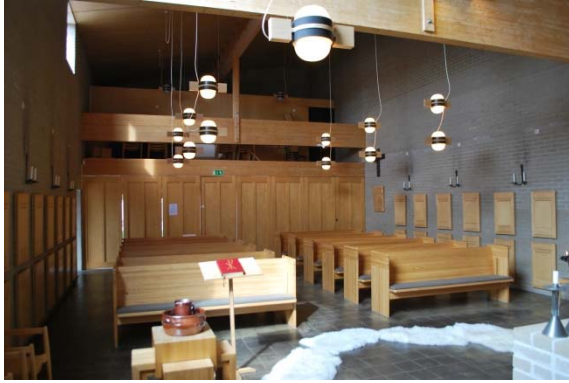
Kyrkorummet mot väster.