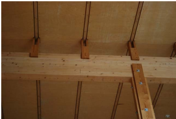
Taket i kyrkorummet.