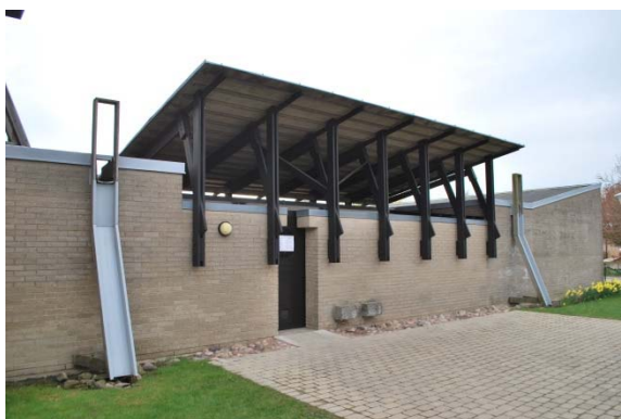
Entré. Fasad mot väster. Avvattning med öppna rännor.

öppna trärännor klädda med aluzink som vinklas ut från fasaden. På äldre vykort ser det ut som dessa rännor varit oklädda eller täckta med svart plåt.