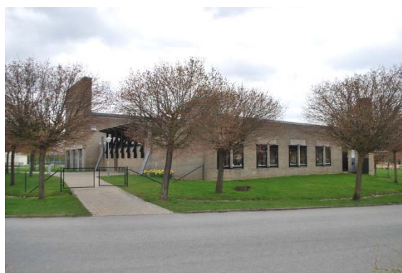
Fasad mot sydväst.

Klockrum och fläktrum nås utifrån med en galvad gallerdukstrappa på kyrkans norrsida. Svarta bräddörrar täcker ingången. Klockan hänger i en metallställning. Kyrkans norr och östsida är täta förutom denna bräddörr.