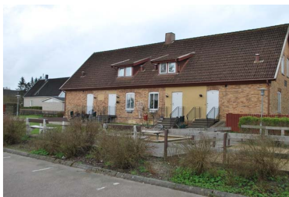
Arbetsbostäder och kolbodor ritade av Martin Cronsiö. Arbetsbostäder från gruvtiden.

Efter gruvans nedläggning var Hyllinge länge en liten by, men på 1970-talet började samhället åter växa med småhus. De gamla gruvhusen omges idag av bebyggelse från 1970-talet och framåt. De flesta är fristående villor men även lägenheter i tvåvåningshus finns. I byn finns skola, folkets hus, idrottsplats och kyrka. På senare år