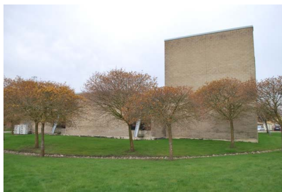
Fasad mot öster.